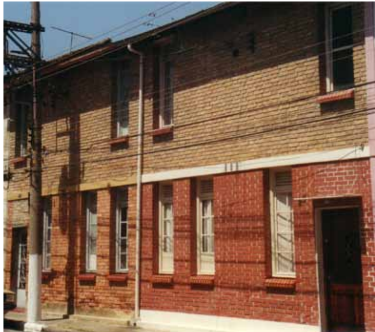
Figura 49 – Casas de operários e técnicos especializados na Vila Boyes, construída entre 1919 e 1924, pela Fábrica São Simeão, São Paulo (SP). Fotografia de Philip Gunn, 2001.