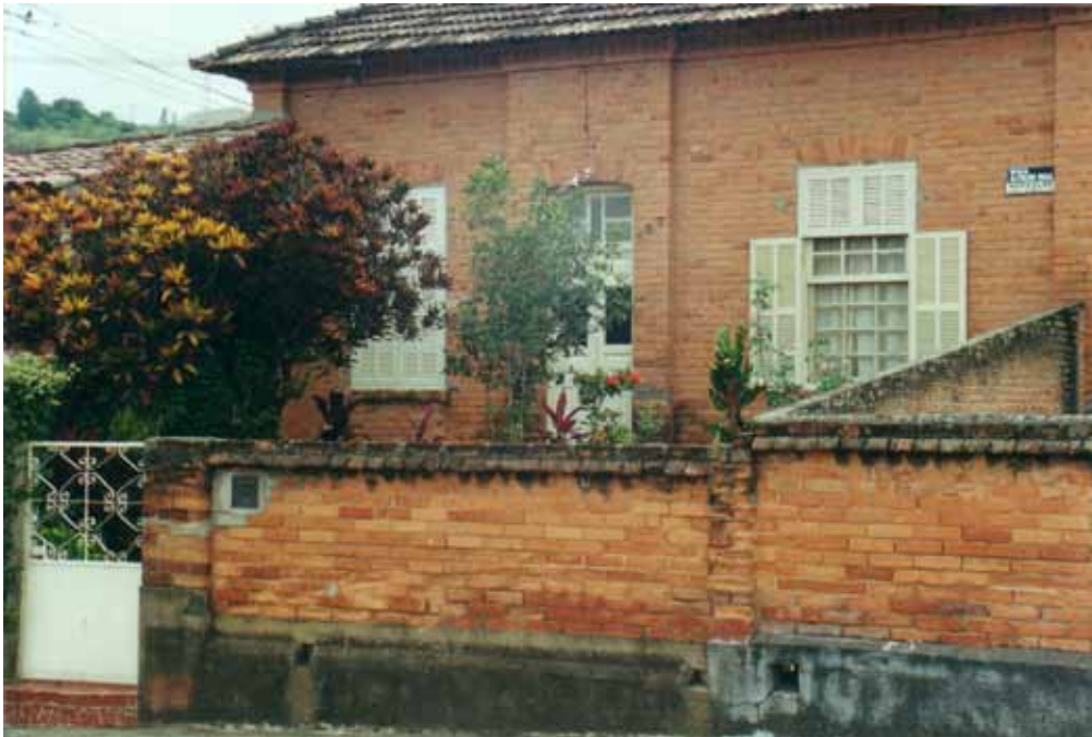
Figura 22 – Casas para técnicos especializados erguidas pela Fábrica de Estamparia e Alvejaria Votorantim, em Votorantim (SP). Fotografia de Philip Gunn, 2002.