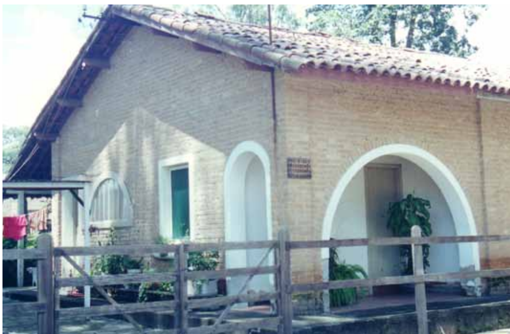
Figura 31 – Casas construídas pela Tecelagem Parahyba, em São José dos Campos (SP). Fotografia de Philip Gunn, 2001.