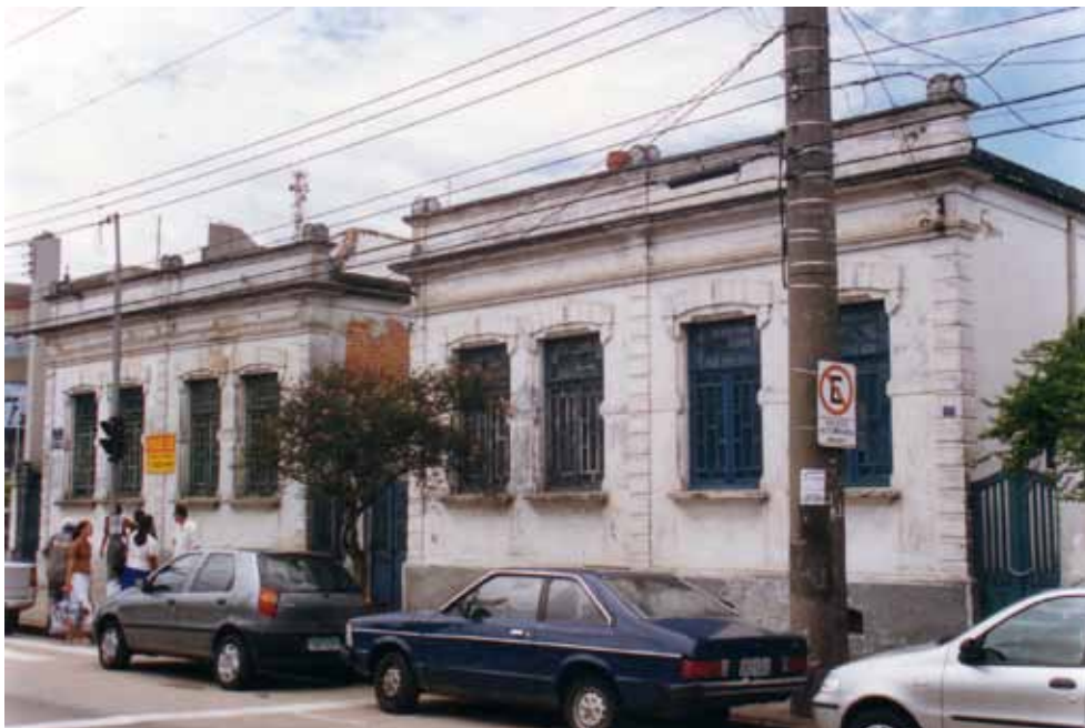
Figura 1 – Vila operária da Fábrica São Bento, em Jundiaí (SP). 2002.

A platibanda é, frequentemente, o elemento de destaque na composição das fachadas das casas. É nela que – sobretudo nos modelos de casas mais simples, geminadas ou em renque – os ornatos, geralmente escassos, se concentram; ou é sobre ela que são dispostos os elementos decorativos mais expressivos da composição. Nesse sentido são exemplos as vilas operárias: da