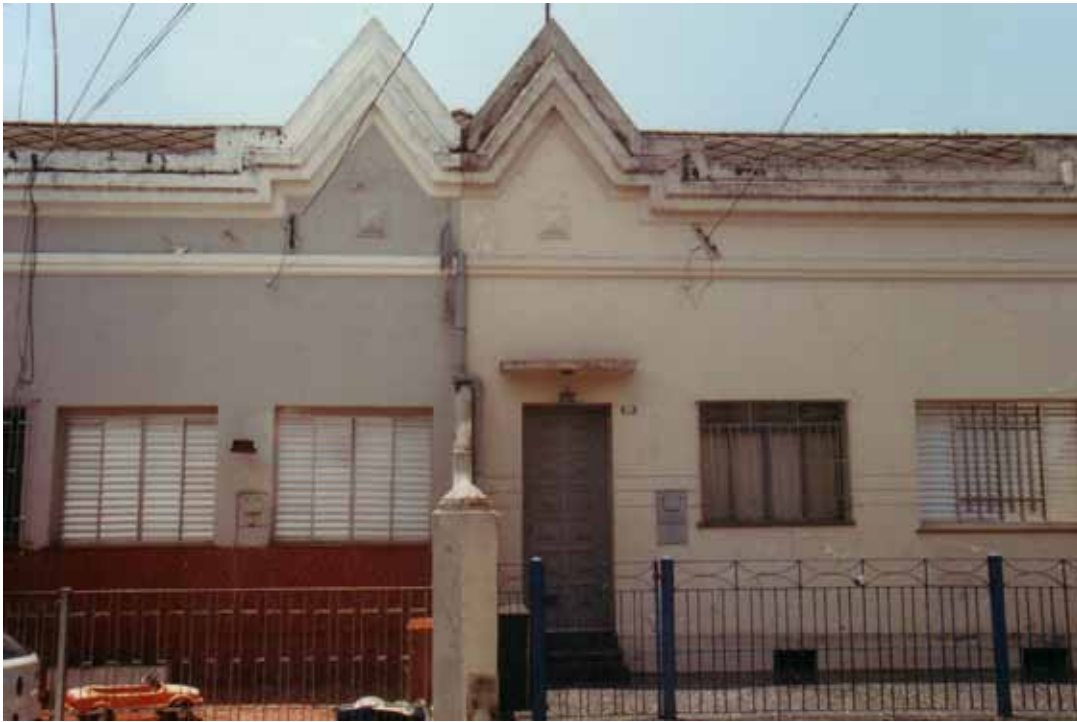
Figura 45 – Casas na Vila Maria Zélia, em São Paulo (SP). Fotografia de Philip Gunn, 2001.