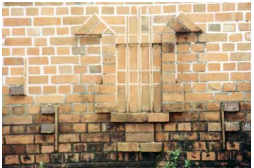
Figura 37c – Igreja em Rio Tinto (PB). Fotografia de Philip Gunn, 2002.