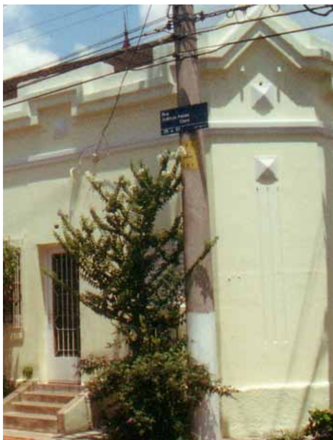
Figura 47a – Detalhe da composição de fachada de casa na Vila Maria Zélia, em São Paulo (SP).