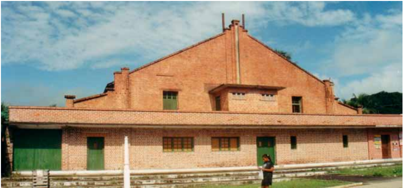
Figura 35 – Prédio do cinema, em Rio Tinto (PB). Fotografia de Philip Gunn, 2002.