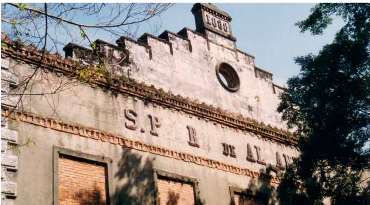
Figura 15 – Fábrica São Pedro de Alcântara, erguida em 1888 em Petrópolis (RJ). Fotografia de Philip Gunn, 1998.