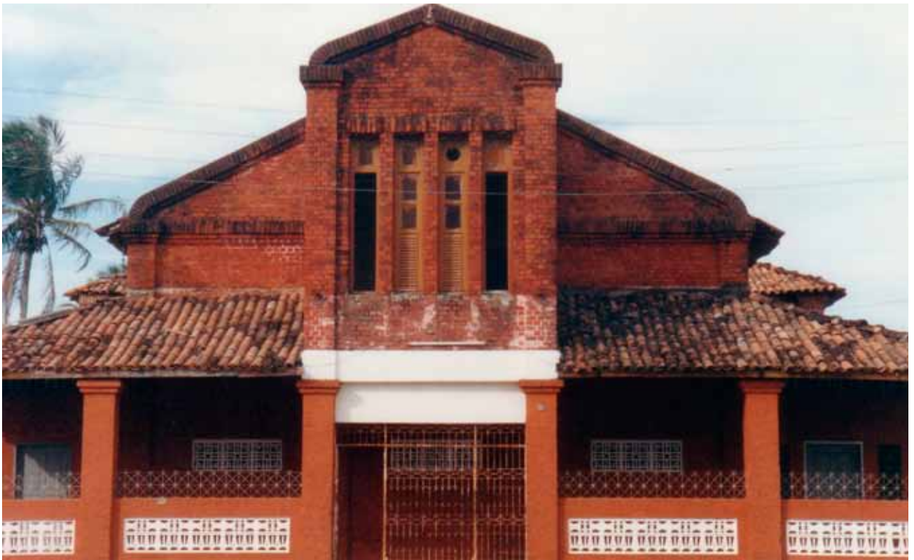
Figura 36 – Prédio do Clube da Vila Regina, em Rio Tinto (PB). Fotografia de Philip Gunn, 1996.