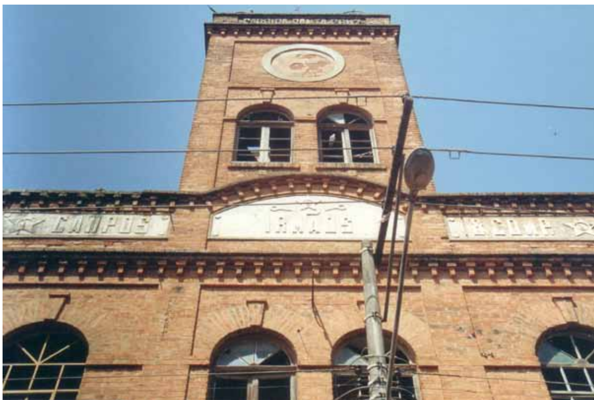
Figura 20 – Fábrica Santa Adélia, fundada em 1908, em Tatuí (SP). 2001.