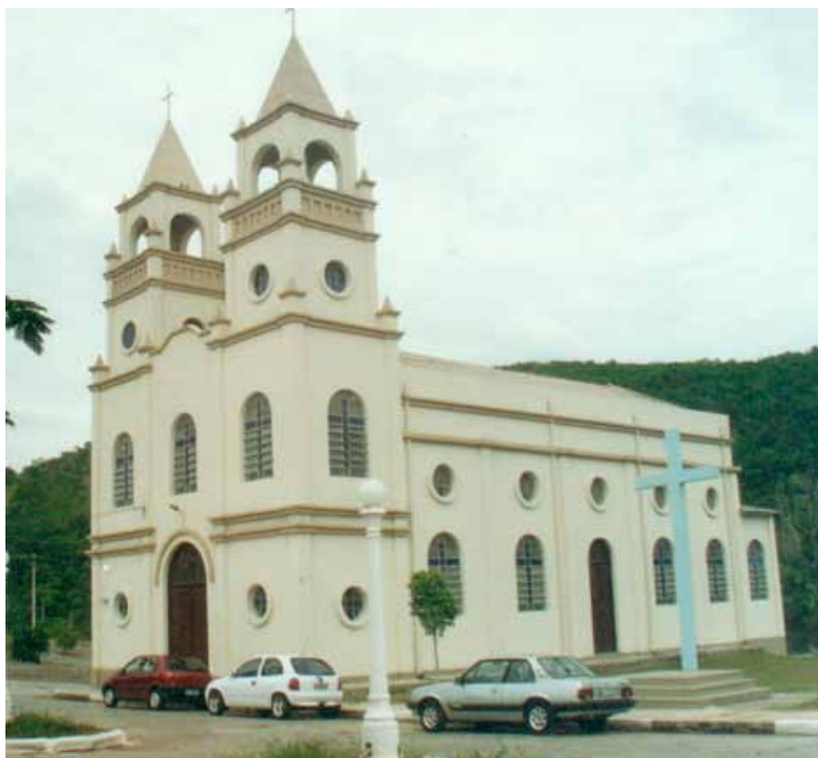
Figura 10 – Igreja da Vila Santa Helena, construída pelo Grupo Votorantim, Votorantim (SP). Fotografia de Philip Gunn, 2002.