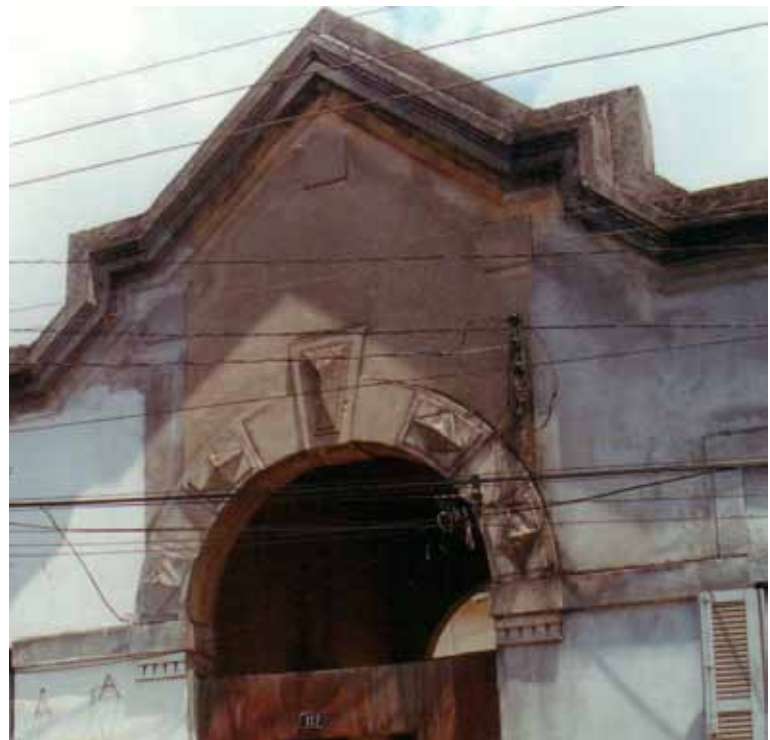
Figura 48 – Detalhes da composição das fachadas dos alojamentos na Vila Maria Zélia, em São Paulo (SP).