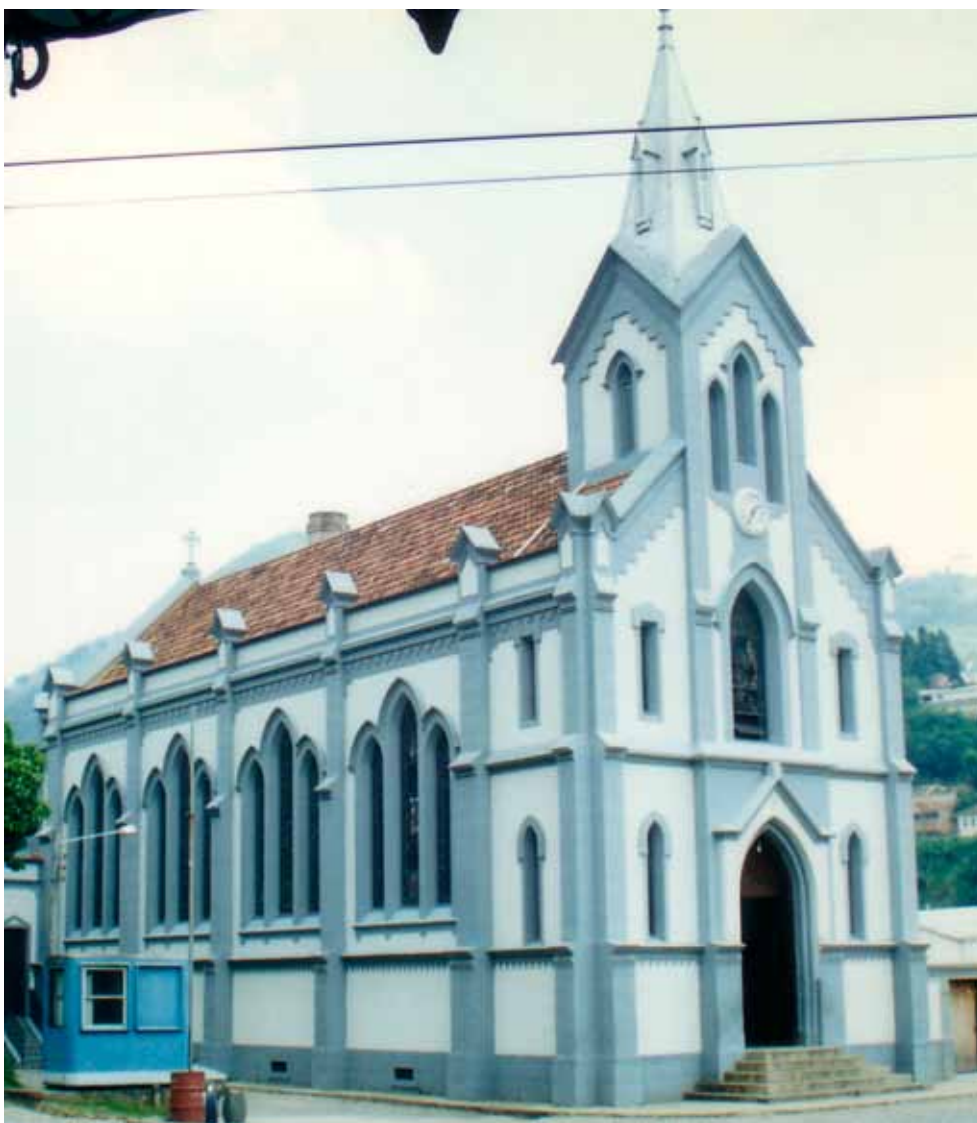
Figura 7 – Igreja Cascatinha, no município de Petrópolis (RJ). Fotografia de Philip Gunn, 1998.

16. Construída pela Fábrica de Cimento Votorantim, Votoran, em Votorantim (SP).