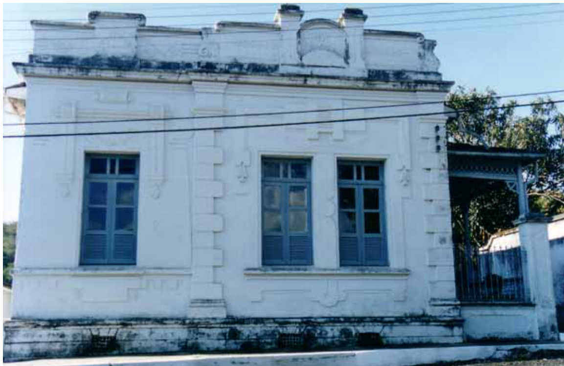
Figura 4a – Casa da Cia. Cachoeira de Macacos (MG).