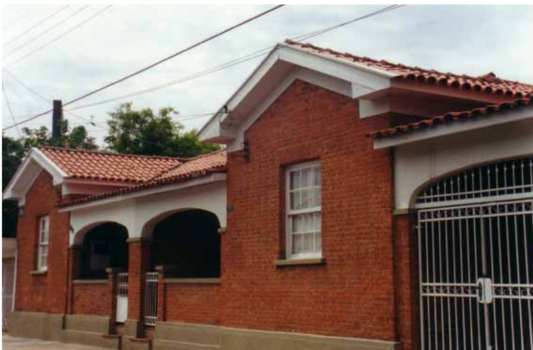
Figura 29 – Vila da Barra do Tietê, erguida pela Brasital na década de 1940, em Salto (SP). Fotografia de Philip Gunn, 2001.

27. Cf. Carla Milano Benclowicz (1989, p. 405).