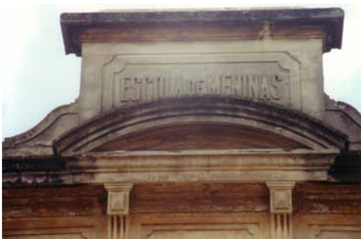
Figura 43 – Detalhe da fachada de escola na Vila Maria Zélia, em São Paulo (SP). Fotografia de Philip Gunn, 2001.