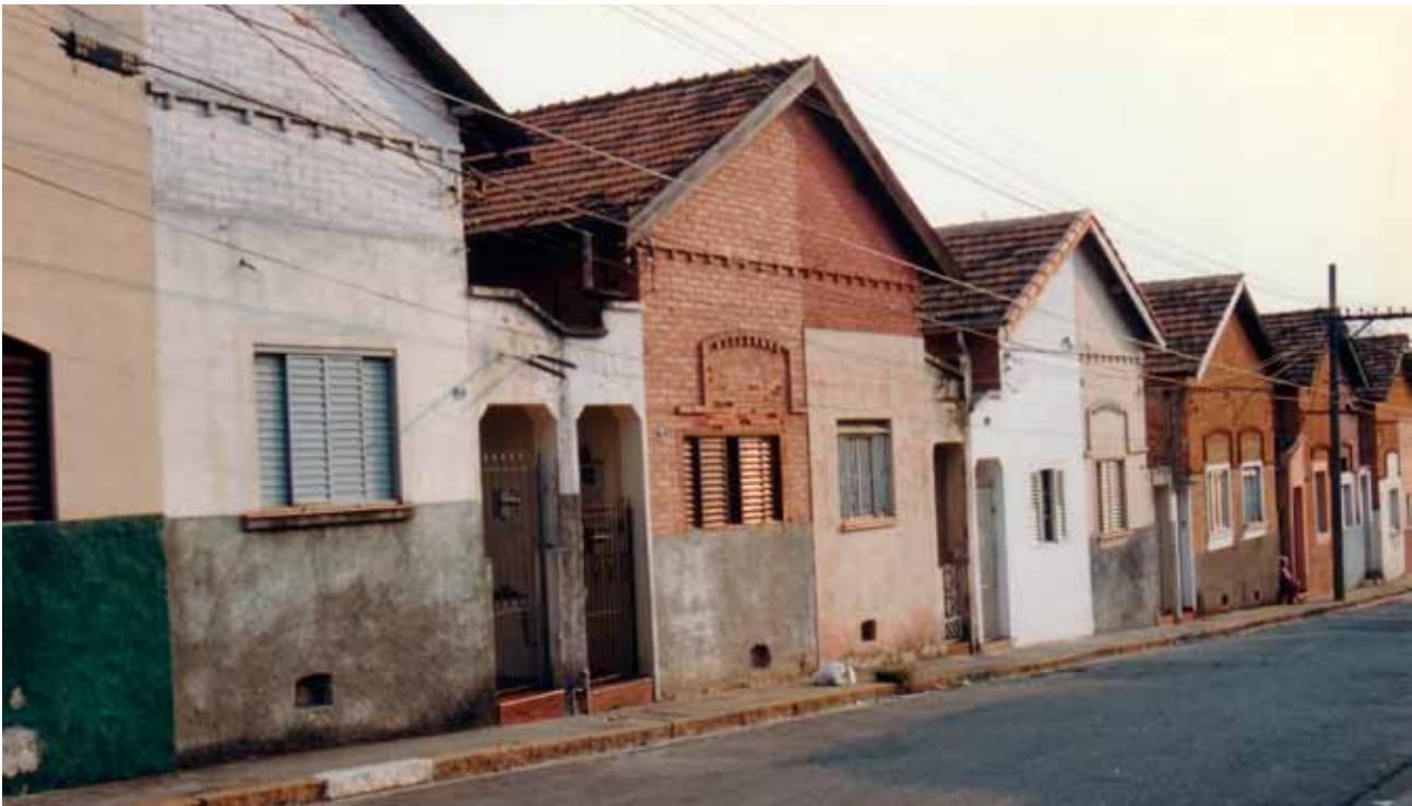
Figura 24 – Casas da vila da Companhia de Fiação e Tecidos Santa Maria, em Sorocaba (SP). Fotografia de Philip Gunn, 2002.

Nas instalações fabris, o material recobre e confere unidade a um conjunto de prédios dotados de motivos da linguagem clássica – frontão, cornija,