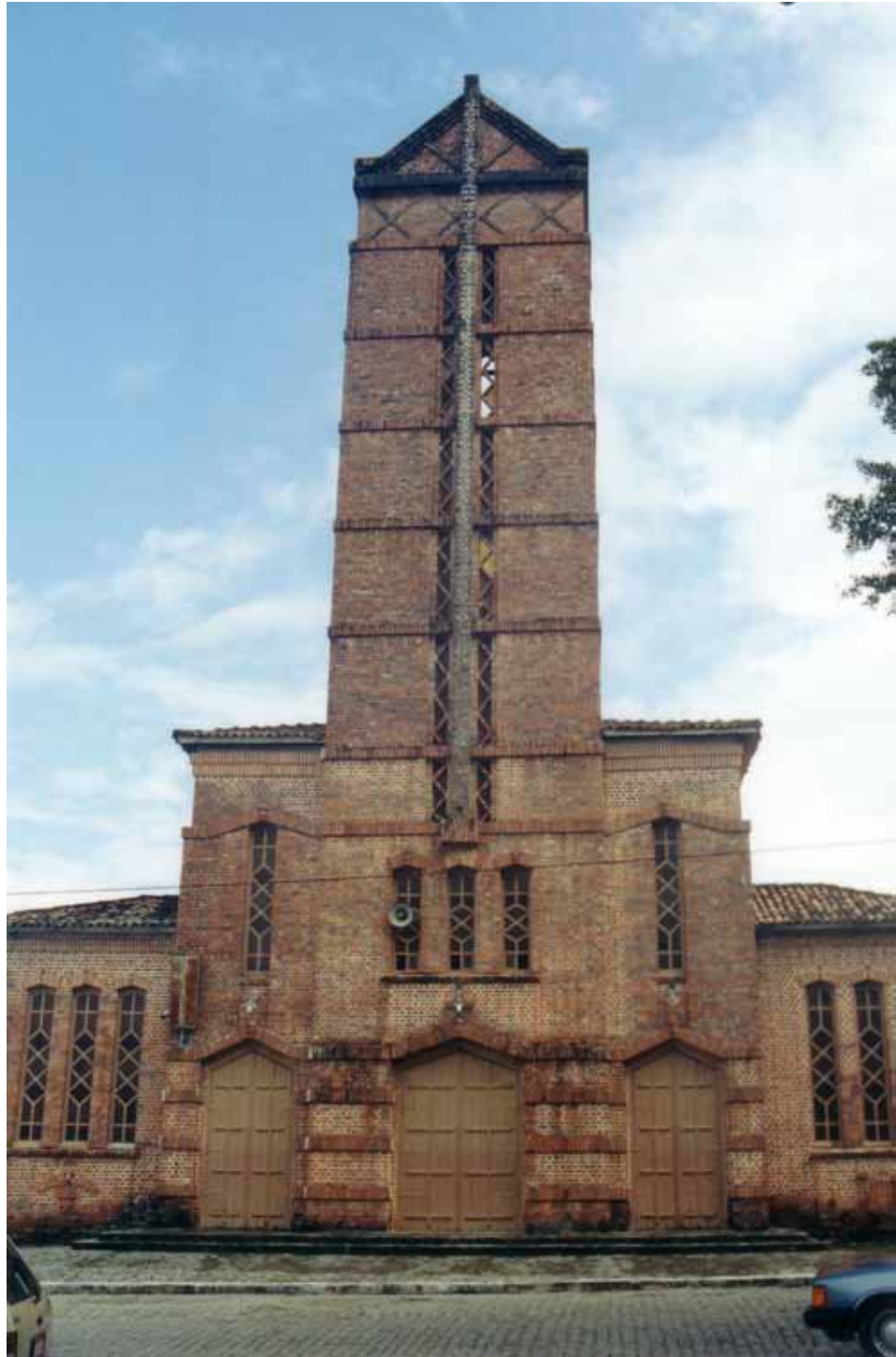
Figura 37a – Igreja em Rio Tinto (PB). Fotografia de Philip Gunn, 1996.