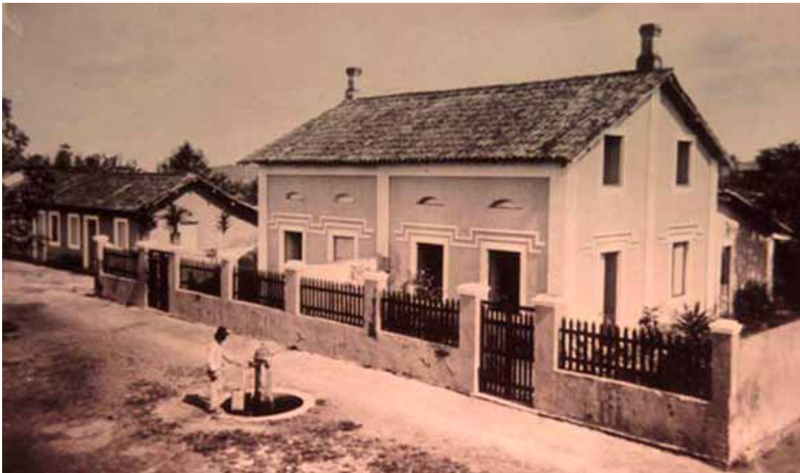
Figura 39 – Casas em Camaragibe (PE).