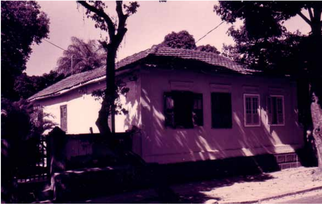
Figura 38 – Casas na vila operária da Companhia Progresso Industrial do Brasil, no bairro de Bangu, Rio de Janeiro (RJ). 1996.