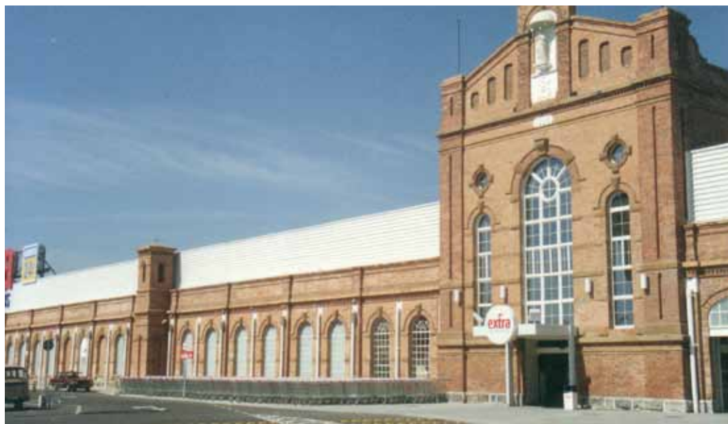
Figura 17 – Fábrica de Fiação e Tecidos Santa Rosália, construída em 1890, em Sorocaba (SP).