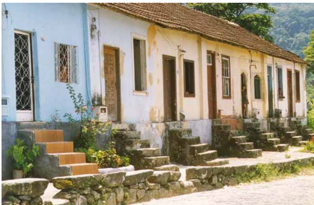
Figura 54 – Casas no núcleo fabril da Companhia de Fiação Cometa (Meio da Serra), Petrópolis (RJ). Fotografia de Philip Gunn, 1998.

Itabirito Industrial em Itabirito (MG). Em construções de madeira ou de alvenaria de tijolos, a tipologia surge no Rio Grande do Sul, em núcleos habitacionais criados por empresas de mineração, como: Butiá, da Companhia Carbonífera Rio-Grandense, construído entre 1917 e a década de 1950; Arroio dos Ratos, da Companhia Estrada de Ferro e Minas São Jerônimo, construído entre o final do século XIX e a década de 1950; e Vila da Copelmi, em Charqueadas, construída a partir do final da década de 1940.