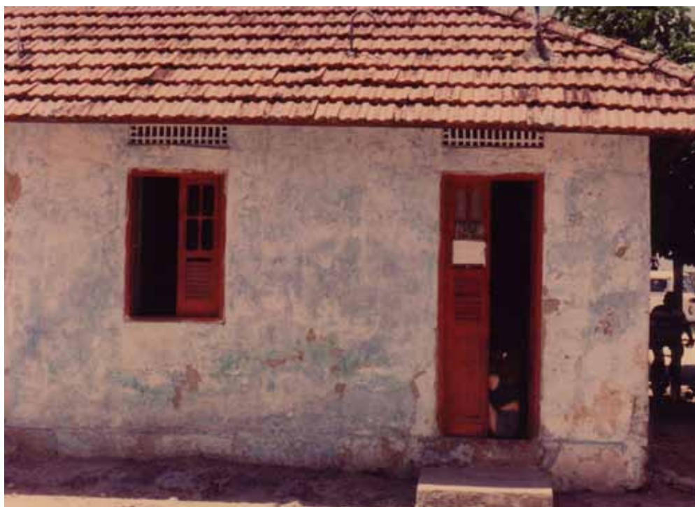
Figura 58 – Vila Iolanda, no Recife (PE) 1996.