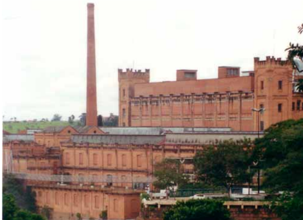
Figura 26 – Fábrica da Brasital, em Salto (SP).