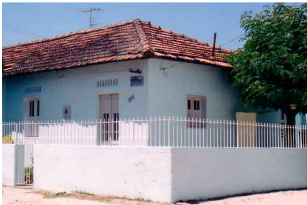
Figura 59 – Vila do Pombal, no Recife (PE).