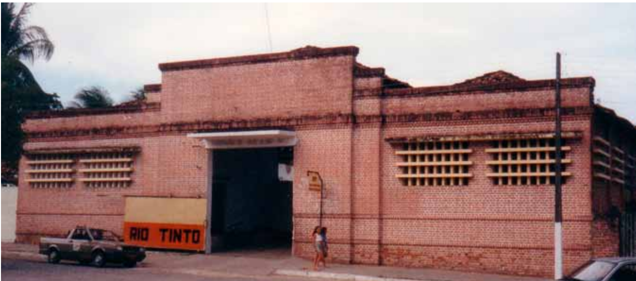
Figura 34 – Prédio do armazém de consumo, em Rio Tinto (PB). Fotografia de Philip Gunn, 2002.

Em construções posteriores erguidas em Rio Tinto – como a portaria da fábrica –, o tijolo aparente persiste, agora integrando composição filiada ao Estílo Internacional de arquitetura moderna.