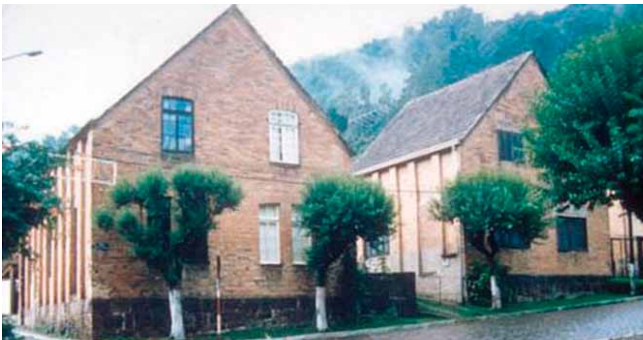
Figura 25 – Sobrados erguidos pelo Lanificio São Pedro, em Galópolis (RS). Fotografia de Philip Gunn, 1998.

óculo e pilastra –, um deles articulando esses motivos a outros, que remetem a fortalezas – torres e ameias (Figura 26). Anicleide Zequini considera possível que o prédio original da fábrica, inaugurado em 1875, tenha sido projetado pelos engenheiros da firma inglesa Platt Brothers & Co, que vendeu as máquinas para a indústria 26 .