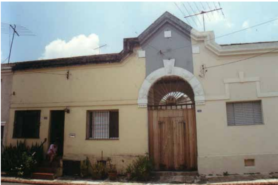
Figura 46 – Alojamento para Solteiros na Vila Maria Zélia, em São Paulo (SP). Fotografia de Philip Gunn, 2001.