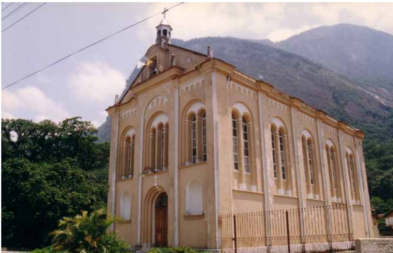
Figura 6 – Igreja da Fábrica Cometa, Meio da Serra, no município de Petrópolis (RJ). Fotografia de Philip Gunn, 1998.