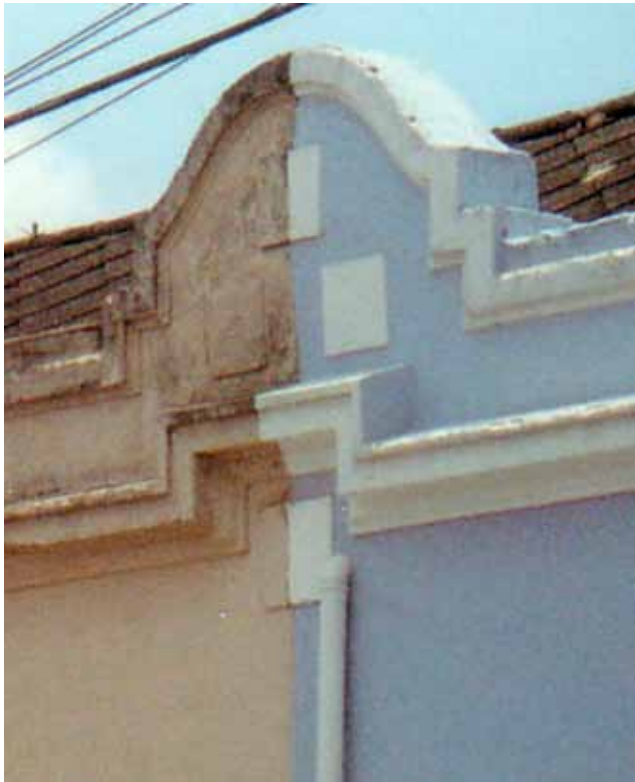
Figura 47c – Detalhe da composição de fachada de casa na Vila Maria Zélia, em São Paulo (SP). Fotografia de Philip Gunn, 2001.