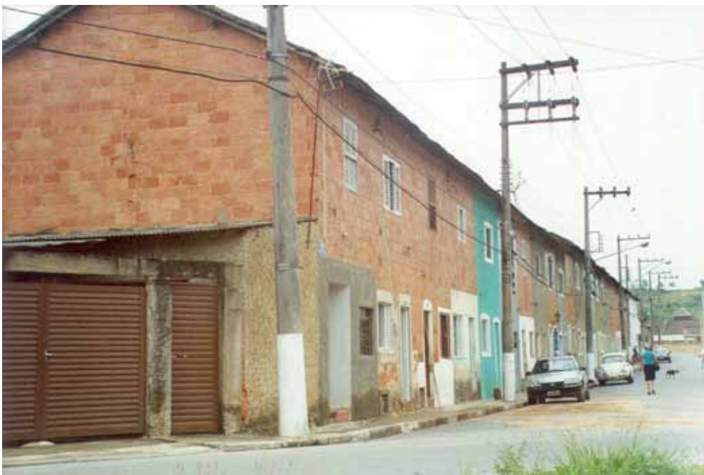
Figura 23 – Casas para operários erguidas pela Fábrica de Estamparia e Alvejaria Votorantim, em Votorantim (SP).