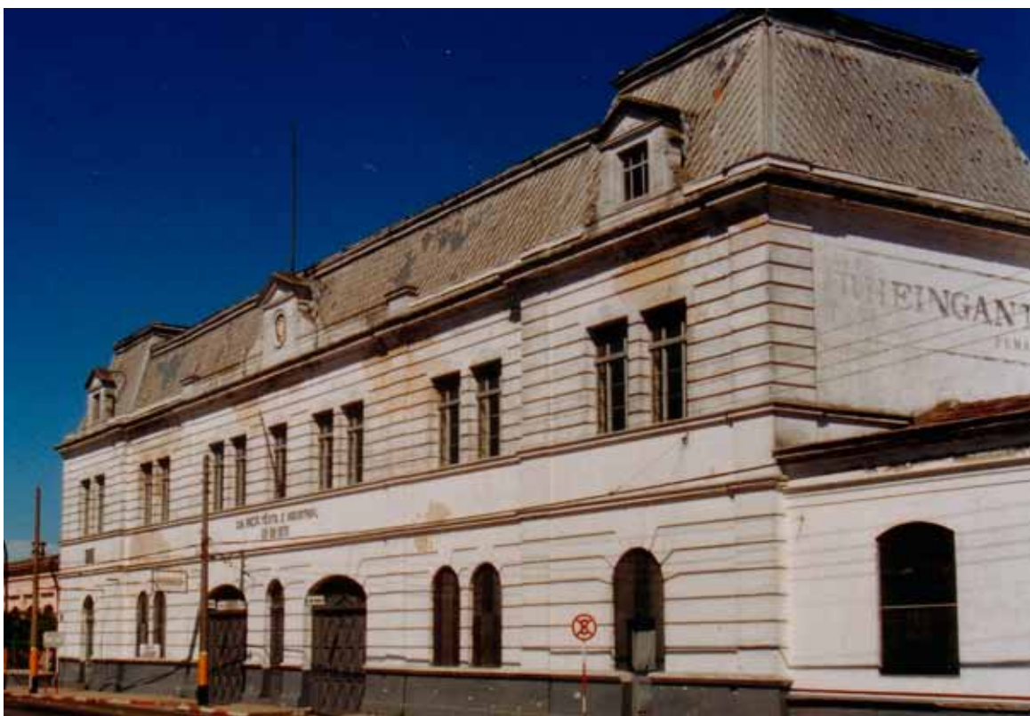
Figura 13 – Fábrika Rheingantz, em Rio Grande (RS). Fotografia de Philip Gunn, 1997.