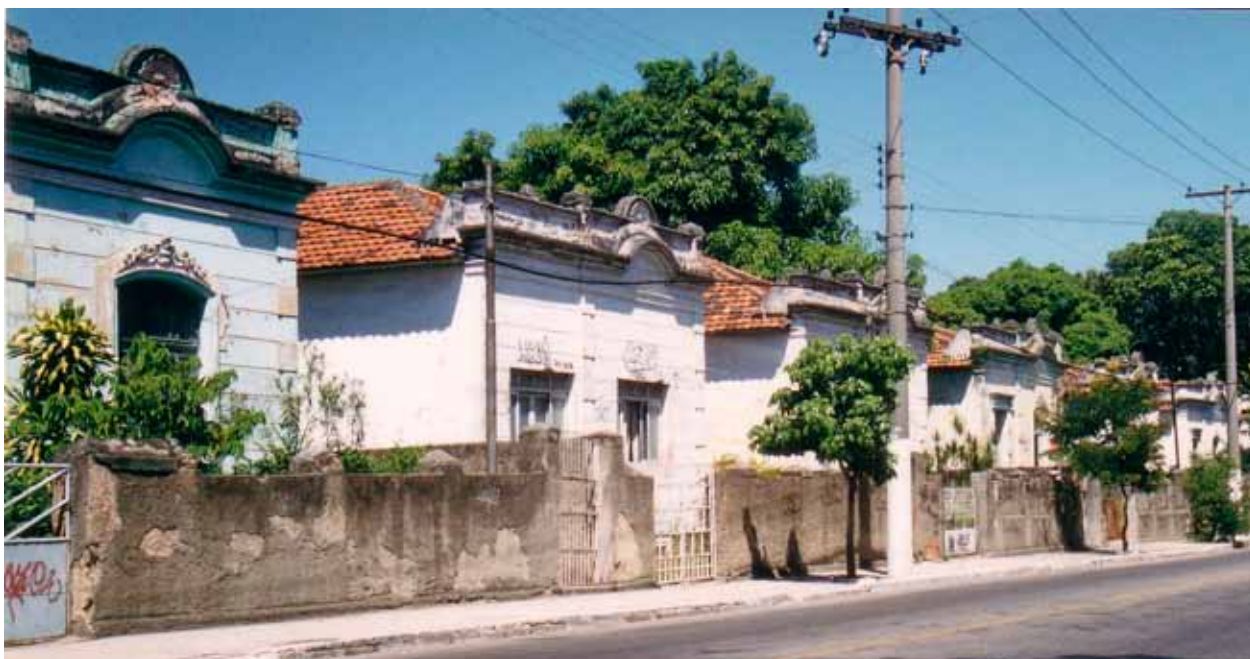
Figura 2 – Vilas operárias da Companhia Fluminense em Niterói (RJ). Fotografia de Philip Gunn, 1998.

Companhia Itabirito do Campo (Itabirito, MG); da América Fabril (Deodoro, RJ); da Fábrica Santa Cruz (Estância, SE); da Companhia Progresso (Salvador, BA). E também as casas de funcionário da Hidrelétrica Carioca, da Companhia de Tecidos Santanense (Pará de Minas, MG); a fachada do bloco de sobrados geminados erguido pela Fábrica Bonfim, da Companhia América Fabril, (praia do Caju, Rio de Janeiro, RJ) (Figura 3); e a vila operária da Fábrica Rosa (Pesqueira, PE).