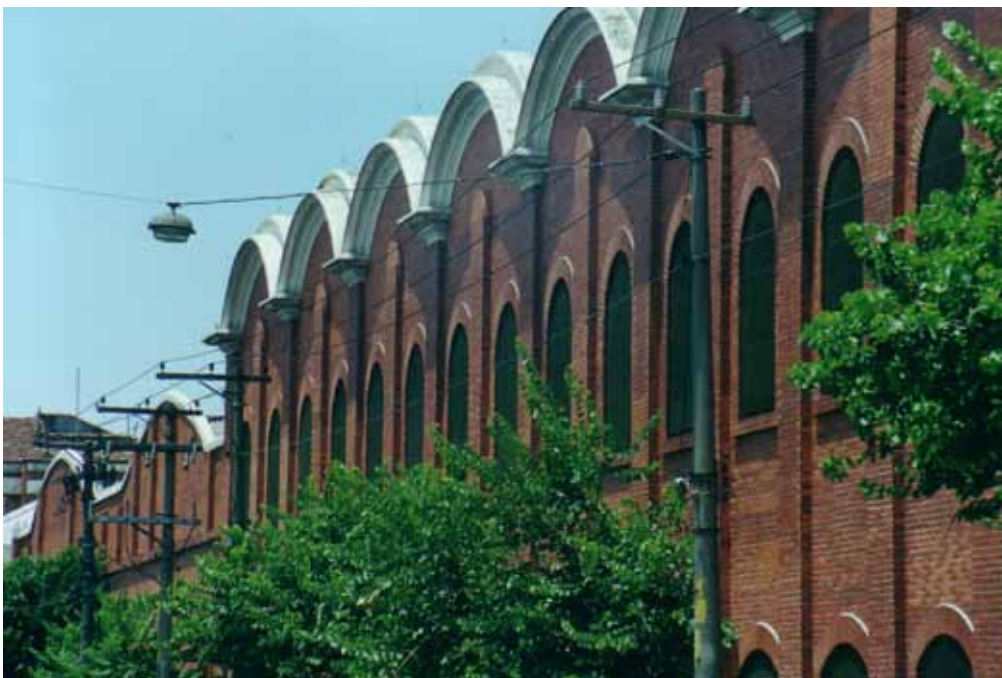
Figura 19 – Fábrica Mariângela, São Paulo, erguida pelas Indústrias Reunidas Francisco Matarazzo em 1907, em São Paulo (SP).