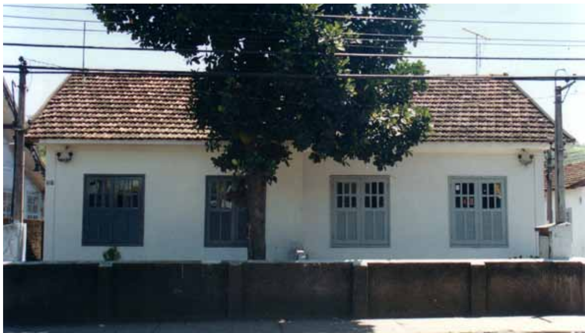
Figura 62 – Casas na vila operária da Siderúrgica Barra Mansa, em Barra Mansa (RJ). Fotografia de Philip Gunn, 2002.

48. A Vila Poty foi erguida pela Companhia de Cimento Portland Poty, do Grupo Votorantim, em Paulista (PE), a partir de 1942.