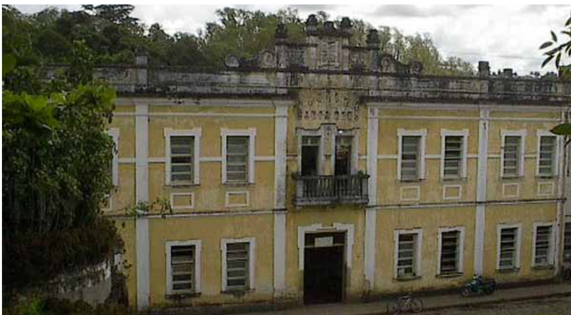
Figura 12 – Fábrika Santa Cruz, em Estância (SE). Fotografia de Suzete Bomfim, 2007.