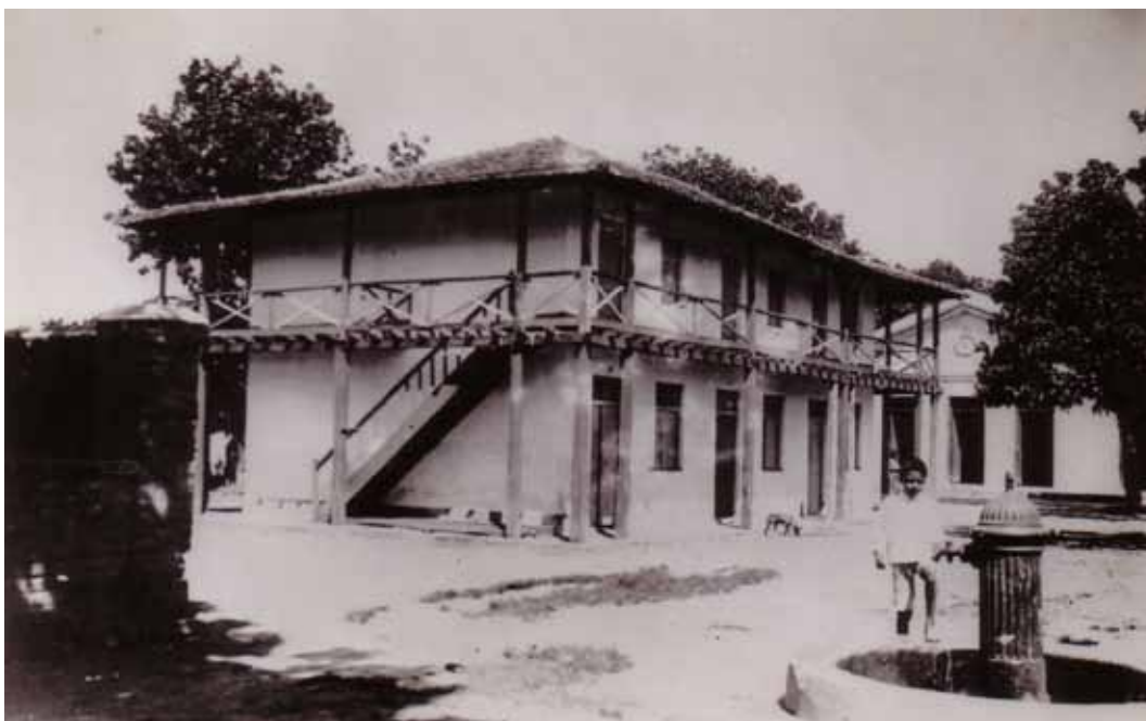
Figura 63 – Alojamento para solteiros erguido em Camaragibe (PE).

são eliminados; o tamanho dos vãos (portas e vitrais) é reduzido, assim como o da própria igreja (Figura 64). Tal movimento de simplificação é ainda mais profundo no prédio que abriga a igreja da Fábrica Marituba, em Piaçabuçu (AL): se não fosse sua implantação, o pequeno sino que ostenta no alto da fachada principal, e os vãos em arco pleno dos basculantes das fachadas laterais, dificilmente teria seu uso reconhecido (Figura 65).