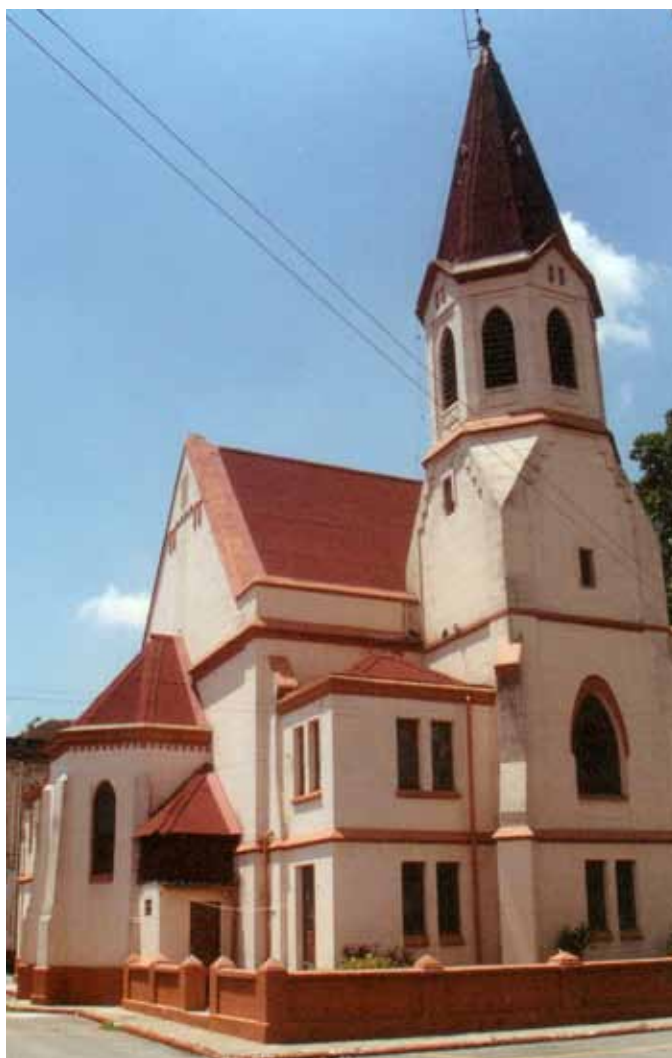
Figura 44 – Igreja da Vila Maria Zélia, em São Paulo (SP). Fotografia de Philip Gunn, 2001