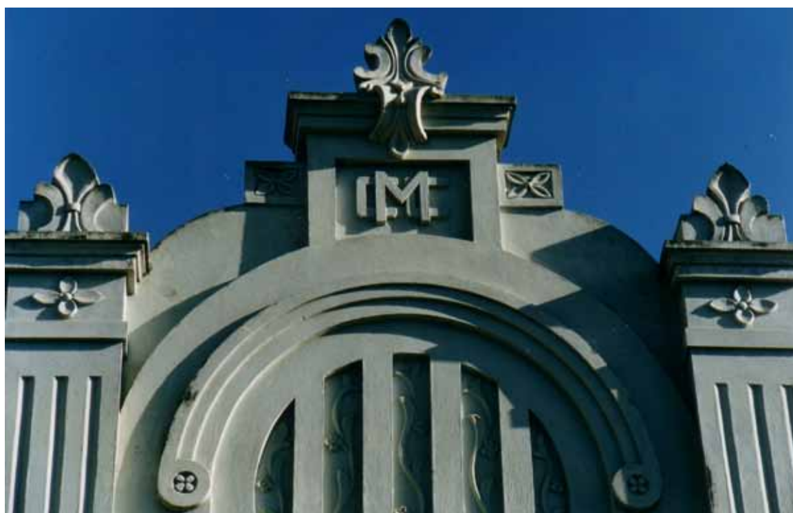
Figura 4b – Detalhe da fachada de uma casa da Cia. Cachoeira de Macacos (MG). Fotografia de Philip Gunn, 1998.