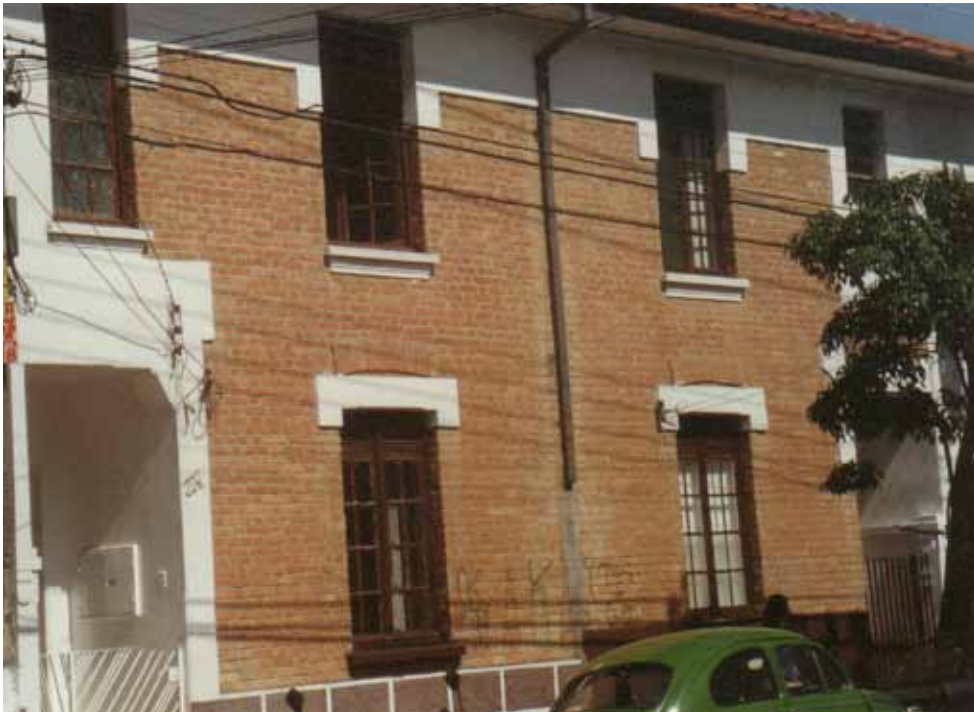
Figura 30 – Vila Cerealina, erguida pelas Indústrias Reunidas Francisco Matarazzo, em São Paulo (SP). Fotografia de Philip Gunn, 2001.

por uma sucessão de pilastras que definem o ritmo das aberturas; os únicos ornatos presentes são cimalkhas feitas com o mesmo material. Junto às suas instalações fabris, a indústria ergueu vários conjuntos de casas, os primeiros deles foram uma vila operária e um grupo de casas para gerentes junto à fábrica, ambos em tijolo aparente. As destinadas a operários são moradias dispostas em blocos, com fachadas destituídas de ornatos. As moradias destinadas ao proprietário e aos gerentes são casas isoladas, dotadas de jardins, terraços e formas variadas (Figura 31).