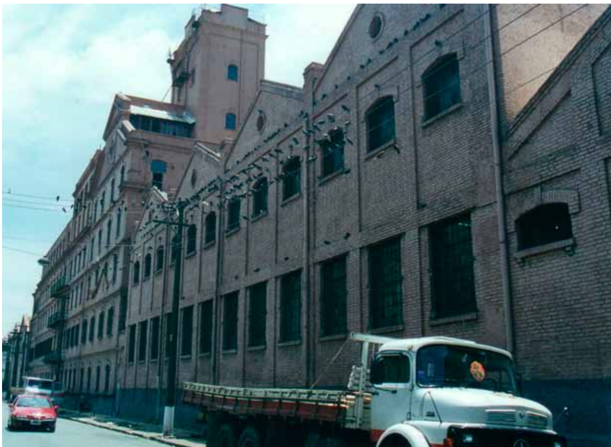
Figura 21 – Moinho Matarazzo, erguido em 1900, no bairro do Brás, São Paulo (SP). Fotografia de Philip Gunn, 2001.

a dar lugar a recursos como a variação de planos de fachada, o jogo de volumes e/ou o movimento do telhado. Tais recursos, além de conferirem qualidades formais à arquitetura sem encarecer muito a construção, compatibilizam-se com a lógica industrial de combate ao supérfluo no campo da produção 22 . Tal estratégia era recomendada, em 1906, pelo engenheiro Everardo Backheuser, ao sugerir a supressão dos elementos desnecessários da casa operária, inclusive os adornos, e substituí-los por uma variação de planos que, segundo defendia, iria movimentar as fachadas e conferir “um certo encanto” à habitação 23 .