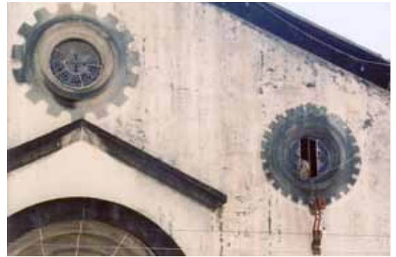
Figura 40 – Igreja da vila operária do Cotonifício Othon Bezerra de Mello S.A., no Recife (PE). Fotografias de Philip Gunn, 2000.