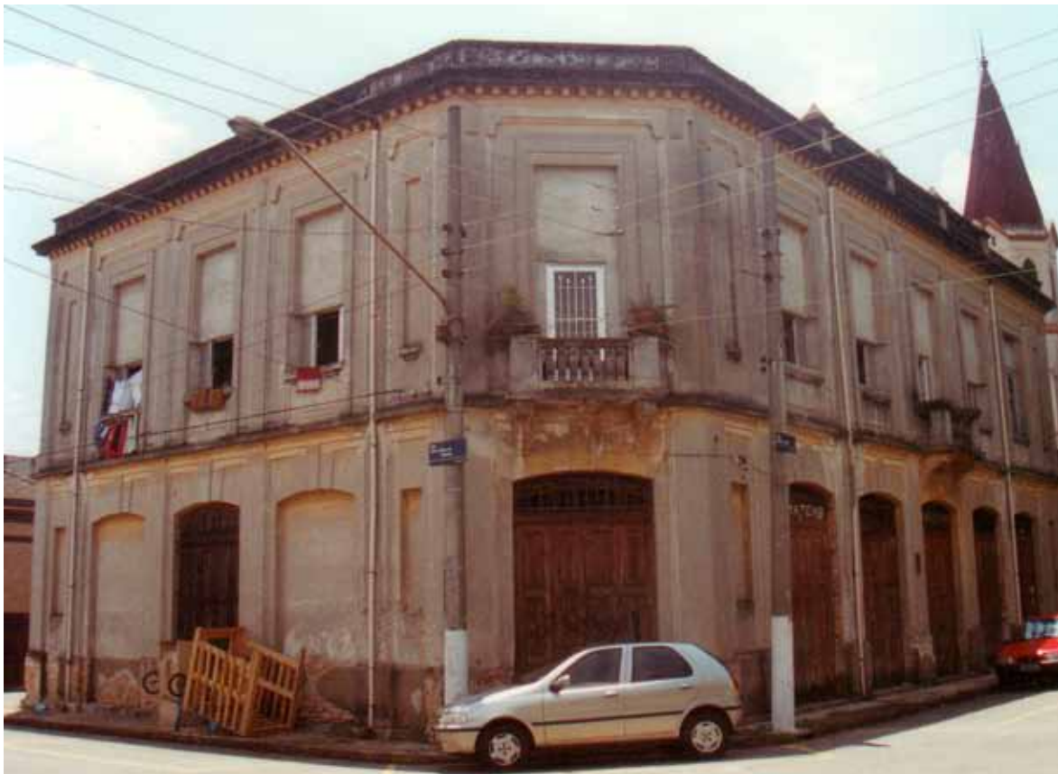
Figura 42 – Prédio do Armazém na Vila Maria Zélia, criada pela Companhia Nacional de Tecidos de Juta, em São Paulo (SP). Fotografia de Philip Gunn, 2001.

Os prédios das duas escolas – para meninos e para meninas – são semelhantes e voltam-se um para o outro. Neles, a composição clássica evidencia-se na organização simétrica dos dois prédios, entre si e entre suas partes específicas, bem como na hierarquia entre os andares – com o superior um pouco mais decorado –, e também na ênfase no acesso principal, na presença de frontão cimbrado e na rusticação estilizada da alvenaria. A junção entre elementos do vocabulário clássico e formas inspiradas em máquinas também se evidencia nesses prédios. Neles, o motivo principal da decoração da alvenaria é uma delicada sobreposição de planos que, como nos prédios do armazém e do restaurante, sugerem chapas de metal. O desenho do consolo que apoia a