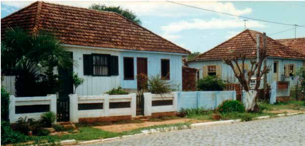
Figura 56 – Casas em Arroio dos Ratos (RS). Fotografia de Philip Gunn, 1997.