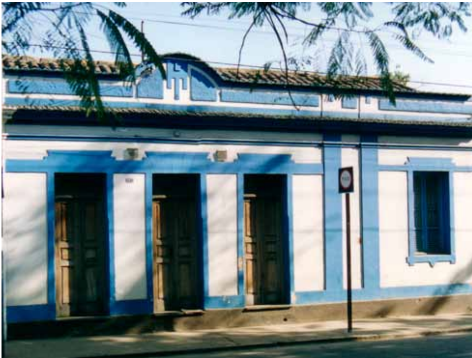
Figura 41 – Vila operária da Companhia Industrial São Joanense, em São João del-Rei (MG). Fotografia de Philip Gunn, 1998.