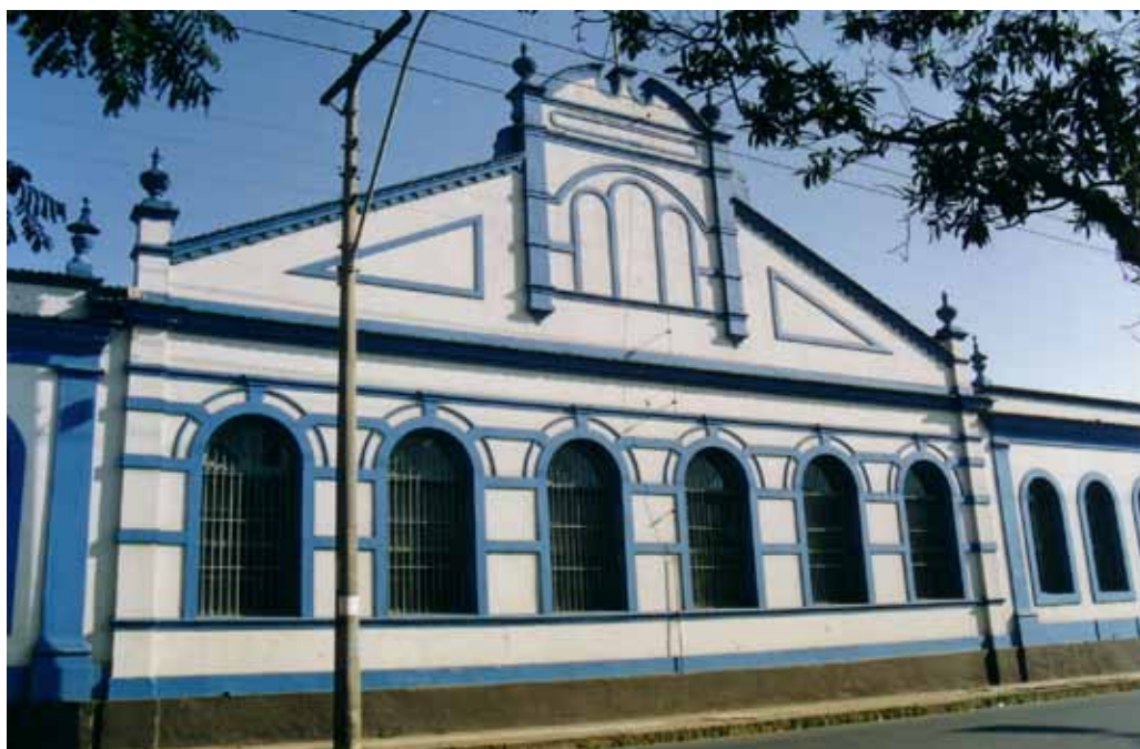
Figura 11 – Fábrica São Joanense, em São João Del-Rei (MG). Fotografia de Philip Gunn, 1998.