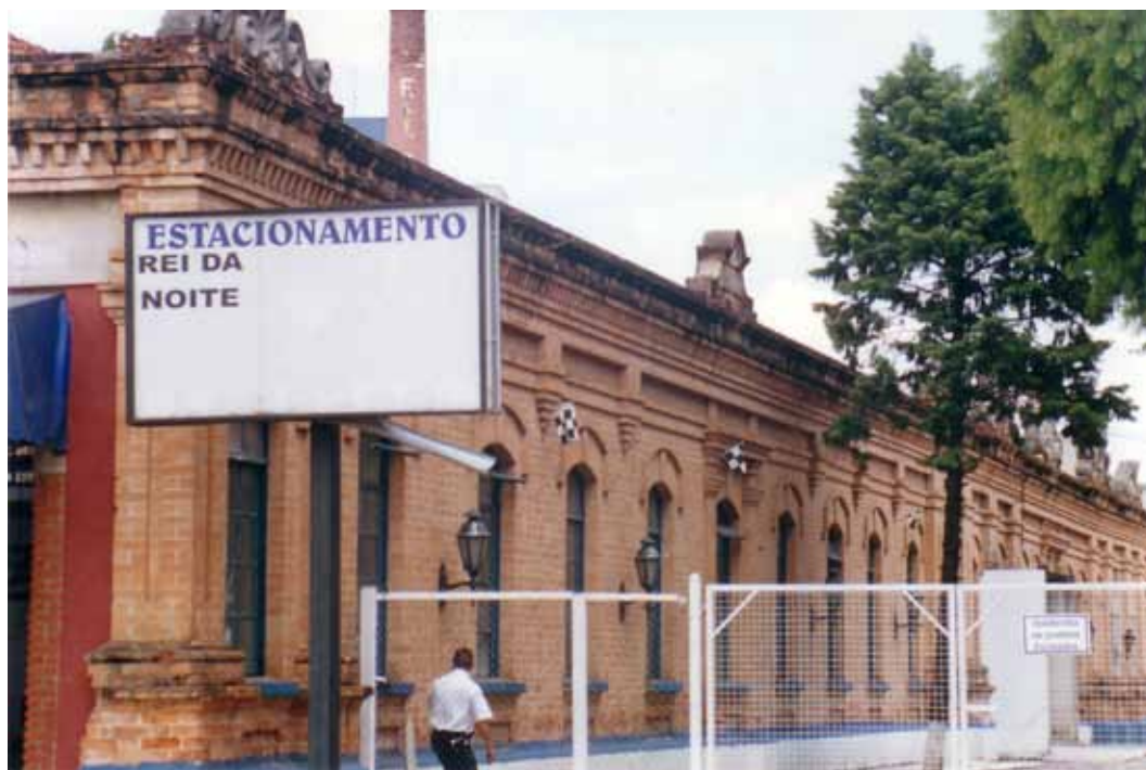
Figura 16 – Fábrica São Bento, fundada em 1874, em Jundiaí (SP). Fotografia de Philip Gunn, 2002.