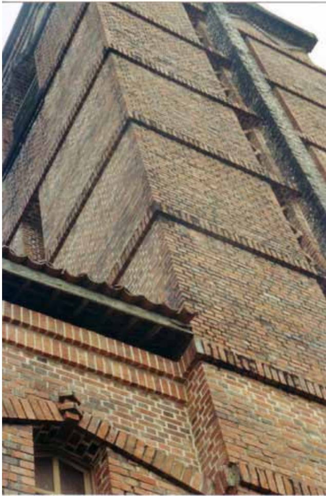
Figura 37b – Igreja em Rio Tinto (PB). Fotografia de Philip Gunn, 2002.