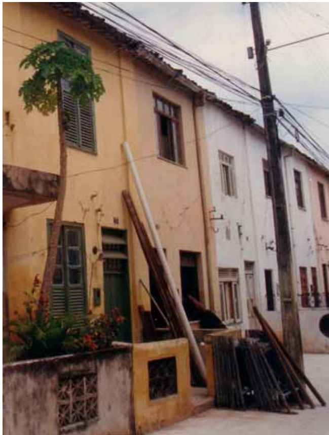
Figura 50 – Casas na Vila Boa Viagem, em Salvador (BA). Fotografia de Philip Gunn, 1997.