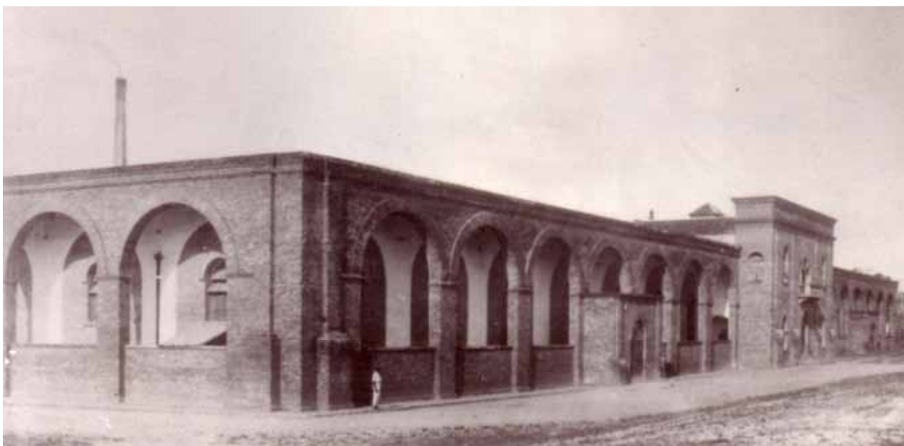
Figura 14 – Fábrica de Camaragibe (PE), criada em 1891.