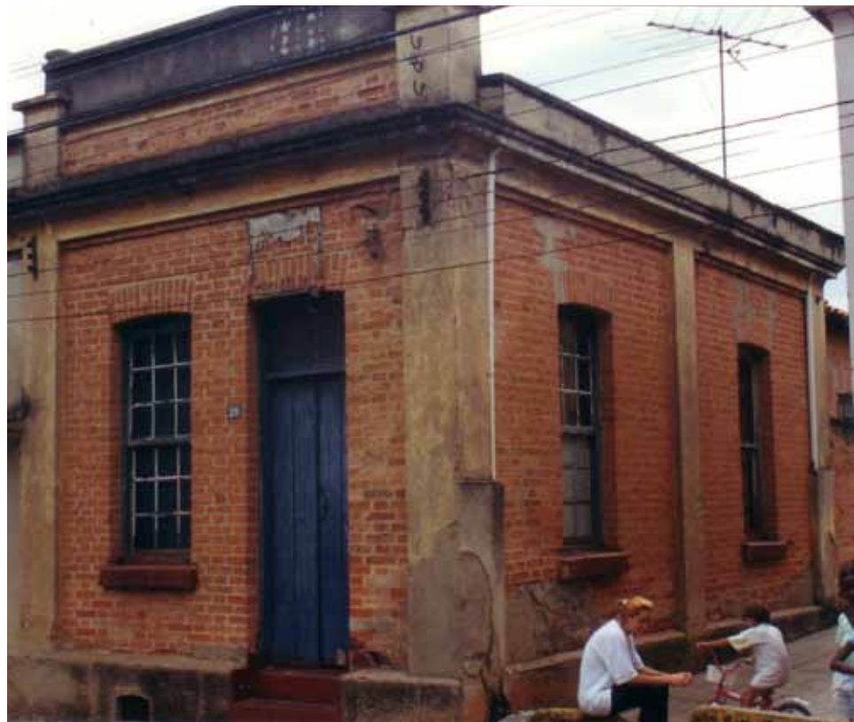
Figura 27 – Vila da Barra do Jundiá, erguida pela Brasital em 1912, em Salto (SP).