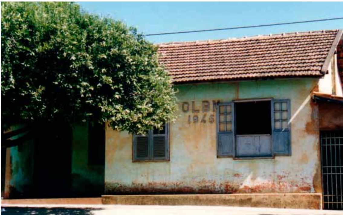
Figura 61 – Casas na vila operária da Fábrica Maria Amália, em Curvelo (MG). Fotografia de Philip Gunn, 1998.