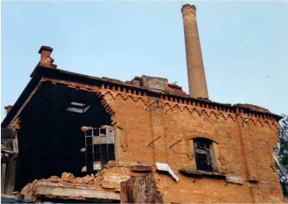
Figura 18 – Companhia de Fiação e Tecidos Santa Maria, fundada em 1896, em Sorocaba (SP).