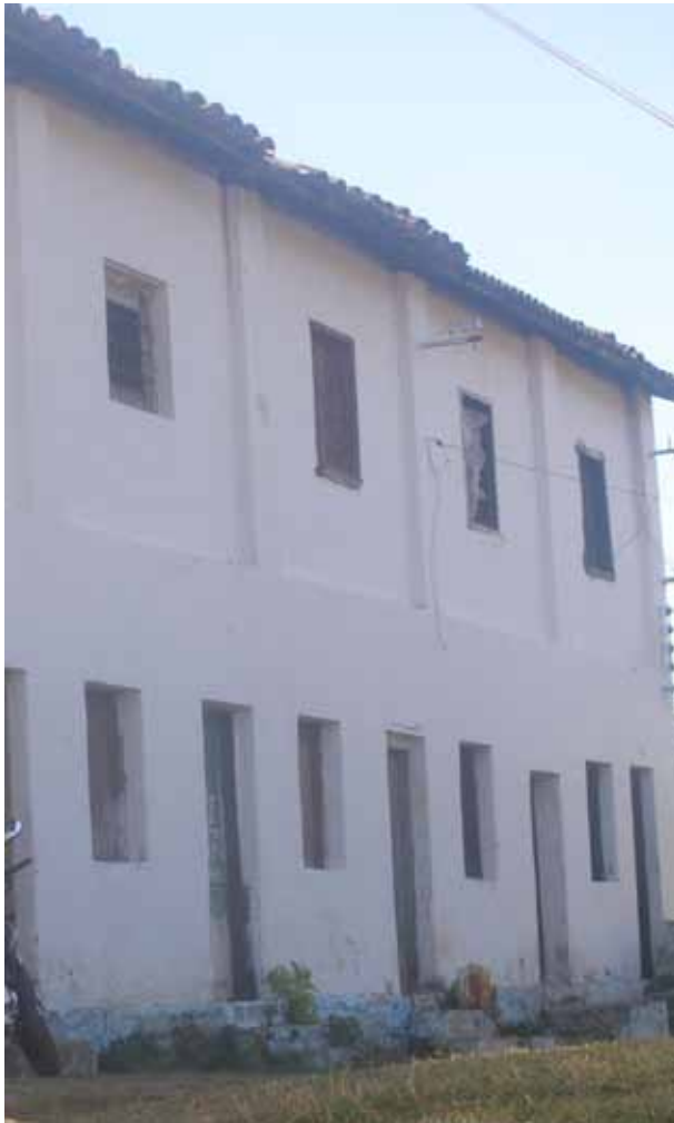
Figura 51 – Casas em Marzagão (MG). Fotografia de Vanda Quecini, 2007.

Entretanto, nas vilas operárias e núcleos fabris do Brasil, o padrão que se generalizou desde o final do século XIX foi outro: são casas térreas, dispostas