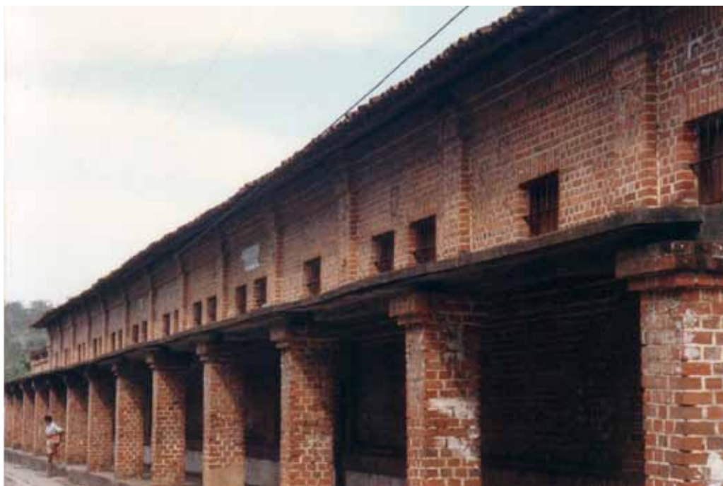
Figura 32 – Fábrica da Companhia de Tecidos Rio Tinto, em Rio Tinto (PB). 1996.