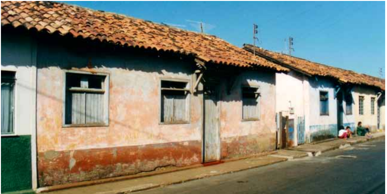
Figura 52 – Casas na vila operária da Siderúrgica Belgo-Mineira, em Sabará (MG). Fotografia de Philip Gunn, 1998.