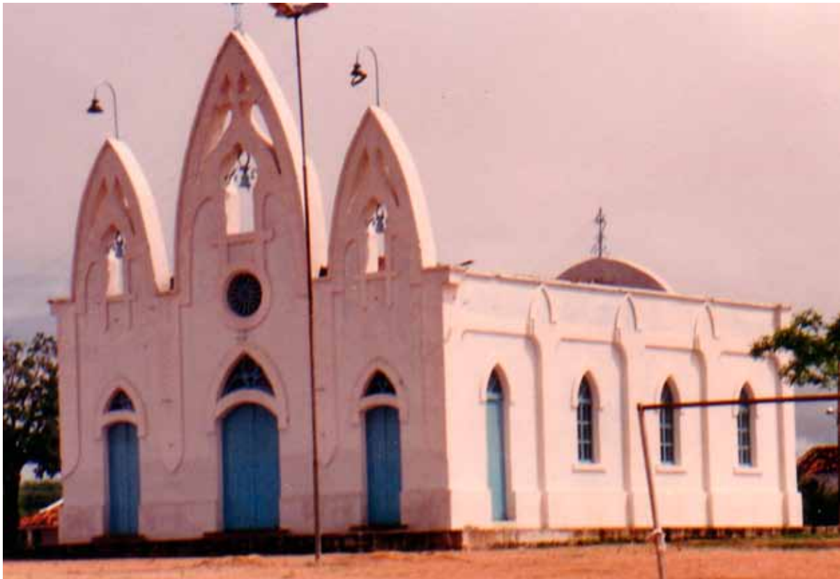
Figura 8 – Capela do Rosário, Pedra (AL). Fotografia de Philip Gunn, 1994.

desenho e da forma dos quinze vitrais – parece encontrar sentido na lógica de repetição seriada de elementos da produção industrial, além de evidenciar a falta de domínio, por parte do projetista, da linguagem, também manifestada em outros aspectos do projeto (Figura 10).