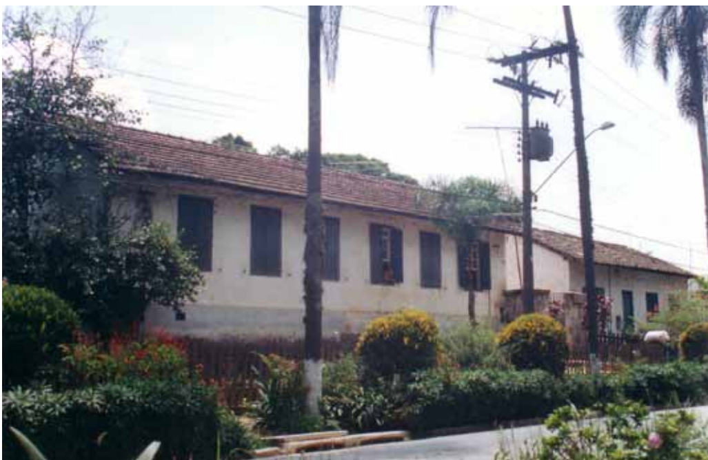
Figura 55 – Casas em Caieiras (SP). Fotografia de Philip Gunn, 2002.