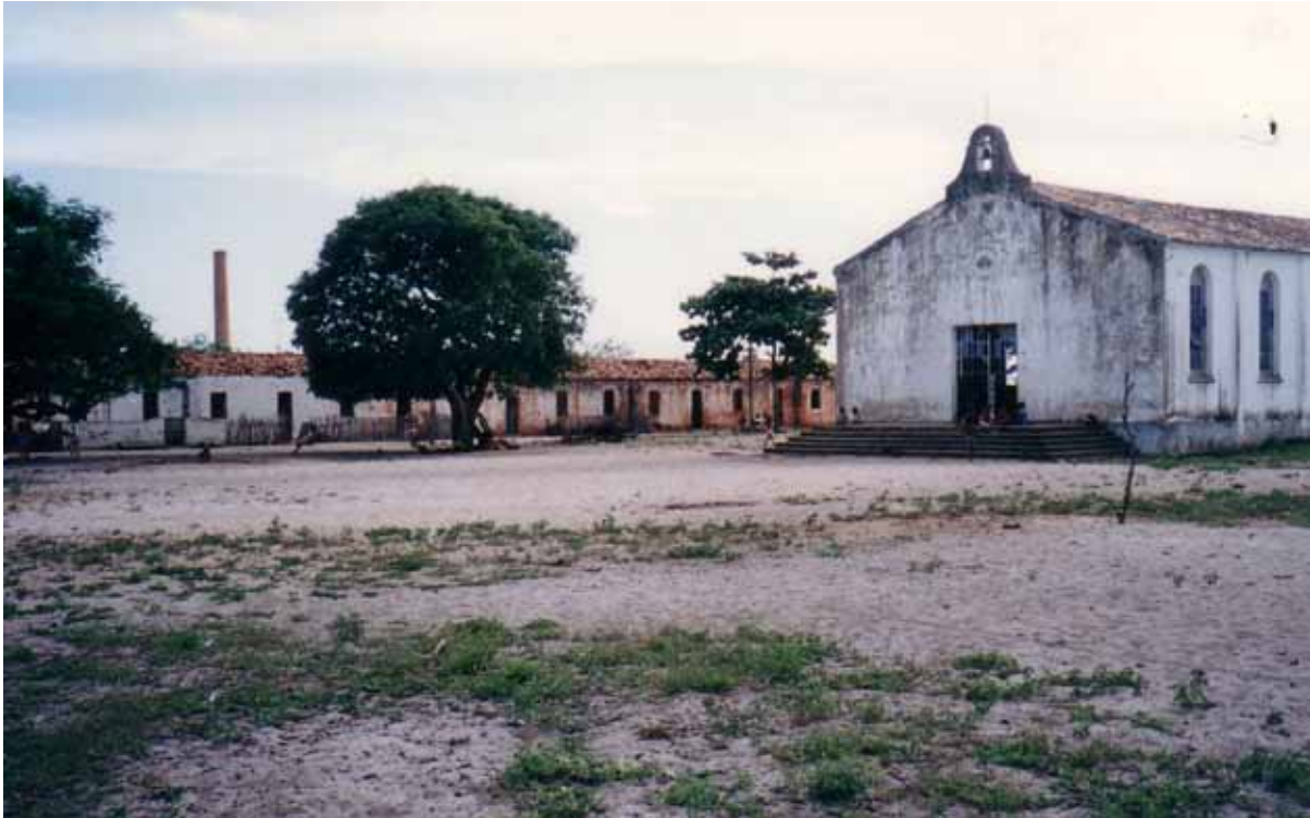
Figura 65 – Igreja da Fábrica Marituba, em Piaçabuçu (Al). Fotografia de Philip Gunn, 1994.

No caso da igreja da Fábrica Maria Amélia, ao “depósito” não restou nem sino nem arremedo de torre (Figura 66).