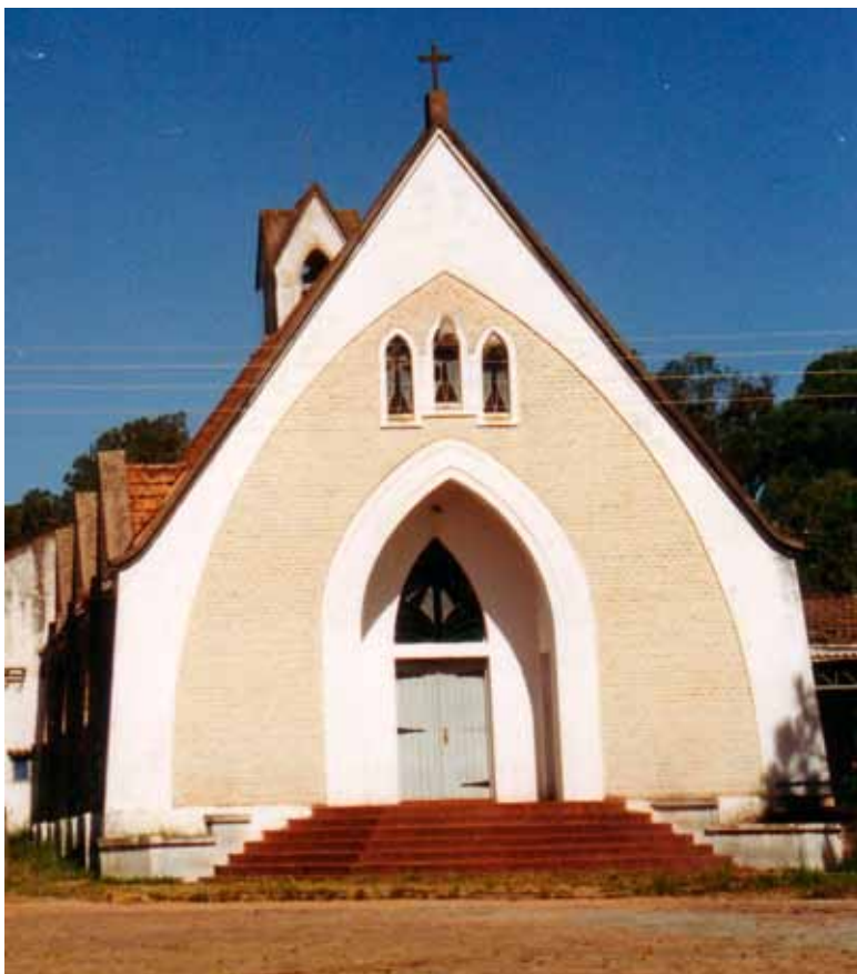
Figura 9 – Igreja construída pela Cooperativa Industrial de Carnes e Derivados (Cicade), em Bagé (RS). Fotografia de Philip Gunn, 1997.

composta por pilastras, entablamento, cercaduras e desenhos geométricos em relevo (Figura 12).