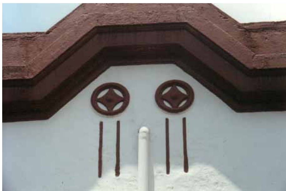
Figura 47b – Detalhe da composição de fachada de casa na Vila Maria Zélia, em São Paulo (SP). Fotografia de Philip Gunn, 2001.