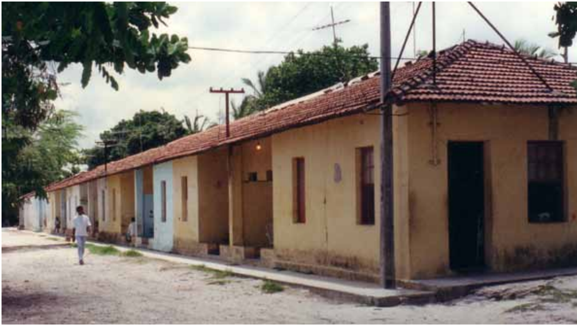
Figura 60 – Vila Poty, em Paulista (PE). Fotografia de Philip Gunn, 1996.