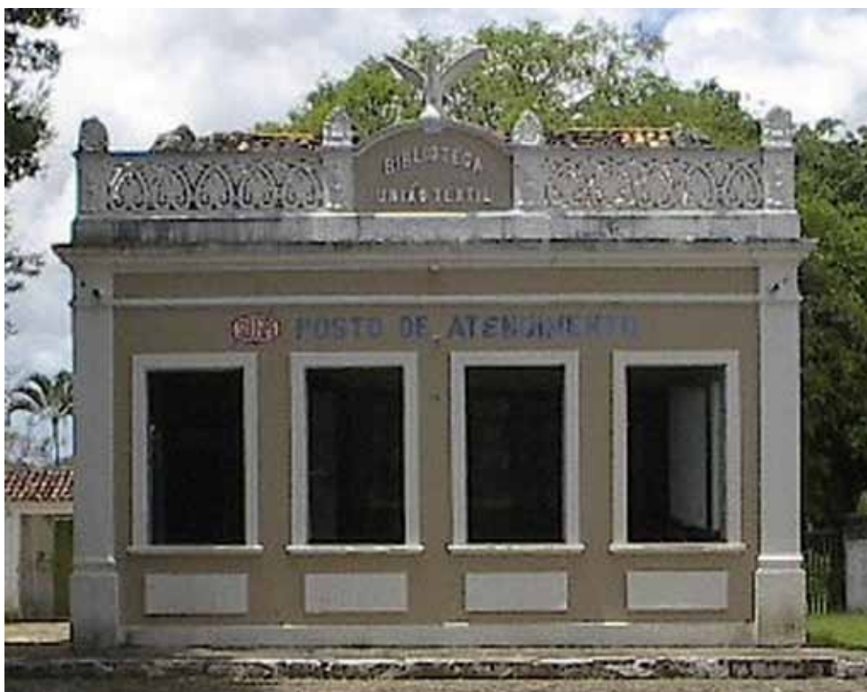
Figura 5 – Biblioteca da vila operária da Fábrica Santa Cruz, em Estância (SE).

–, e na da Fábrica Santa Cruz, em Estância – onde também se observam portais e vitrais em arco pleno e contrafortes, além da presença, na torre, de friso com arcos de volta redonda. Com seus vãos e nichos em arco pleno, seu portal dotado de intradorso e seus vitrais geminados com arco cego, a igreja que a Fábrica Cometa ergueu em Meio da Serra, no município de Petrópolis (RJ), remete à linguagem românica (Figura 6).