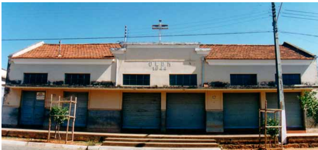
Figura 66 – Igreja da Vila Maria Amália, em Curvelo (MG). Fotografia de Philip Gunn, 1998.

e início do XX; e à adoção, em igrejas, de soluções que remetem a projetos britânicos do século XIX, baseados em motivos do gótico e do românico e na ideia de simplicidade.