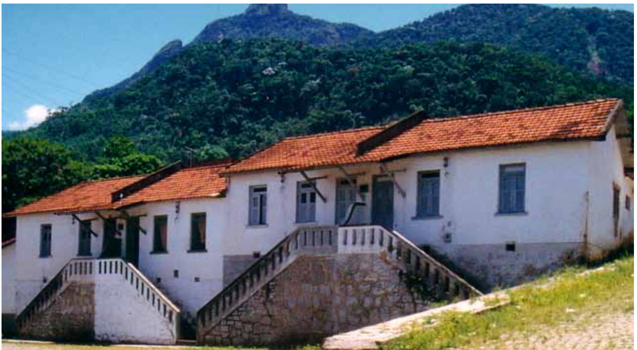
Figura 53 – Habitações em Pau Grande, Magé (RJ). Fotografia de Philip Gunn, 1998 -