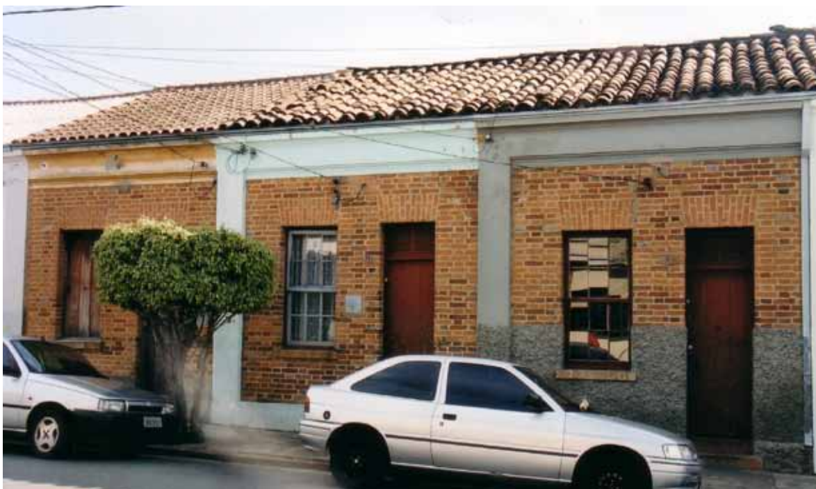
Figura 28 – Vila Brasital, erguida pela Brasital entre 1920 e 1924, em Salto (SP). Fotografia de Philip Gunn, 2001.

Nas vilas da Brasital em Salto, o aspecto mais curioso são os chamados “quintalões”. Os de Salto foram os únicos identificados entre as vilas operárias e núcleos fabris pesquisados no Brasil. Entretanto, o quintal coletivo no centro da quadra – mas com forma e uso um pouco distinto – integrou a tradição de núcleos