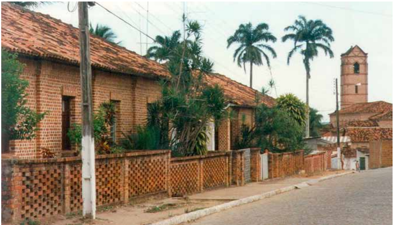
Figura 33 – Moradias para mestres e operários, edificadas pela Companhia de Tecidos Rio Tinto, em Rio Tinto (PB). Fotografia de Philip Gunn, 2002.

Algumas dessas construções, como a Igreja de Santa Rita de Cássia (construída em 1923 e ampliada em 1945), o Cine Orion (1944) e o Clube da Vila Regina são particularmente expressivas. No prédio do armazém de consumo,