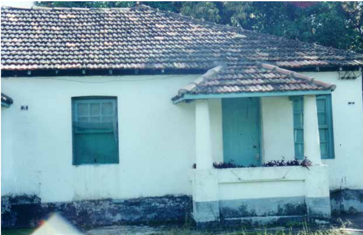
Figura 57 – Moradia na Fazenda Coruputuba, núcleo fabril criado Companhia Agrícola e Industrial Cícero Prado em Pindamonhangaba (SP). Fotografia de Philip Gunn, 2002.