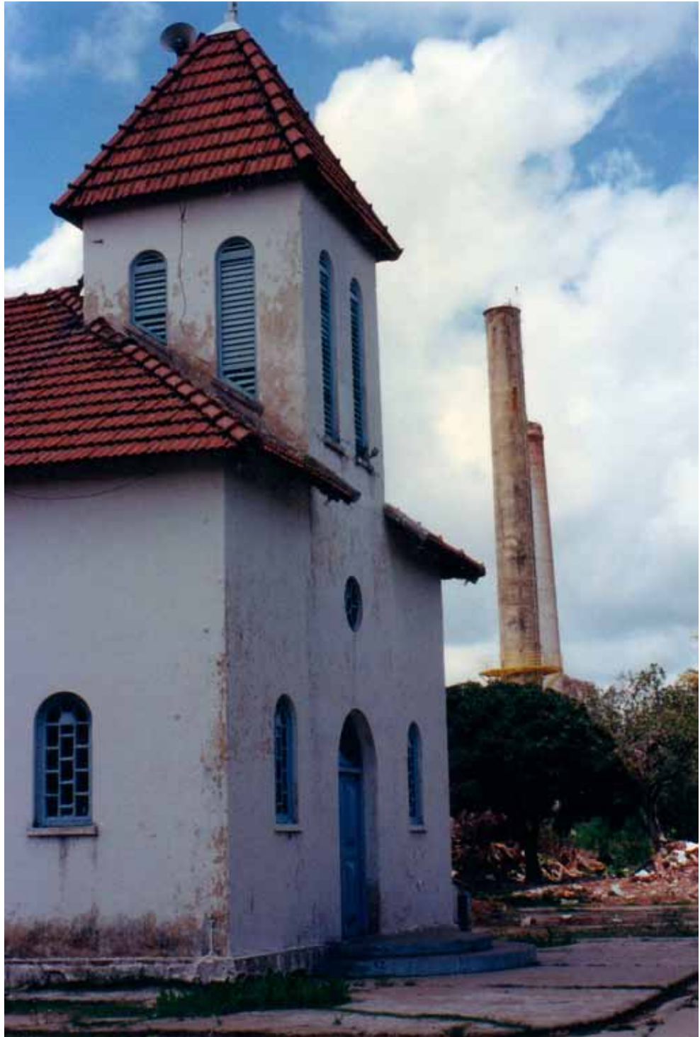
Figura 64 – Igreja da Vila Poty, em Paulista (PE). Fotografia de Philip Gunn, 1996.