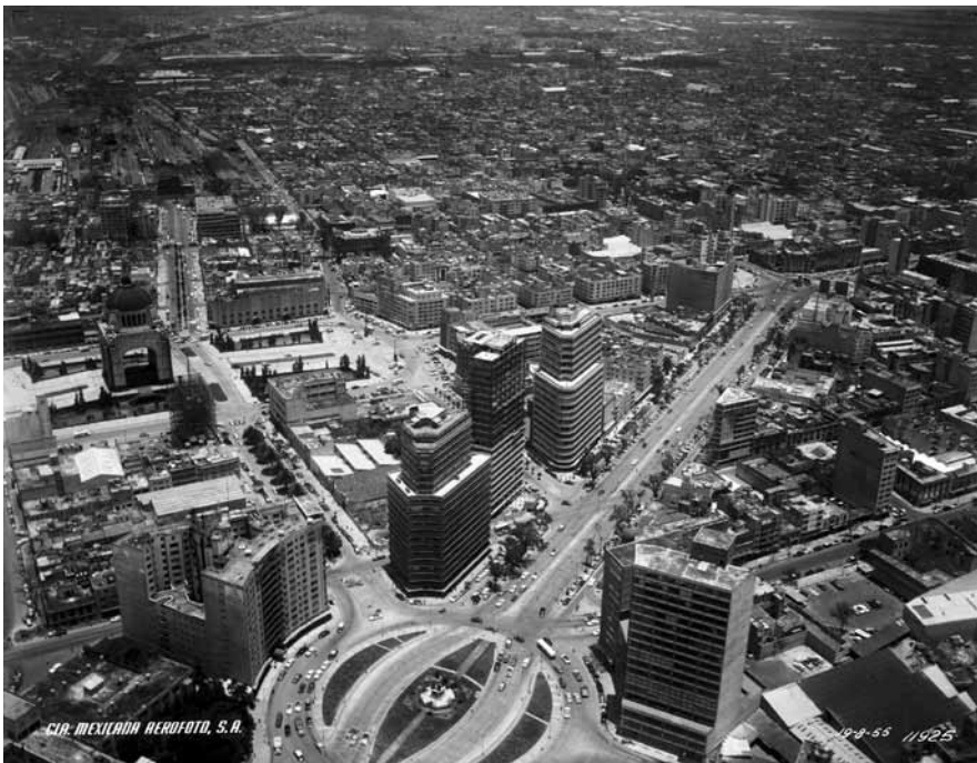
Imagen 4 – MXIM-2-3-5-1, Compañía Mexicana de Aerofoto, Ciudad de México, 19 de agosto 1955. In: Fundación ICA, vuelo 11925.

de México, D.F., permaneciendo en ese lugar hasta el año de 1950. Véase < http://www.sedena.gob.mx/index.php?id_art=550 > (consultado en mayo de 2010).