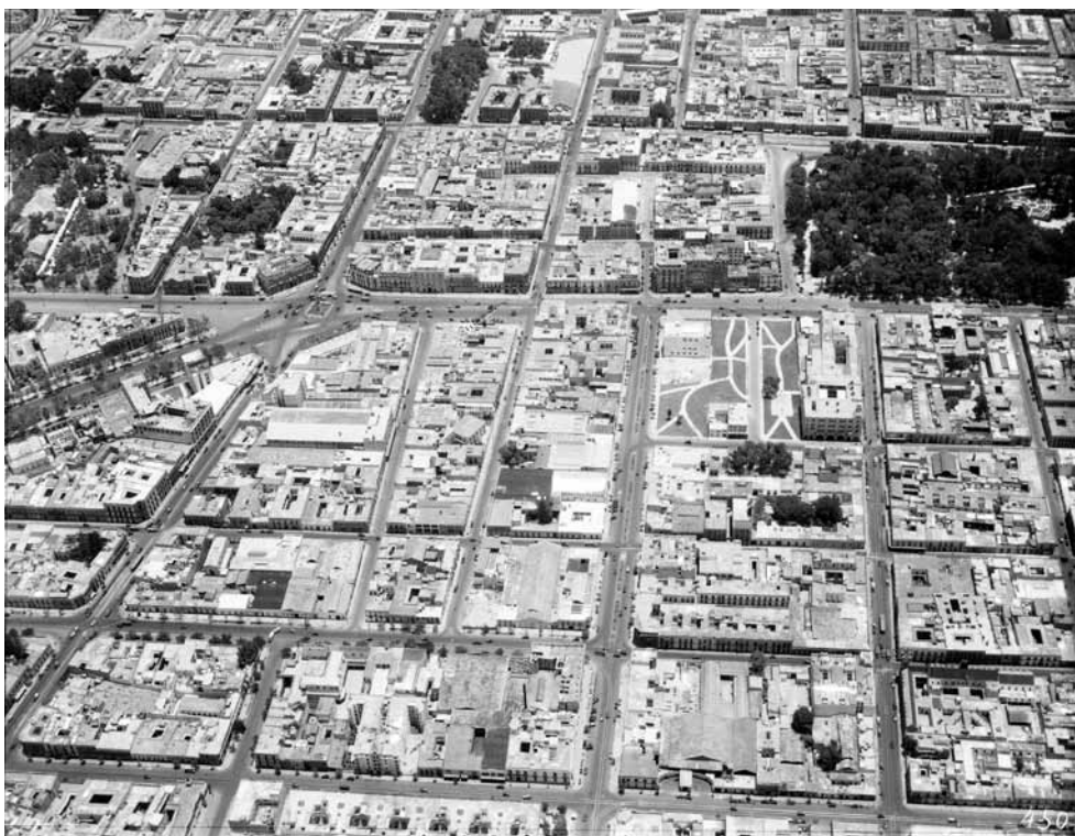
Imagen 7 – MIM-2-3-3-2, Compañía Mexicana de Aerofoto, Ciudad de México, 1932. In: Compañía Mexicana de Aerofoto, 450b.