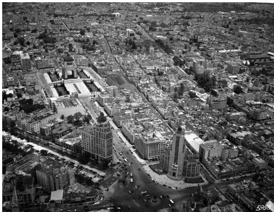
Imagen 11 – MxIM-2-3-4-4, Compañía Mexicana de Aerofoto, Ciudad de México, 11 de junio 1949. In: Fundación ICA, vuelo 5968.

68. Ver Imagen 8 (1958) frente a Imagen 15 (1934).