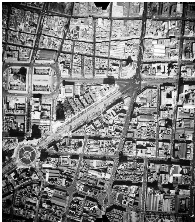
Imagen 6 – MIM-2-3-4-9, Compañía Mexicana de Aerofoto, Ciudad de México, 3 de diciembre de 1949. In: Fundación ICA, vuelo 418-AC2.