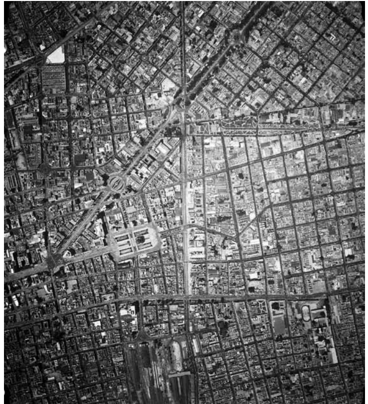
Imagen 13 – MXIM 2-3-5-5 , Compañía Mexicana de Aerofoto, Ciudad de México, 1958. In: Fundación ICA, vuelo 593D-1.