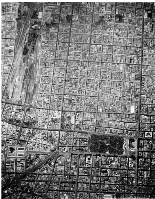
Imagen 14 – MIM-2-3-3-4, Compañía Mexicana de Aerofoto, Ciudad de México, 1936. In: Fundación ICA, vuelo 91/86.