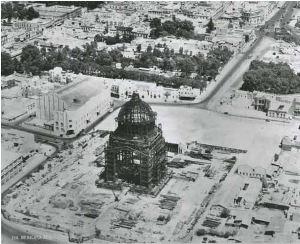
Imagen 2 – MIM-2-3-3-3, Compañía Mexicana de Aerofoto, Ciudad de México, 1932. In: Compañía Mexicana de Aerofoto, 403.

viraje circular sobre un espacio urbano, lo que a veces resulta en alguno de los vuelos efectuados 19 , también ayuda sobremanera por la mirada concéntrica que se logra sobre él, permitiendo documentarlo con mayor precisión al facilitar su estudio desde puntos de captura consecutivos.