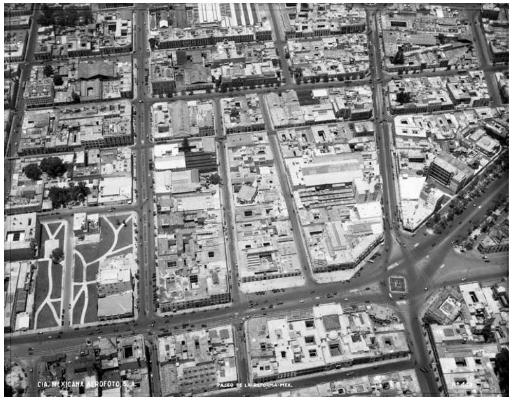
Imagen 1 – MXM-2-3-3-1 (Estructura del código de referencia: MX – México; IM – Instituto Mora; 2 – Colección El Caballito; 3 – Grupo documental Desde el aire), Compañía Mexicana de Aerofoto, Ciudad de México, 1932. In: Compañía Mexicana de Aerofoto, 449.

Para detenernos en qué nos permite conocer la fotografía aérea, aportes como los que hizo Chombart 17 hace más de medio siglo serán de primera importancia. En primer lugar nos revela las limitaciones de las fotografías aéreas oblicuas capturadas a 30° o 60° de ángulo con la horizontal de la superficie terrestre, frente a las de 45°, ángulo más recomendable para este tipo de registros 18 . Por otro lado, nos advierte que el contar con pequeñas secuencias de