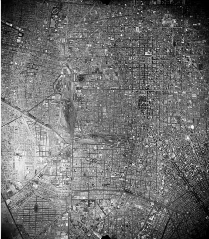
Imagen 8 – MXIM-2-3-5-6 , Compañía Mexicana de Aerofoto, Ciudad de México, 1958. In: Fundación ICA, vuelo 553/2.