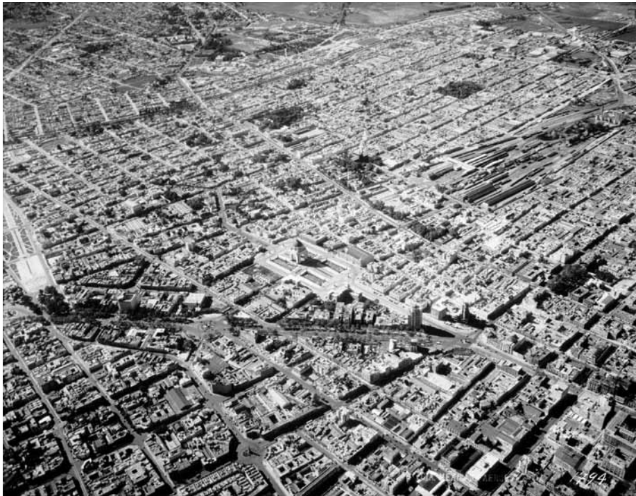
Imagen 10 – MIM-2-3-4-1, Compañía Mexicana de Aerofoto, Ciudad de México, ca. 1940. In: Fundación ICA, vuelo 1794.