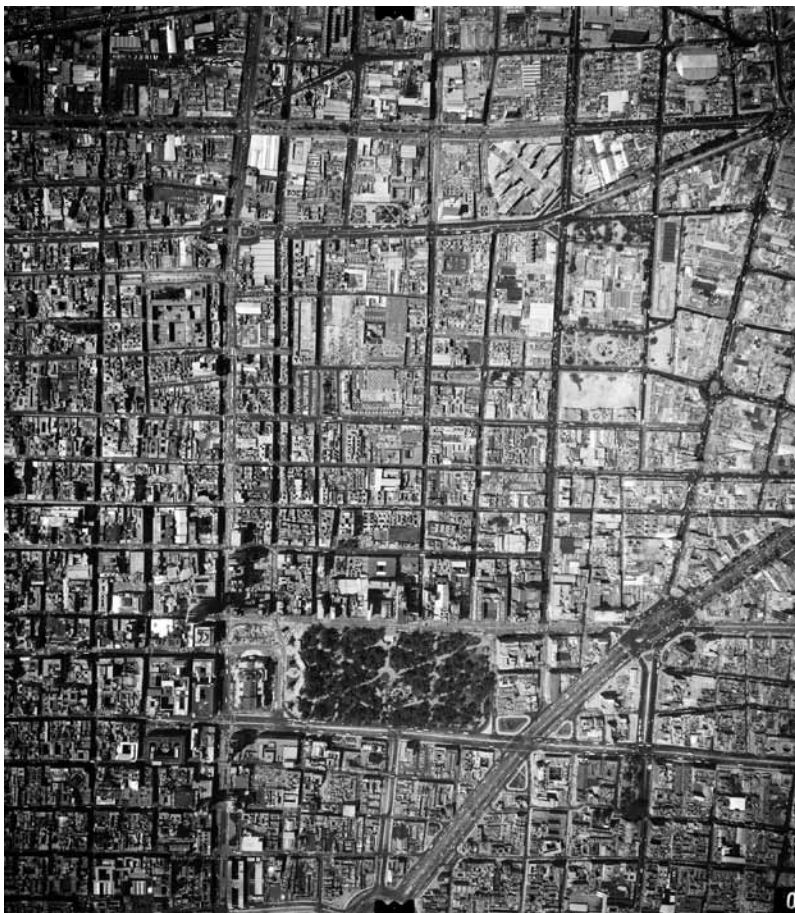
Imagen 16 – MXIM-2-3-6-4, Compañía Mexicana de Aerofoto, Ciudad de México, 1963. In: Fundación ICA, vuelo 1821.