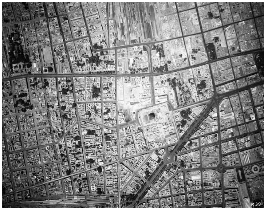
Imagen 15 – MIM-2-3-3-5, Compañía Mexicana de Aerofoto, Ciudad de México, 1934. In: Fundación ICA, vuelo 89-90/39.