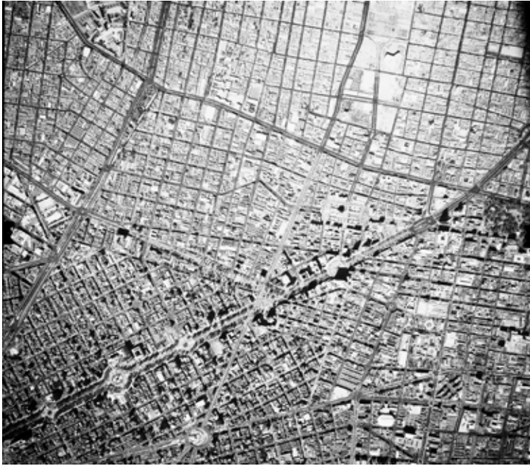
Imagen 12 – MXIM-2-3-7-1 , Compañía Mexicana de Aerofoto, Ciudad de México, 18 de marzo 1972. In: Fundación ICA, vuelo 2346/1.