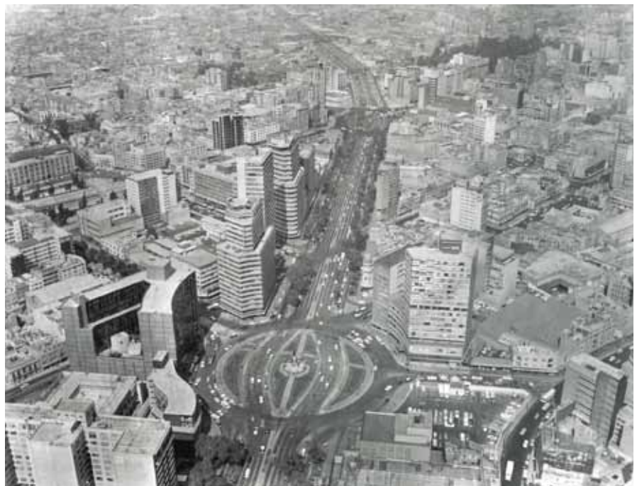
Imagen 9 – MXIM-2-3-6-1 , Compañía Mexicana de Aerofoto, Ciudad de México, ca. 1964. In: Compañía Mexicana de Aerofoto, s/r.