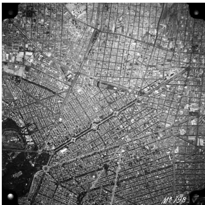
Imagen 5 – MIM-2-3-5-4, Compañía Mexicana de Aerofoto, Ciudad de México, febrero 1953. In: Fundación ICA, vuelo 868/198.