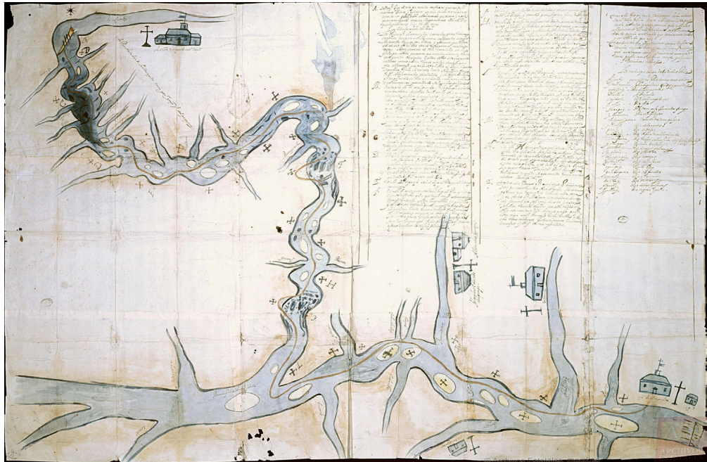
Figura 2 – Mapa 17bis de Céspedes Xeria, original no Archivo General de Indias sob a cota ES.41091. AGI/27.3//MP-BUENOS_AIRES, 17BIS, 77,5 x 117cm, Sevilha.

36. Cf. Cortesão (1951, 1952), que são edições comentadas dos Manuscritos da Coleção de Angelis , da Biblioteca Nacional, Rio de Janeiro.