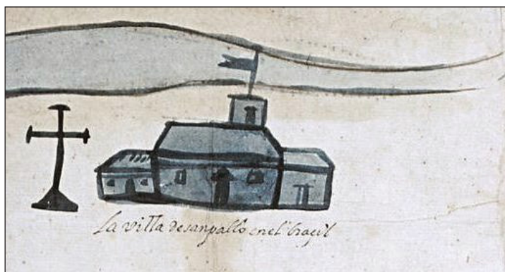
Figura 5 – Detalhe do ícone representando a vila de São Paulo no mapa 17bis, mantido no Archivo General de Indias . Fonte: Céspedes Xeria (1628b).