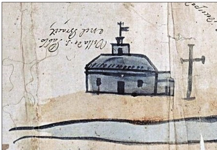
Figura 4 – Detalhe do ícone representando a vila de São Paulo no mapa 17, mantido no Archivo General de Indias .

Embora possam parecer grandes, cartográfica e iconograficamente, essas diferenças são pequenas, a ponto dos cartógrafos e técnicos do Archivo General de Indias terem qualificado este documento como um duplicado, ou seja, substancialmente idêntico ao outro. Do ponto de vista iconológico, as diferenças podem ser interpretadas de muitas maneiras, inclusive na forma de Céspedes repensar o que havia feito na primeira versão (mapa 17) e porque resolveu mudar algo na versão 17bis (aumentar os anexos da casa). O que não convém é atribuir a Taunay, no século XX, mudanças de Céspedes, no século XVII.