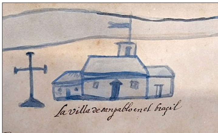
Figura 6 – Detalhe do ícone representando a vila de São Paulo na cópia feita por Santiago Montero Díaz à pedido de Taunay e mantida no Museu Paulista. Fonte: Céspedes Xeria (1628c).