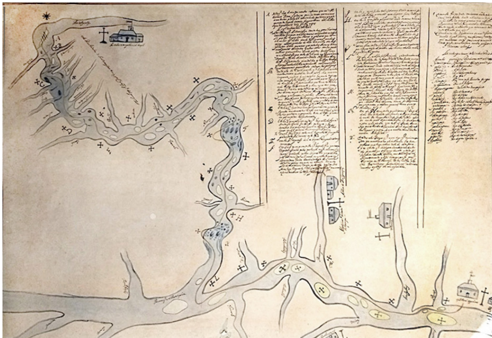
Figura 3 – Mapa de Céspedes Xeria, cópia de Santiago Montero Díaz a 29 de setembro de 1917 elaborada a partir do original 17bis. Localizável no Museu Paulista mediante a cota colocada no verso IC 10239, 78,9 x 117,6cm, São Paulo.

Para evitar duplicações, nosso estudo começou focalizando o mapa 17bis que, como dissemos, serviu de base para a cópia encomendada por Taunay. Paralelamente, foram analisadas as variantes tanto do mapa 17 como das diversas cópias. A primeira delas, feita no Archivo General de Indias , é colorida, encontra-se atualmente no acervo cartográfico do Museu Paulista 38 e está reproduzida na Figura 3.