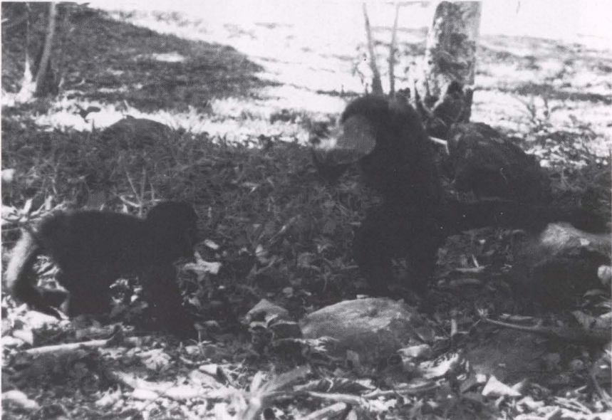
Fig. 3. Macho juvenil observando um macho adulto utilizando ferramentas.

Os animais adultos sempre tiveram maior êxito em quebrar as sementes, pois eram capazes de utilizar rochas mais pesadas que os animais mais novos, além de possuir mais experiência em realizar essa tarefa. O peso das rochas utilizadas pelos animais, variou de 200g a 1000g.