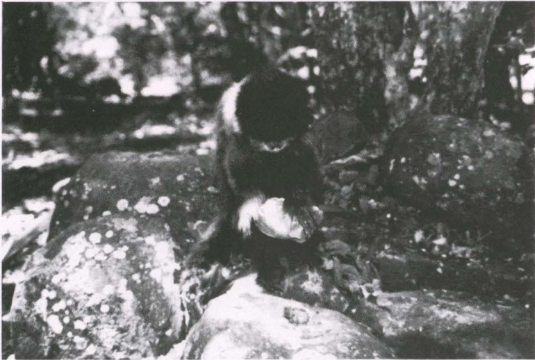
Fig. 1. Fêmea adulta de Cebus apella utilizando rochas como martelo e bigorna para quebrar sementes de Syagrus romanzoffianum .

O procedimento dos integrantes do grupo, consistia de se alimentarem da polpa madura do fruto de S. romanzoffianum , geralmente na própria palmeira, após, descartavam as sementes embaixo da planta-mãe. Posteriormente desciam ao solo e utilizavam as rochas para quebrar as sementes ou então, executavam esta tarefa após alguns dias. O comportamento realizado pelos macacos foi o de carregar as sementes na mão ou na boca até locais no solo onde encontravam uma rocha maior, que servia como bigorna, e uma menor, que servia como martelo. As sementes eram colocadas, uma por vez, sobre a rocha maior e, com a menor entre as duas mãos, os animais batiam repetidamente contra elas até quebrá-las (Fig. 1). Após, utilizavam os dedos ou os dentes caninos para terminar de abri-las, e então retiravam a larva de Coleoptera (Fig. 2). Quando essa larva não era encontrada, a semente era descartada ou o endosperma era consumido.