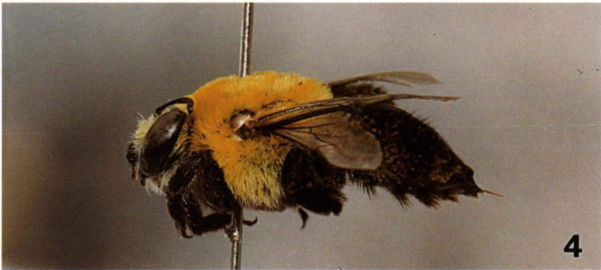
Figs 3-4. Centris xanthomelaena sp.n., holótipo fêmea. (3) Primeiro tergo; (4) vista lateral.