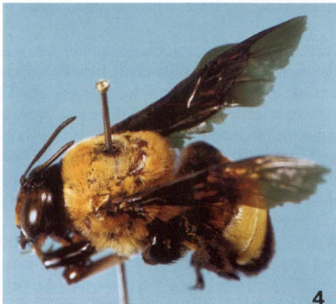
Figs 1-5. (1-2) Centris ( Ptilocentris ) danunciae sp. nov.; (3) Centris ( Melacentris ) collaris ; (4-5) Centris ( Melacentris ) bitaeniata sp. nov.