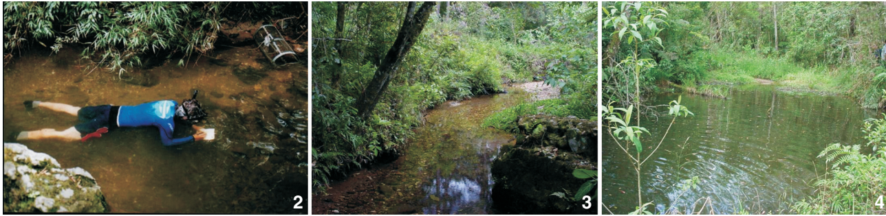
Figuras 2-4. Ambientes estudados no riacho da Cascata: (2) remanso, um poço com profundidade aproximada de 0,7 m e largura de cerca de 5 m, onde foram realizadas coletas e observações diretas por meio de mergulho livre; (3) corredeira, um ambiente com profundidade em torno de 0,3 m e largura em torno de 1 m, onde foram realizadas coletas e observações a partir das margens; (4) pequeno lago oriundo de represamento da drenagem local, onde foram realizadas coletas complementares.

observações e coletas nos ambientes de remanso e corredeiras acima descritos.