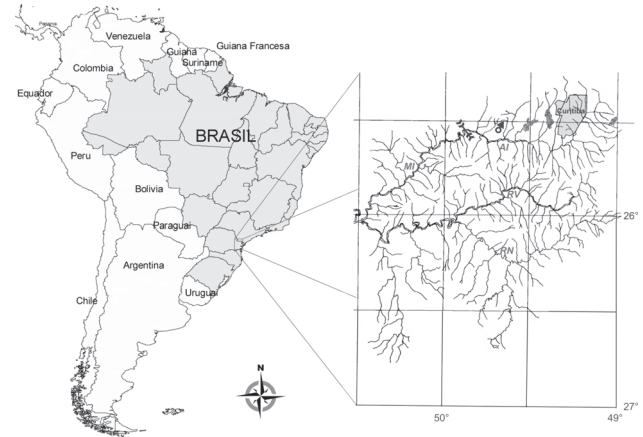
Figura 1. Mapa indicando a localização da área de estudo (σ), riacho da Cascata, um afluente do rio Tortuoso, bacia hidrográfica do alto rio Iguaçu, Balsa Nova, Paraná. (AI) Ecorregião do Alto Iguaçu, (MI) ecorregião do Médio Iguaçu, (RN) sub-bacia do rio Negro, (RV) sub-bacia do rio da Várzea.

O riacho da Cascata nasce no alto da Escarpa Devoniana, no limite do Segundo Planalto Paranaense, e flui para o primeiro planalto junto às demais nascentes e riachos afluentes do rio Iguaçu, região dominada pela Floresta Ombrófila Mista. Na área de estudo, o riacho da Cascata possui as características de um rio de primeira ordem, em cujas margens predominam remanescentes de capões de Floresta com Araucária. A vegetação ciliar na área de estudo é bastante preservada, a qual causa