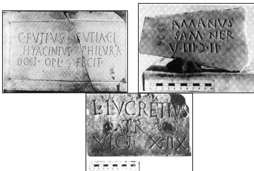
TABELA 5 – Lápides funerárias de gladiadores

As lápides funerárias dos gladiadores nos proporcionam outros caminhos a explorar. O estudo desta categoria de documentos apresenta algumas dificuldades, mas também pode fornecer luzes sobre diversos aspectos do cotidiano desses guerreiros. Entre as dificuldades destacamos os problemas com a datação, que muitas vezes não é precisa. Em muitos casos estipula-se o século em que foi produzida, mas nem sempre o ano exato. Além disso, o local em que foram encontradas também é difícil de precisar. Muitas lápides estão quebradas e outras foram removidas do lugar de origem para os museus sem a devida anotação, ou reaproveitadas na Idade Média em outros contextos.