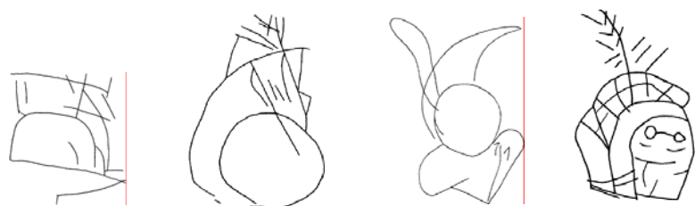
TABELA 1 – Grafites de elmos de gladiadores

Impulsivo, imediato e espontâneo, o grafite é um registro singular que marca um momento específico ou uma necessidade pessoal de deixar registrada uma insatisfação, uma piada ou uma declaração de amor, tornando-se, portanto, uma fonte de inestimável valor para o estudo dos anseios e paixões cotidianas de homens e mulheres que viveram em tempos romanos. 7 Embora a grande maioria tenha sido retirada das paredes de Pompéia, cidade situada ao sul da península Itálica e soterrada pelo Vesúvio em meados do século I d. C., estes pequenos rabiscos foram encontrados em diferentes regiões do Império.