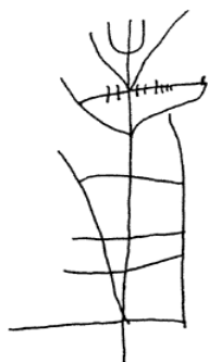
TABELA 2 – Armas de gladiadores

Há uma grande variedade de grafites sobre os combates de gladiadores. Alguns são desenhos de armamentos, outros de gladiadores em posição de ataque ou lutando (tabelas 1, 2, 3 e 4). Eles podem conter ou não inscrições, mas o interessante é que retratam momentos específicos das lutas e, às vezes, em toda a sua dramaticidade, pois muitos apresentam o sangue do derrotado. 8