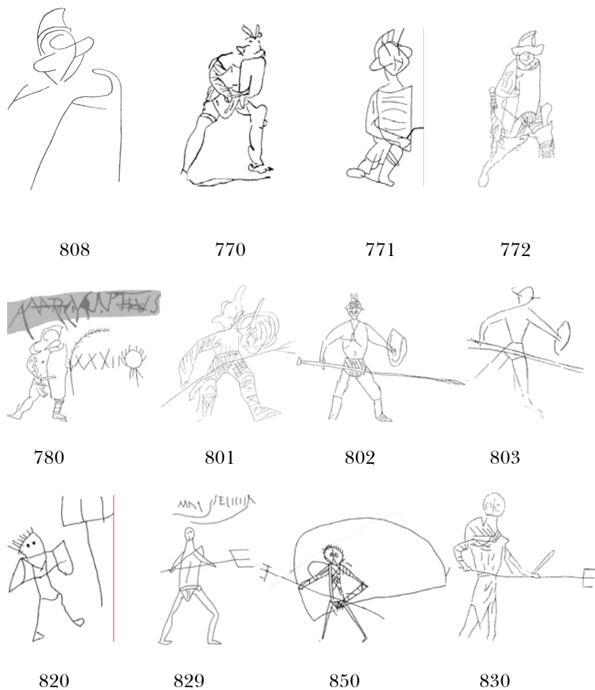
TABELA 3 – Gladiadores individuais

destas fontes epigráficas percebe-se uma ênfase no cotidiano do gladiador, seus treinos e lutas, vitórias ou derrotas, uma imagem viva e cheia de sentimentos que raramente surge em modelos que se fundamentam somente nas fontes escritas.