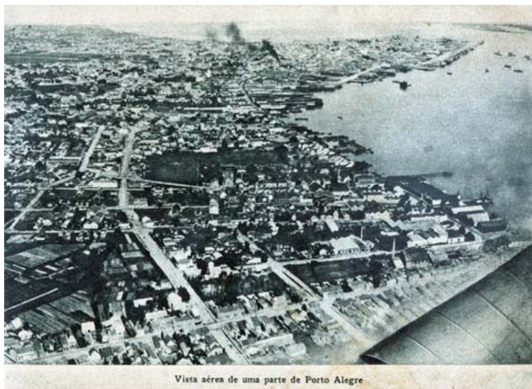
Fotografia 02 – Vista aérea de uma parte de Porto Alegre. (legenda original)