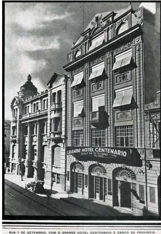
RUA 7 DE SETEMBRO, COM O GRANDE HOTEL CENTENARIO E BANCO DA PROVINCIA.

Fotografia 03– Rua 7 de Setembro, com o Grande Hotel e Banco da Província. (legenda original).