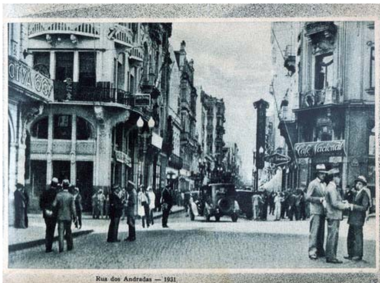
Fotografia 01 – Rua dos Andradas – 1931. (legenda original).