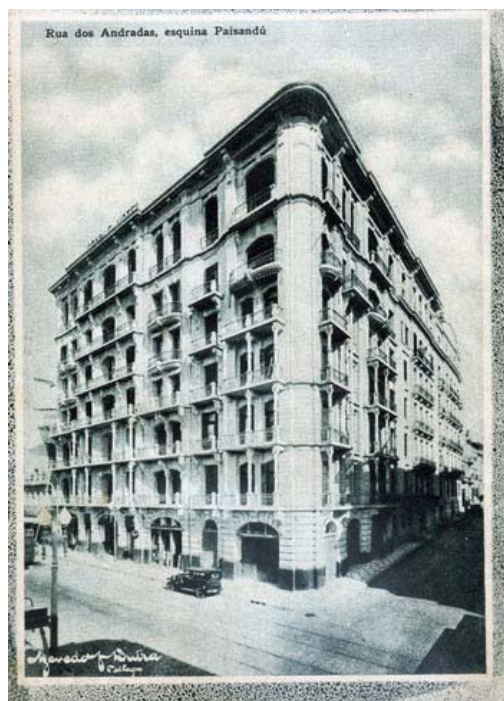
Fotografia 05 – Rua dos Andradas, esquina Paisandú. (legenda original)

Em outros casos, a modernidade apenas se insinua através da presença de elementos que compõem a cena fotografada e que têm o objetivo de apontar para o seu sentido no plano visual. São postes de iluminação, trilhos de bonde, automóveis, pavimentação que tomam lugar na composição do fotógrafo com o objetivo de direcionar o olhar para uma idéia de cidade que se materializa, antes de tudo, em imagem visual. A produção fotográfica em outros contextos urbanos aponta nessa mesma direção (MICHELON, 2001).