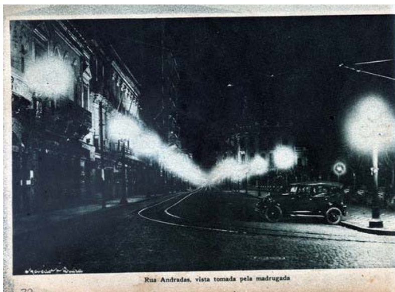
Fotografia 06 – Rua dos Andradas, vista tomada pela madrugada. (legenda original).