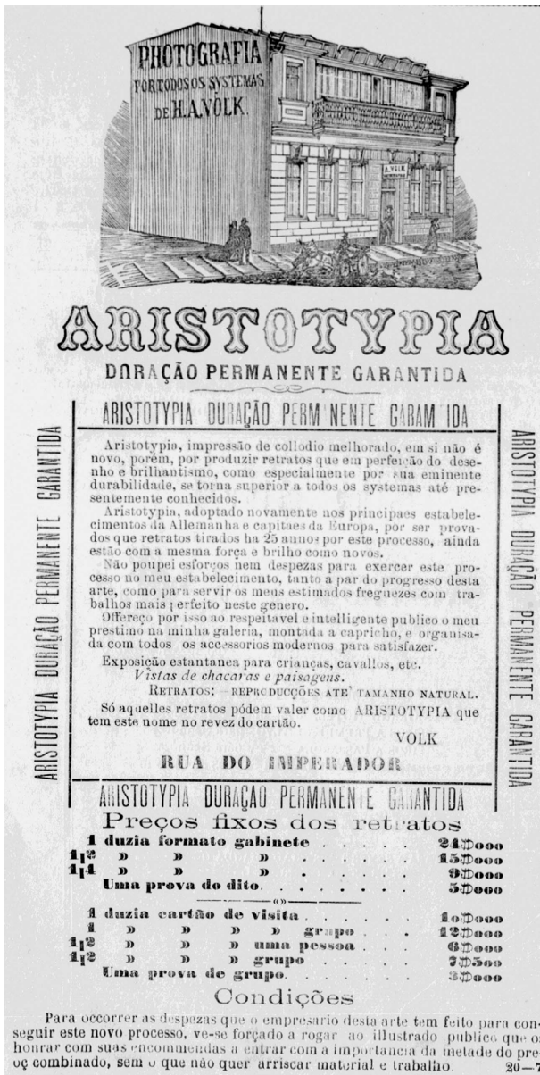
Figura 3 – Anúncio do estúdio fotográfico de Adolpho Volk.