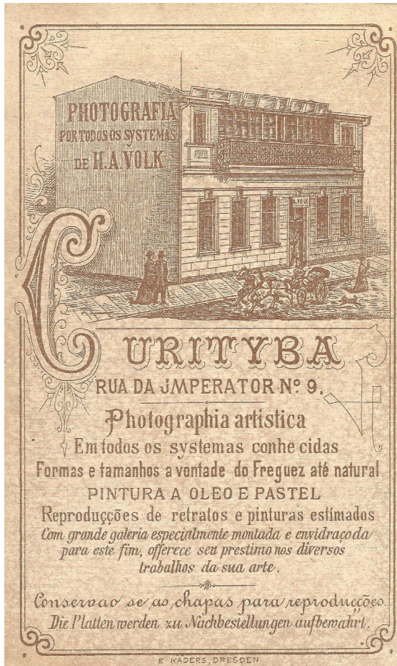
Figura 4 – Verso de cartão fotográfico em formato carte de visite do Estúdio Volk, c. 1888.

Constata-se ainda que, exceto pela maior quantidade de informações nele presentes, o anúncio então publicado em muito se assemelhava ao verso dos cartões sobre os quais foram afixados os retratos produzidos pelo estúdio naquele mesmo ano (Figura 4). 18 Produzidos na Alemanha, em cidades como Berlim e Dresden, os cartões apresentavam a mesma ilustração veiculada pelos jornais, variando apenas em alguns detalhes na disposição dos personagens. Por isso, pode-se propor que as mensagens iconográficas e textuais presentes no verso das fotografias do estúdio visavam veicular mensagem similar àquela estampada nos anúncios dos periódicos locais.