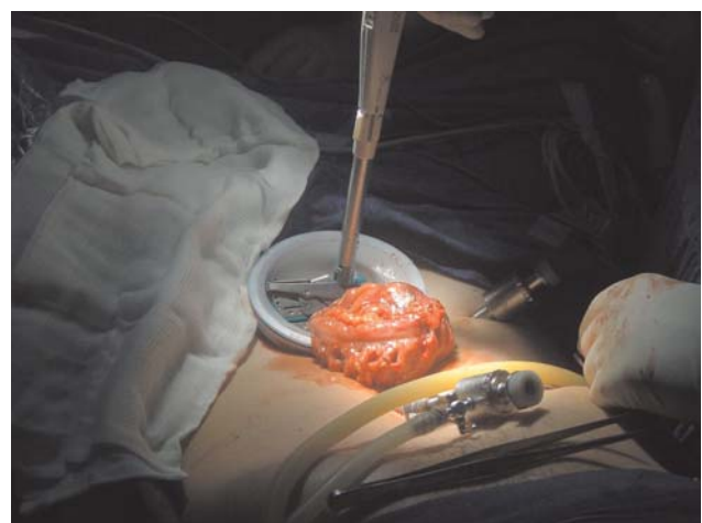
Figura 2 - Fechamento do reto com grampeador linear.

A cirurgia laparoscópica tem aparecido, cada vez mais, como uma opção de cirurgia de urgência para as mais variadas patologias, como apendicite aguda, colecistite aguda, patologias anexiais, diverticulite aguda, entre outros. (10,11,12)