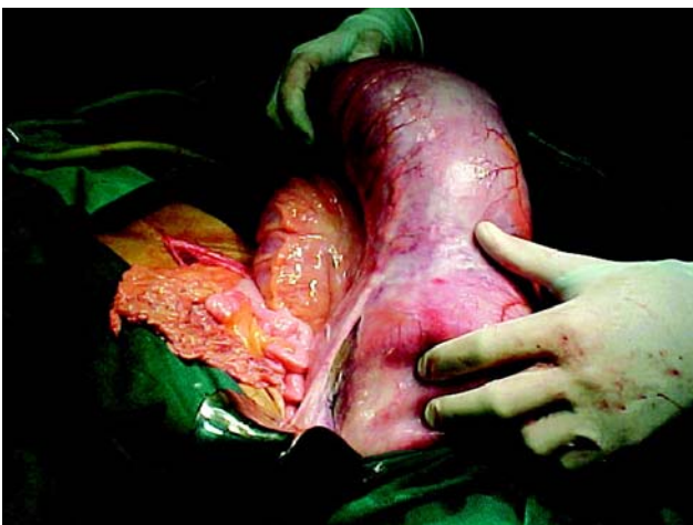
Figura 1 - Área de perfuração intestinal na porção posterior do terço médio do reto.

Enfatiza-se a importância do conhecimento dos riscos deste procedimento, que é de certa forma invasivo e utilizado corriqueiramente.