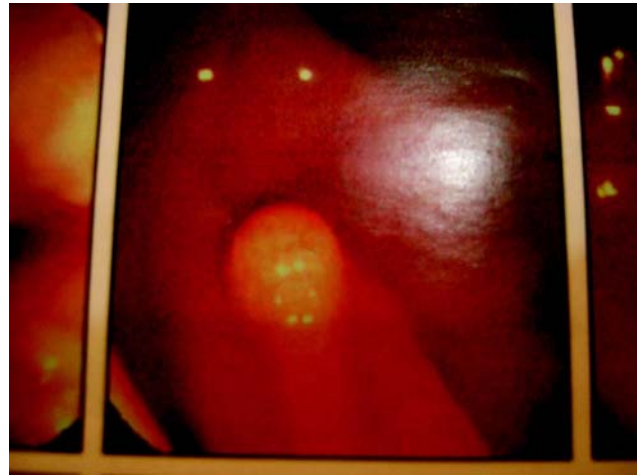
Figura 3 – Estudo imunohistoquímico cromogranina (40 x).

As formas mais comuns de apresentação são ulceração ou nódulo submucoso de aspecto mamelonado; no entanto, podem surgir como simples