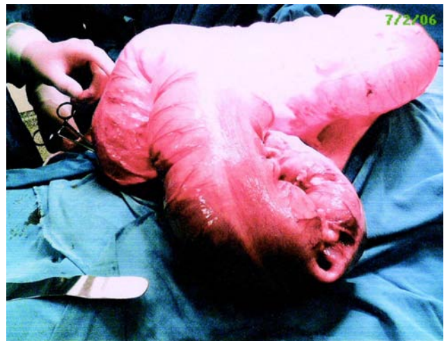
Figura 5 – Megacólon com volvo de sigmóide.