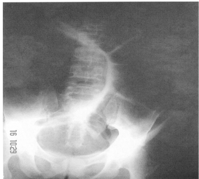
Figura 3 – Rx de abdome agudo evidenciando volvo de sigmóide.