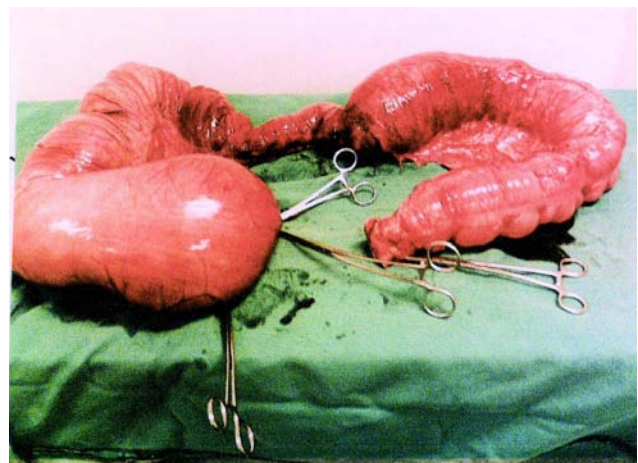
Figura 6 – Megacólon.