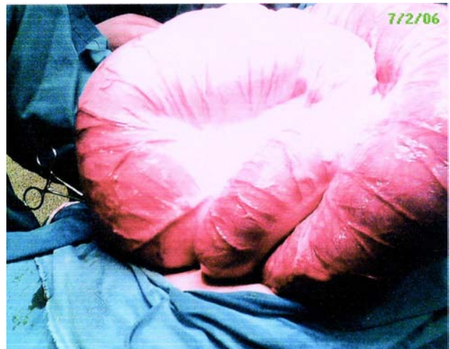
Figura 4 – Megacólon com volvo de sigmóide.

Em adultos, a síndrome costuma ser associada a cirrose, ascite (6) , enfisema, hipotireoidismo com constipação crônica, hipertensão arterial, coronariopatias, apendicite, ectopia renal, síndrome de Cushing (9) , esquizofrenia, retardo mental e uso de drogas antipsicóticas. (7)