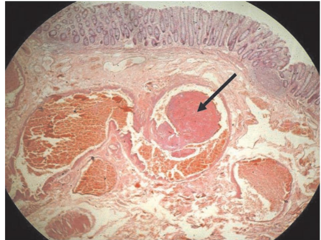
Figura 5 - Exame histopatológico: Formação de trombo em vaso da submucosa (seta).

Arteriografia de mesentéricas e ílicas internas podem identificar a existência de sangramentos