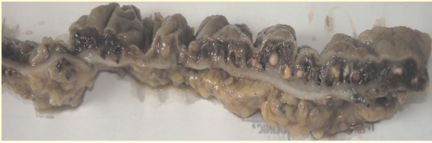
Figura 4 - Peça cirúrgica enviada para exame anátomo-histopatológico: presença de flebolitos.

desde a infância, o diagnóstico geralmente não é feito antes de 30 anos de idade. Em geral, pacientes portadores de hemangiomas são submetidos a intervenções cirúrgicas desnecessárias por doenças diagnosticadas incorretamente, como hemorróidas e doenças inflamatórias 3 .