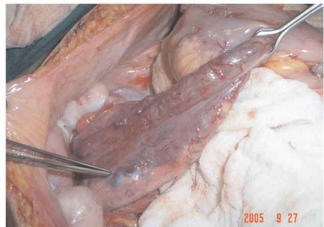
Figura 3 - Achado cirúrgico: Ectasias vasculares em Sigmóide.