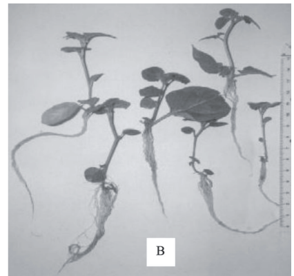
Figura 3. Microestacas de batata sob enraizamento (A) e mudas enraizadas após 30 dias em casa de vegetação (B). Pelotas, Embrapa Clima Temperado, 2001.

desse estar relacionado com fatores nutricionais da planta matriz. É possível que a precocidade na extração do material tenha favorecido o enraizamento pela maior presença de reservas nas microestacas já que um período mais prolongado para a coleta do material poderia levar a planta a se utilizar destas reservas, acumuladas ainda no período em que permaneceram in vitro , para sustentar o seu crescimento nas primeiras semanas de aclimatização (Cappelades et al. , 1991; Pereira et al. , 2001a). Além disso, diversos trabalhos têm mostrado haver correlação positiva entre o conteúdo de reservas nas estacas e a taxa de enraizamento (Davis e Hartmann, 1988; Chalfun, 1989). Entretanto, por não terem sido realizados mais experimentos para verificar tal hipótese e como houve aumento na porcentagem de enraizamento também nos ma-