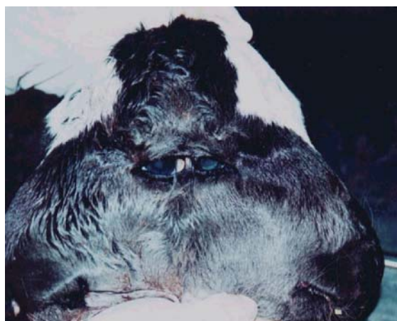
Figura 1. Diprosopia em bovino - duplicação das estruturas faciais do tipo tetraoftálmico, com fusão do canto lateral dos olhos.

Palavras-chave: bovino, diprosopia, duplicação craniofacial