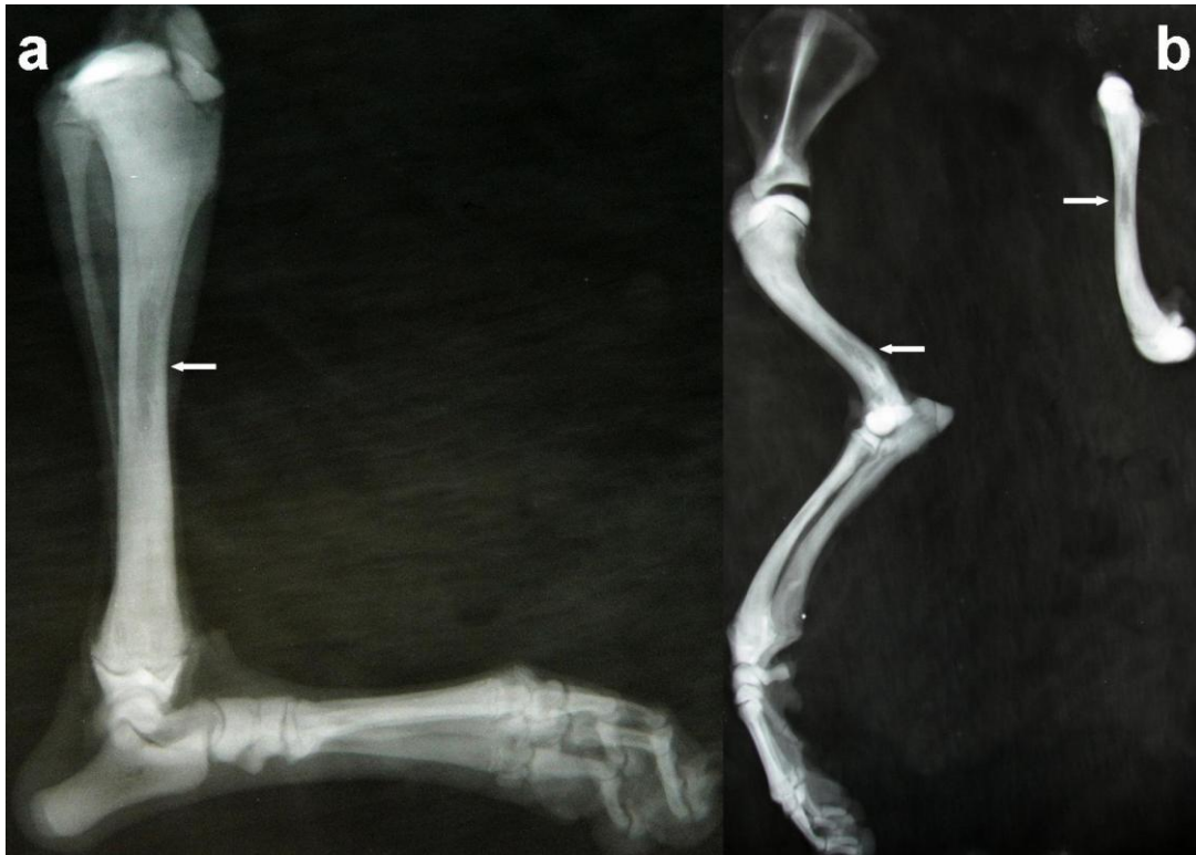
Figura 1. Paciente canino, fêmea, SRD, nove meses de idade, com osteopetrose. (a) Imagem radiográfica da tíbia (seta); (b) imagem radiográfica do úmero, fêmur e tíbia, demonstrando aumento da radiopacidade óssea, com hipertrofia da região cortical (setas), sem alteração do formato ósseo.

longos, com hipertrofia da cortical óssea e, radiograficamente, os ossos apresentaram intensa mineralização, assim como no relato de Riser e Frankhauser (1970) (Fig. 1).