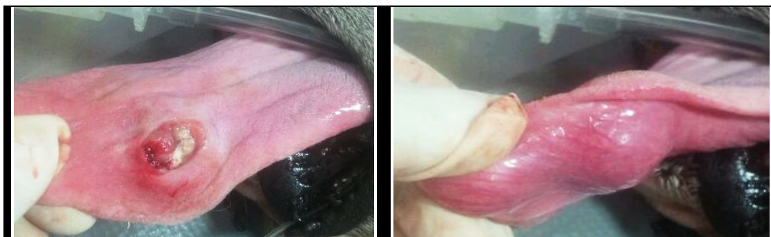
Figura 1. Mastocitoma de alto grau em língua de cão antes do tratamento radioterápico. Observa-se massa ulcerada no terço médio da língua.

Um canino da raça Boxer, fêmea, de oito anos de idade, foi atendido com salivação, halitose e disfagia. O proprietário relatou episódios de vômitos e diarreia esporádicos. No exame clínico, foi observada uma massa ulcerada no terço médio da língua, com intensa necrose, medindo 3,5 x 4,0cm (Fig. 1). O animal se apresentava ativo e clinicamente saudável.