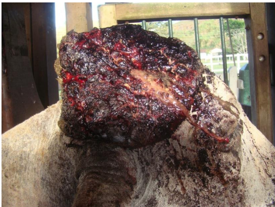
Figura 2. Carcinoma espinocelular da base do chifre em uma vaca. Superfície do processo neoplásico irregular, ulcerada e recoberta por exsudato serossanguinolento e por substância enegrecida (Unguento Friezol® – Laboratório Pinus – Brasil). Vista lateral do tumor.