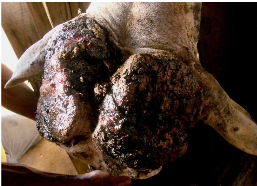
Figura 1. Carcinoma espinocelular da base do chifre em uma vaca. Grandes massas exofíticas, bilaterais e simétricas na base dos chifres.

Macroscopicamente, observaram-se grandes massas exofíticas, bilaterais e simétricas, com cerca de 20cm de diâmetro cada, localmente invasivas na base dos chifres (Fig. 1). A superfície do processo neoplásico era irregular, ulcerada e recoberta por exsudato serossanguinolento e por substância enegrecida (Unguento Friezol® – Laboratório Pinus – Brasil) (Fig. 2). Ambas as lesões eram de consistência firme e, ao corte, revelavam superfície seca e dois padrões de coloração, entremeados: amarelo-palha e brancacenta. Havia profunda infiltração bilateral e preenchimento dos seios cornuais, atingindo parte dos frontais. Não havia delimitação evidente ou cápsula perceptível (Fig. 3). A hipófise estava moderadamente aumentada de volume (2cm x 1,5cm) e, ao corte, evidenciava pequena formação cística com aproximadamente 1cm em seu maior diâmetro; os ovários apresentavam entre seis e oito folículos visíveis cada um.