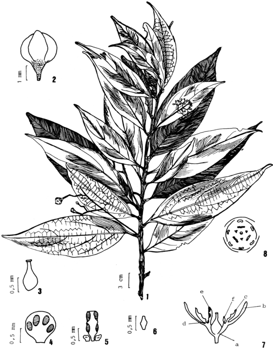
Nectandra membranacea ssp. cuspidata (Nees) Rohwer. (IPA 31955).

1 - Ramo. 2 - Botão em vista lateral. 3 - Estame do 1º e 2º verticilos, com locelos introrsos, dispostos em arco. 4 - Estame do 3º verticilo, com locelos lateralmente extrorsos, com nectários estaminodiais anexos, sésseis. 5 - Estaminódio do 4º verticilo. 6 - Pistilo. 7 - Diagrama floral. 8 - Diagrama esquemático da flor em seção longitudinal: a) hipanto; b) tépalas do 1º e 2º verticilos, externos (séries I e II); c) estames do 1º e 2º verticilos, externos opostos às tépalas; d) nectários estaminodiais anexos ao estames do 3º verticilo, interno; e) estames do 3º verticilo, interno (série III); f) estaminódios do 4º verticilo, interno (série IV).