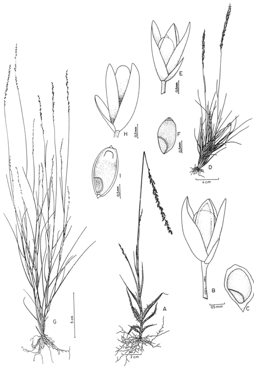
Fig. 8. A-D Sporobolus hians : A. hábito; B. espigueta jovem; C. espigueta madura; D. cariopse (A-C. Macedo 2045-US; D. Macedo 5100-HB). E-G. S. monandrus : E. hábito; F. espigueta; G. cariopse (E. Simas s.n. - BLA 6594; F. Valls et al. 2697 - ICN; G. Barreto s.n. - BLA 1592). H-J. S. tenuissimus : H. hábito; I. espigueta; J. cariopse (Valls & Werneck 9874 - ICN).