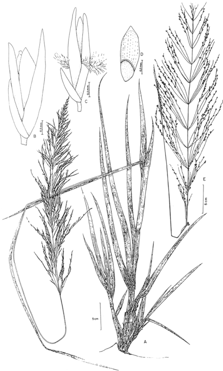
Fig. 12. A-C. Sporobolus recurvatus : A. hábito; B. espiguetas com asperezas nítidas nas glumas; C. cariopse (A. Chase 11887 - SP; B. Anderson 9416 - UB; C. Irwin et al. 17840 - UB).