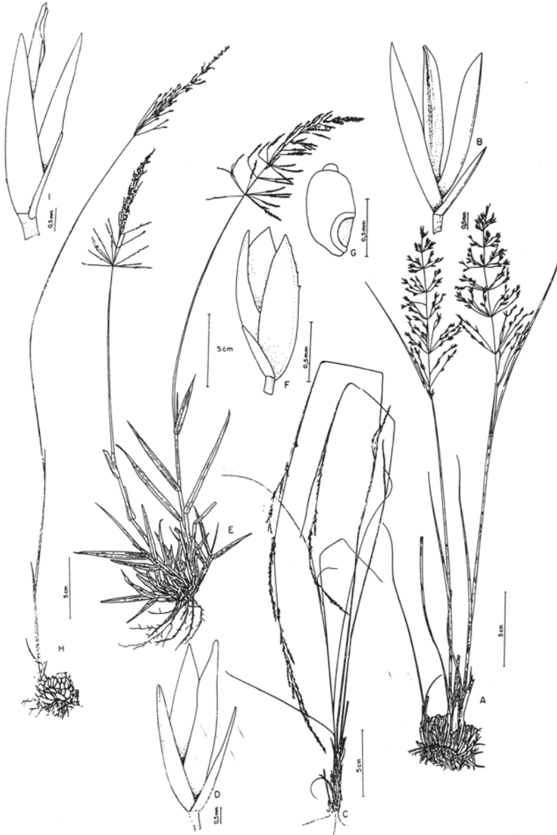
Fig. 7. A-C. Sporobolus eximius : A. hábito; B. espigueta; C. cariopse (Swallen 9031 - PEL). D-G. S. eximius var. latifolius : D. hábito; E. espigueta; F. espigueta com fruto; G. cariopse (D, G. Valls et al. 11269 - CEN; E-F. Valls et al. 11257 - ICN).