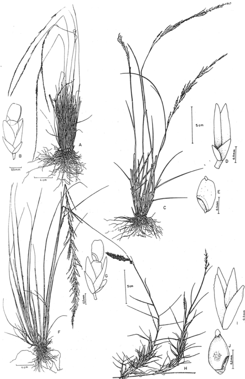
Fig 2. A-D. Sporobolus acuminatus var. longispiculus : A. hábito; B. espiguetta com fruto; C. espiguetta, estiletes plumosos expostos; D. cariopse (A. Valls 9452 - ICN; B,D. Lindeman & Haas 4411 - NY; C. Pott 4566 - CPAP). E. S. acuminatus var. longispiculus (atípico); F. inflorescência (Irwin et al. 34557 - SP).