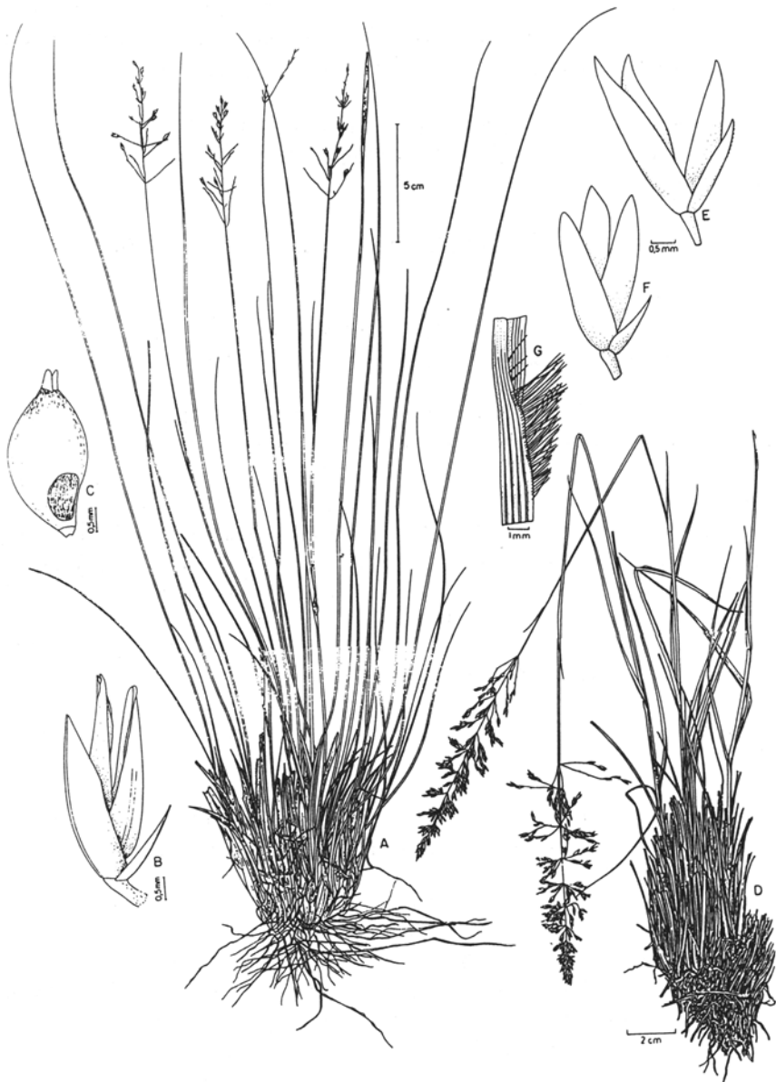
Fig. 3. A-C. Sporobolus adustus : A. hábito; B. espiguetas; C. espiguetas, gluma superior envolvendo o antécio (A. Valls et al. 2139 - ICN; B. Smith & Klein 15591 - US; C. US 998643). D-E. S. linearifolius : D. hábito; E. espiguetas (Valls et al. 11418 - ICN) F-G. S. reflexus : F. inflorescências; G. espiguetas (Brochado 68 - IBGE).