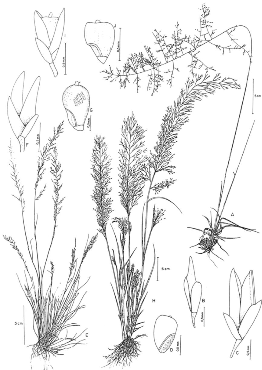
Fig. 1. A-D. Sporobolus acuminatus : A. hábito; B. espiguetas; C. espiguetas com fruto; D. cariopse (A. Bordo 44 - SP; B-D. Valls et al. 9439 - ICN). E-F. S. camporum : E. inflorescência; F. espiguetas com fruto (E. Simas 2 - BLA; F. Swallen 8015 - PEL).