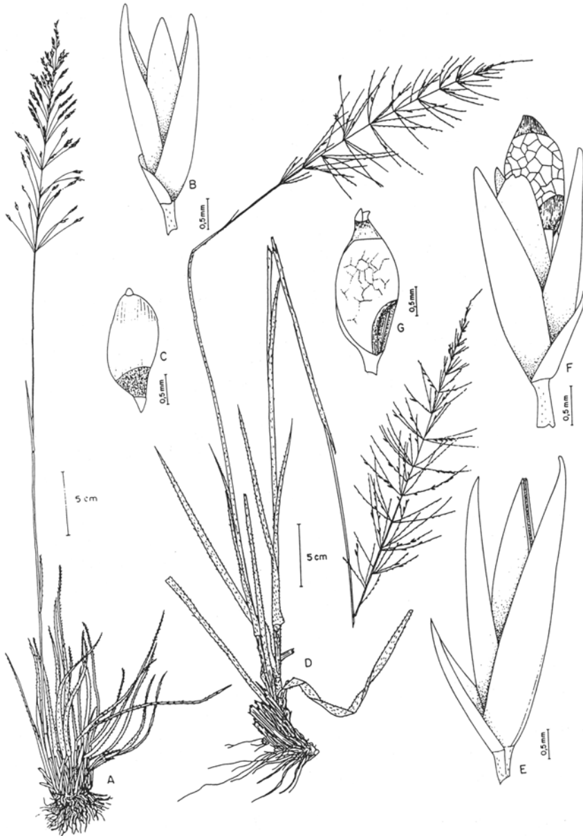
Fig. 6. A-C. Sporobolus ciliatus : A. hábito; B. espiguetas com fruto, glândulas no pedicelo, pálea rompida em duas metades; C. cariopse com pericarpo laxo e alado (Burman 576 - SP). D-F. S. metallicolus : D. hábito; E. espiguetas com fruto; F. cariopse (D. Irwin 30223 - UB; E-F. Irwin 28813 - MBM). G-I. S. multiramosus : G. hábito; H. espiguetas; I. cariopse com pericarpo alado (G-H. Rosa & Silva 4680 - SP; I. Cavalcanti 2125 - US).