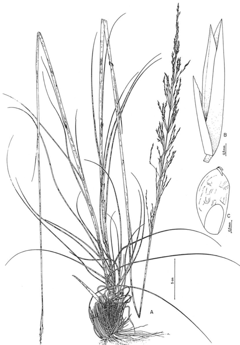
Fig. 4. A-D. Sporobolus aeneus : A. hábito; B-C. espiguetas mostrando variação no comprimento da gluma superior e lema em relação à pálea; D. cariosop (A,B,D. CFCR 6162 - SPF; C. Anderson 35587). E-H. S. purpurascens : E. hábito; F. espiguetas; G. espiguetas com fruto; H. cariosop (E. Chase 7991 - US; F, H. Burman & Sendulsky 779 ICN; G. Irwin et al. 23507 - US).