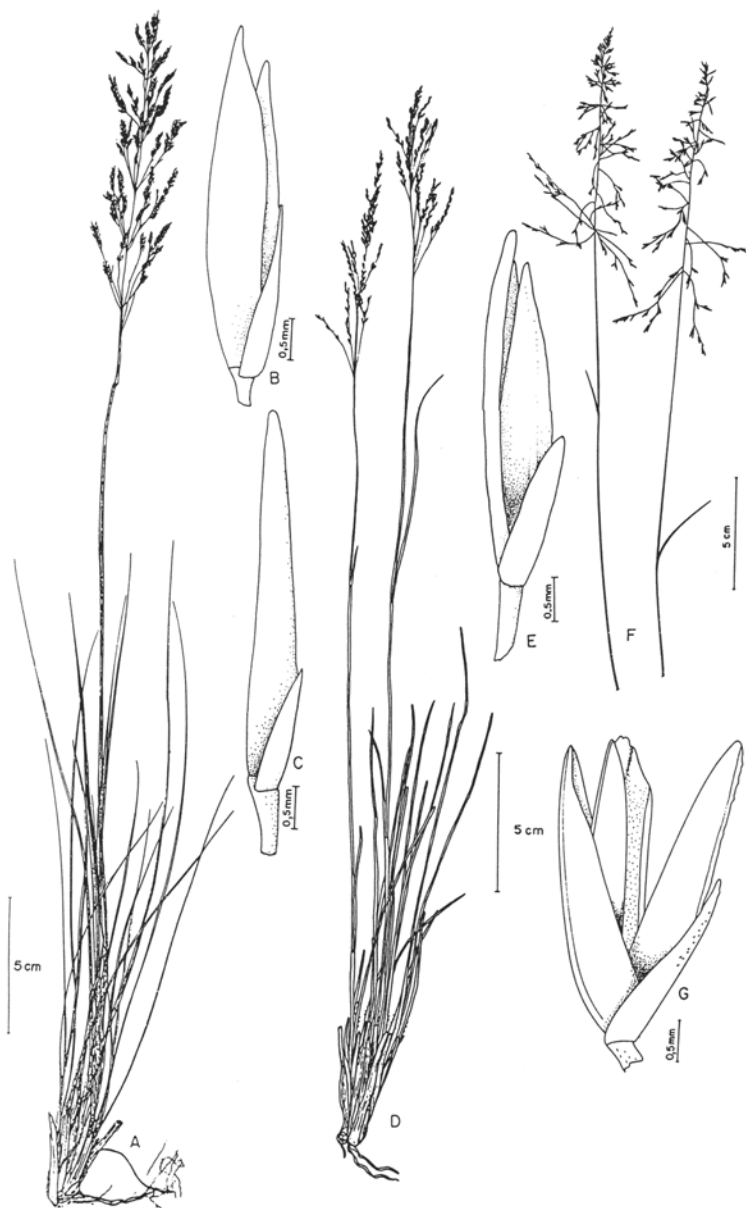
Fig. 9. A-B. Sporobolus indicus : A. hábito; B. espiguetta mostrando o epicarpo e o mesocarpo do fruto rompido liberando a semente (CFSC 1981 - SP). C-E. S. indicus var. pyramidalis : C. hábito; D. espiguetta; E. cariópse (Valls et al. 10360 - ICN). F-G. S. pseudairoides : F. hábito; G. espiguetta com fruto (Burman 537 - SP). H-J. S. virginicus : H. hábito; I. espiguetta desarticulada do pedicelo; J. cariópse (H. Ronna s.n. - ICN 31631; I, J. Ronna s.n. - ICN 31626).