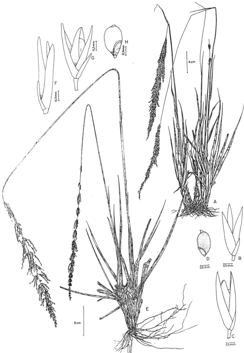
Fig. 10. A-B. Sporobolus minarum : A. hábito; B. espiguetta (Leitão Filho et al. 1191 - ESAL). C-D. S. platensis : C. hábito, mostrando inflorescência cleistogênica; D. espiguetta (C. Valls 9756 - ICN); D. Valls et al. 4706 - ICN). E-G. S. pyramidatus : E. hábito; F. espiguetta; G. cariópsse (Valls et al. 10316 - ICN). H-I. S. paucifolius : H. hábito; I. espiguetta (Heringer et al. 2382 - IBGE).