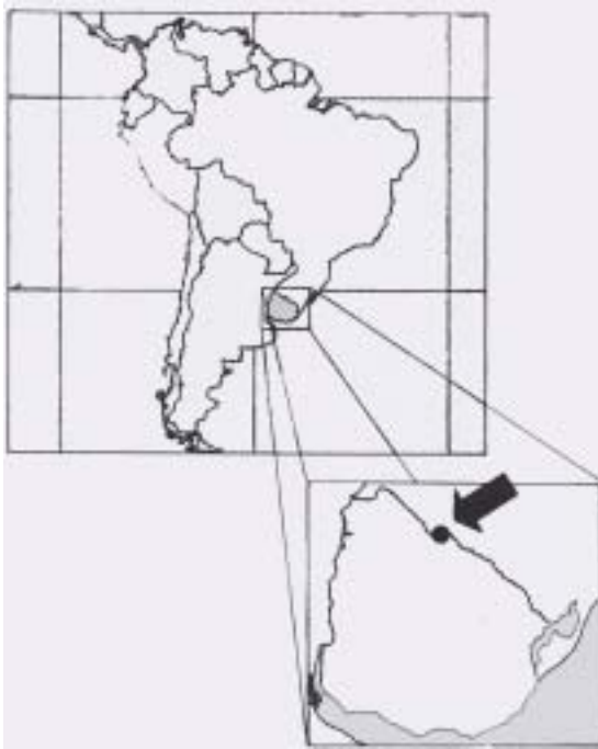
Figura 1. Ubicación del área de estudio.

La actividad maderera fue abandonada antes de completar el área prevista, quedando inalterada parte de la misma (la que se utilizó como testigo para comparar la evolución de la comunidad). Esto provocó el rápido inicio de una sucesión que llevó a la cobertura total del dosel arbóreo en poco tiempo. No obstante la regeneración de la cubierta arbórea, es necesario determinar si la misma posee características similares a la original o no.