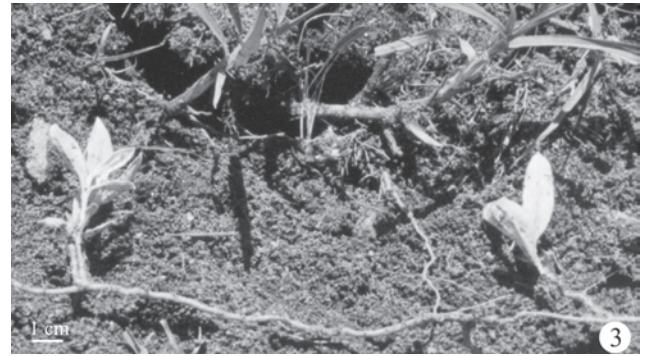
Figura 3. Raíz gemífera en Pfaffia gnaphalioides (L. Fil.) Mart. Campo experimental "Las Guindas" (área serrana). Universidad Nacional de Río Cuarto, Córdoba.

a partir de la formación de nuevos brotes de innovación que se desarrollan a partir de raíces gemíferas, lo cual permite una extensa colonización, cubriendo rápidamente el área en forma de manchones característicos.