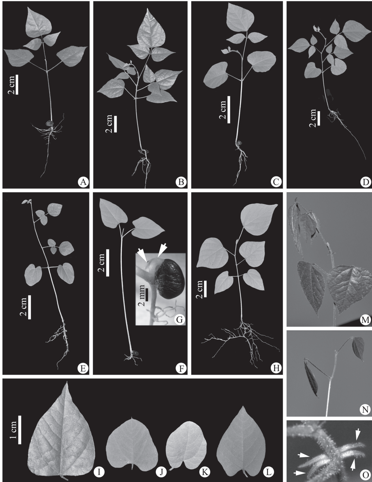
Figura 2. Plântulas de Rhynchosia Lour. (Leguminosae, Papilionoideae). A-B. Rhynchosia phaseoloides . C-D. Rhynchosia melanocarpa . E. Rhynchosia minima . F. Rhynchosia schomburgkii . G. Detalhe dos pecíolos cotiledonares (setas) de Rhynchosia schomburgkii . H. Rhynchosia schomburgkii . I-L. Eofilos do primeiro nó (E1). I. Rhynchosia phaseoloides . J. Rhynchosia melanocarpa . K. Rhynchosia minima . L. Rhynchosia schomburgkii . M-N. Nictinastia descendente. M. Rhynchosia phaseoloides . N. Rhynchosia schomburgkii . O. Estípulas duplas, livres entre si (setas), dos eofilos do primeiro nó de Rhynchosia phaseoloides . (A, M: Flores & Rodrigues 2470; B, I, O: Flores & Rodrigues 2475; C, J: Flores & Rodrigues 2473; D: Flores & Rodrigues 2477; E, K: Flores & Rodrigues 2471; F, L: Flores & Rodrigues 2478; G, N: Flores & Rodrigues 2476; H: Flores & Rodrigues 2479).