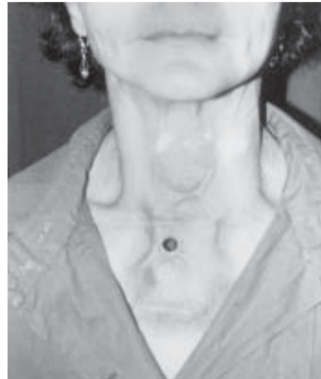
Figura 2 Traqueostomia bem cicatrizada

A técnica cirúrgica empregada para a remoção do tumor primário e os órgãos envolvidos consistiu inicialmente numa