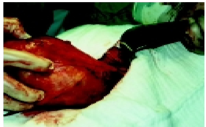
Figura 3 – PC pancreático em região justadiafragmática

Nesse período foi realizado ultra-som, que mostrou grande coleção cística (> 20cm) em andar superior de abdome, sugestivo de pseudocisto de pâncreas, e derrame pleural volumoso à esquerda. Esses achados foram confirmados pela tomografia toracoabdominal realizada na seqüência, que apresentava volumosa coleção hipodensa, arredondada, de contornos bem definidos, circundada por fina cápsula medindo 11,6 x 8,8cm (Figura 2) e descartando a possibilidade de eventração diafragmática.