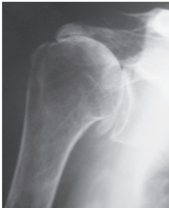
Figura 2 – Imagem radiográfica pré-operatória de ombro direito (caso 11) evidenciando artropatia por lesão do manguito rotador classificada como Hamada IV e Visotsky IIA. Este é um caso em que se observa a acetabulização.

Todos os casos foram classificados com base nos critérios radiográficos propostos por Hamada et al (3) . Estes autores definiram cinco estágios baseados em radiografias, considerando principalmente o intervalo acrômio-umeral (IAU) como indicador sensível de LMR extensa: a distância de 6 a 7mm tomada como limite mínimo para ombros normais (3) . Classificamos um caso como grau II (IAU inferior ou igual a 6mm); um caso como grau III, pois ocorreu a acetabulização 1* (aumen-