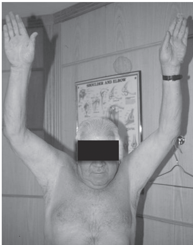
Figura 4 – Imagem de paciente (caso 1) no pós-operatório tardio, classificado como resultado satisfatório

pacientes em relação ao alívio da dor foi de 81,8% (tabela 1).