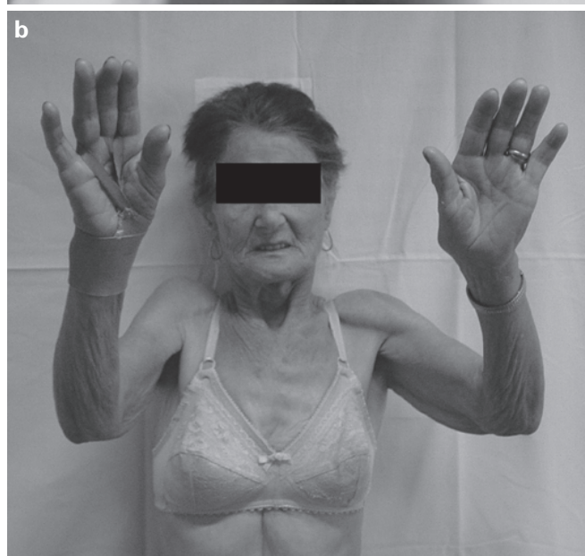
Figura 5 – Caso 11. (a) Imagem radiográfica pós-operatória de ombro direito (caso 11) evidenciando ascensão da prótese que se está articulando com o arco coracoacromial, (b) Imagem da paciente no pós-operatório tardio classificada como resultado insatisfatório.