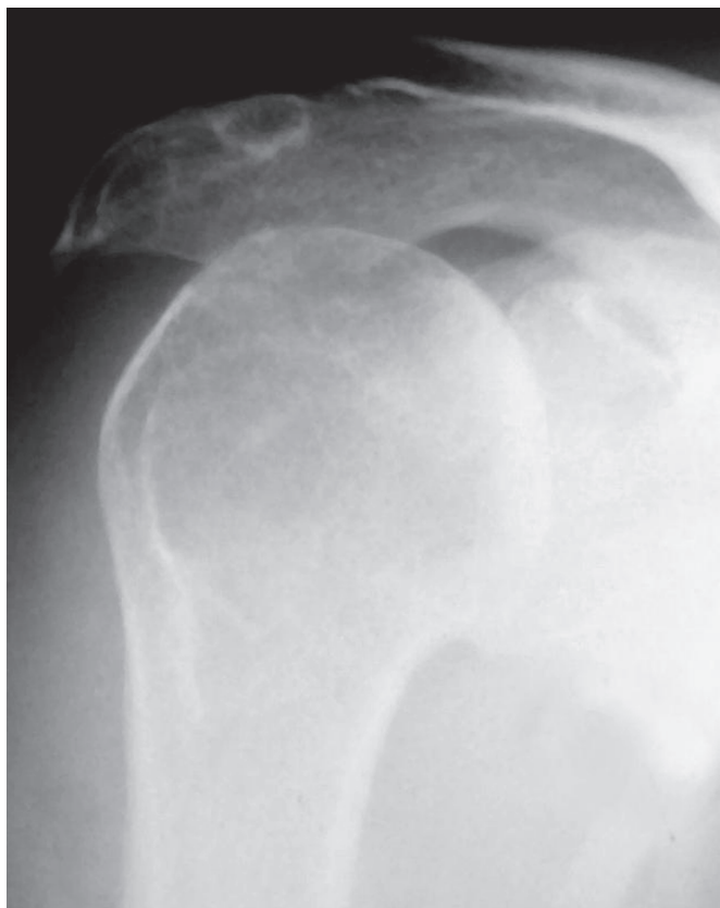
Figura 1 – Imagem radiográfica pré-operatória de ombro direito (caso 1) evidenciando artropatia do ombro por lesão do manguito rotador classificada como Hamada IV e Visotsky IA

Exames radiográficos foram realizados em todos os pacientes seguindo a padronização proposta por Do- neux et al , para permitir melhor avaliação pré e pós-operatória (9) (figura 1).