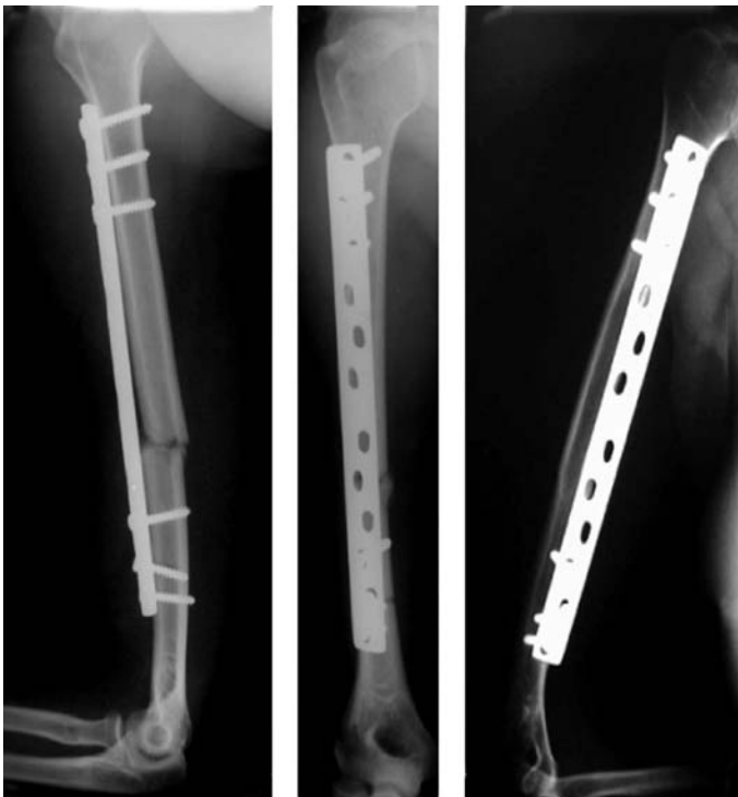
Figura 3 – Placa em ponte

A consolidação ocorreu em 100% do grupo PP e 94,7% do grupo HIB, números bastante próximos aos encontrados por Sarmiento et al (8) , de 98%, com o tratamento não cirúrgico das FDU. Outros índices de consolidação com o uso de hastes intramedulares são