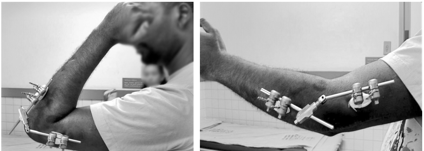
Figura 6 – Pós-operatório de artroólise aberta extensa mobilizando precocemente o cotovelo em regime ambulatorial utilizando um fixador externo articulado (A) e (B)

Cabe ressaltar, que cada paciente necessita uma abordagem individualizada utilizando-se uma ou mais, das técnicas descritas.