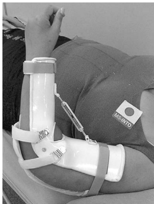
Figura 1 – Paciente utilizando imobilizador articulado com dispositivo para ganho passivo de amplitude de movimento (flexão)

O exame sob anestesia é controverso, quanto a suas indicações e eficácia. Morrey recomenda esse procedimento, em pacientes que durante o período pós-operatório não responderam à reabilitação, mesmo com uso de imobilizadores articulados, fisioterapia, e até aparelhos de mobilização articular contínua (Amac) (1) (Figura 1).