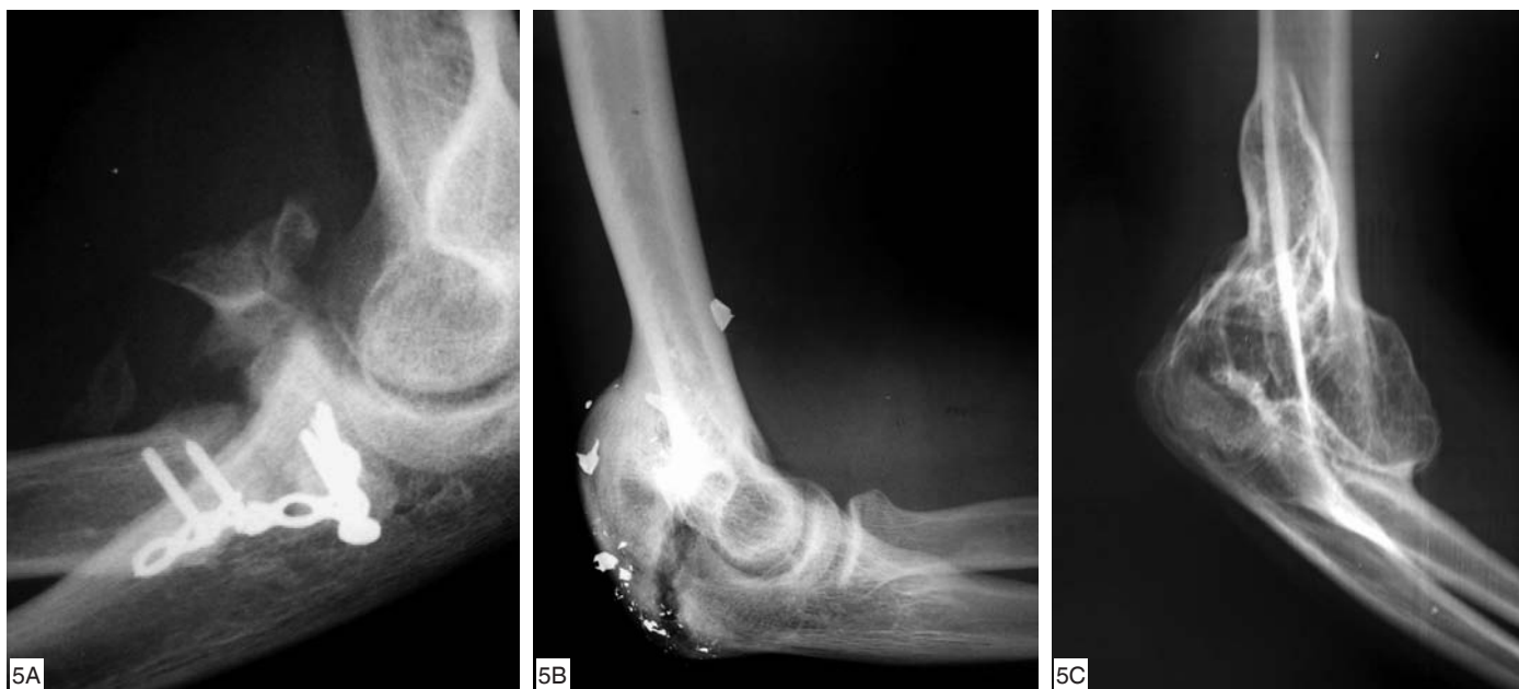
Figura 5 – Imagens radiográficas evidenciando diferentes tipos de ossificações heterotópicas de acordo com a classificação de Hasting. (A) Tipo I com ossificação heterotópica isolada em partes moles, (B) tipo IIA a presença de barra óssea incompleta e (C) tipo IIB anquilose articular

Na literatura ortopédica há pouca informação a respeito desse procedimento. Mansat e Morrey (24) relatam 76% de resultados satisfatórios, porém, com 50% de complicações, sendo dois casos de infecção profunda. Além disso, segundo Mansat e Morrey (24) e Blaine et al (25) , a artroplastia total do cotovelo, em pacientes que previamente foram submetidos a artroplastia de interposição, apresenta resultado e incidência de complicações comparadas às das séries de revisão de artroplastia total de cotovelo (Figura 5, A, B e C).