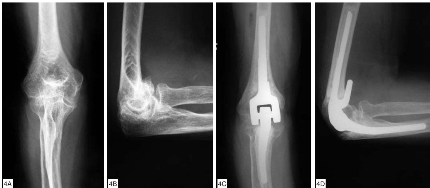
Figura 4 – Incidências radiográficas em anteroposterior (A) e perfil (B) de um paciente com anquilose articular submetido à artroplastia total semiconstrita do cotovelo (C) e (D)

O emprego do fixador externo articulado, por quatro a seis semanas é recomendado, propiciando distração articular, estabilidade e permitindo a mobilização precoce (20) .