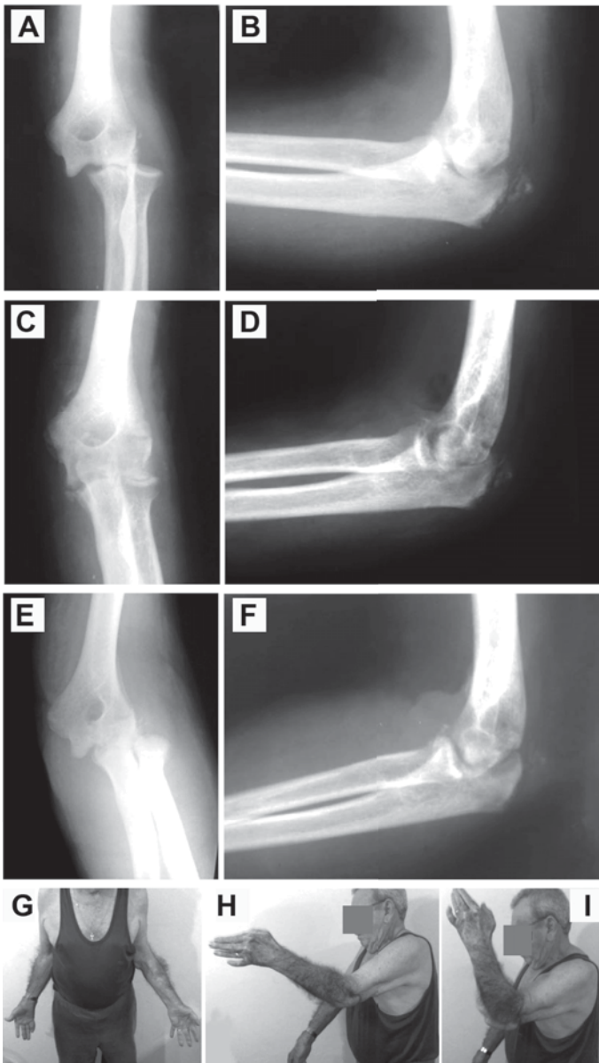
Figura 2 – Imagens referentes ao paciente de número 4, que teve um mau resultado. A e B – Imagem radiográfica em AP e perfil pré-operatória mostrando luxação lateral do cotovelo esquerdo. C e D – Imagem radiográfica pós-operatória, em AP e perfil, do cotovelo esquerdo mostrando redução da luxação. E e F – Imagem radiográfica do cotovelo esquerdo, em AP e perfil, com recidiva da luxação. G, H e I – Imagens de frente e perfil com flexão e extensão máxima do cotovelo esquerdo do paciente ao final do seguimento.

excessiva compressão pelos afastadores no acesso lateral ou durante a confecção do portal anterolateral na