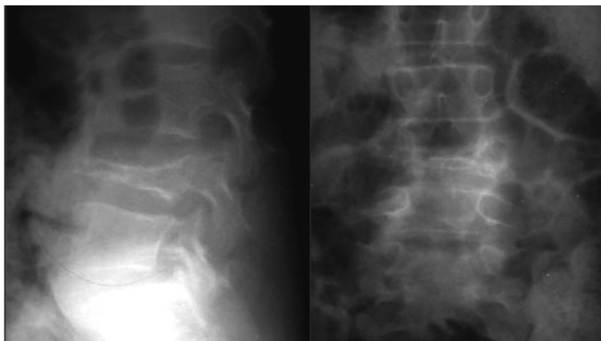
Figura 1 – Radiografia inicial na qual se observa a fratura.

Paciente do sexo masculino, 13 anos, estudante, hígido. Apresentou queda da própria altura evoluindo com dor lombar de moderada intensidade. Necessitou atendimento de urgência sendo medicado com analgésicos. Após uma semana, com manutenção da dor, o paciente retornou para atendimento em que foi radiografado, resultando no diagnóstico de fratura acunhamento do corpo de L4 com perda da altura de 70%, sendo encaminhado ao nosso serviço (Figura 1). Após anamnese e exame