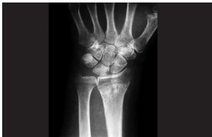
Figura 5 – Radiografia de punho na incidência posteroanterior após a remoção dos fios de Kirschner, demonstrando o resultado final do tratamento da fratura do rádio distal.

Os parâmetros radiográficos pré-operatórios e após seis semanas da realização do procedimento cirúrgico (Figuras 5 e 6) foram aferidos e comparados (Tabela 1). Deve-se destacar que todos os pacientes obtiveram aferições consideradas adequadas no pós-operatório imediato.