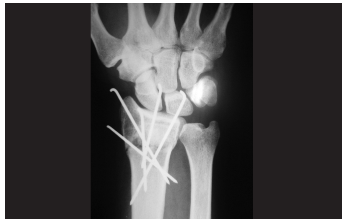
Figura 3 – Radiografia de punho evidenciando o resultado pós-operatório imediato na incidência posteroanterior após a fixação da fratura do rádio distal com fios de Kirschner, com correção da angulação radial e restauração da altura radial.

Todos os FK são posicionados no subcutâneo e as incisões suturadas (Figuras 3 e 4).