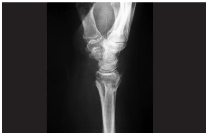
Figura 6 – Radiografia de punho na incidência em perfil após a remoção do material de síntese, demonstrando a correção da angulação volar do rádio distal.