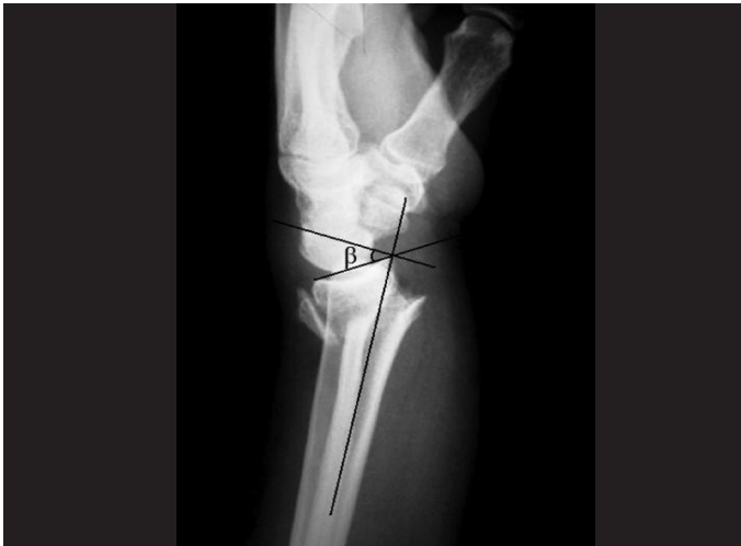
Figura 2 – Radiografia de punho pré-operatória na incidência em perfil evidenciando uma fratura de rádio distal com cominuição dorsal metafisária e desvio dorsal. Nela está demonstrada a inclinação volar ( \beta ).