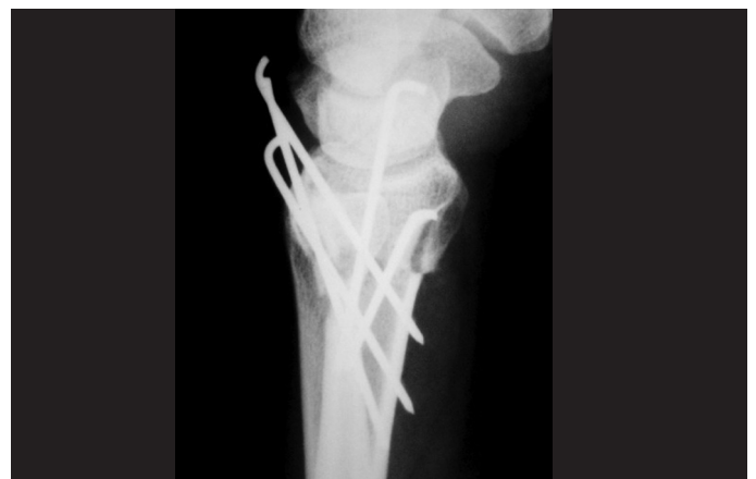
Figura 4 – Radiografia de punho evidenciando o resultado pós-operatório imediato, na incidência de perfil, demonstrando a correção do desvio dorsal do rádio distal.