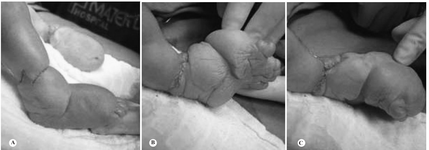
Figura 3 – Peroperatório após liberação das bandas de constrição. A) Liberação em membro inferior direito (zetaplastia). B e C) Liberação em membro inferior esquerdo (zetaplastia).