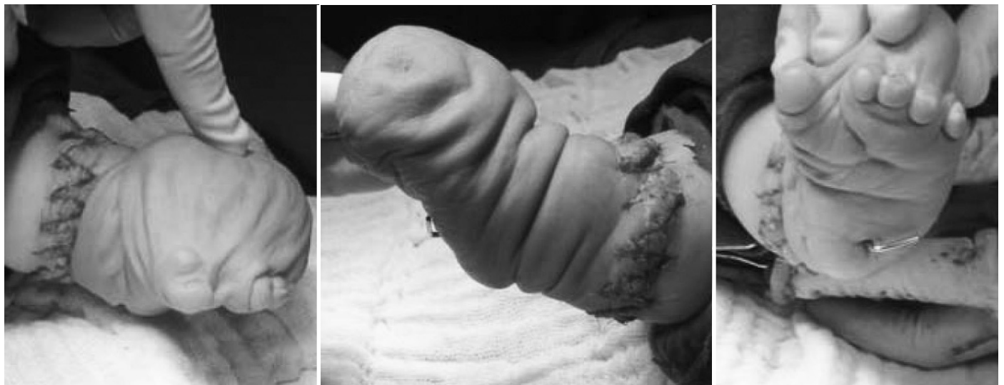
Figura 5 – Correção da pseudoartrose dos ossos da perna esquerda e deformidade do pé torto congênito.