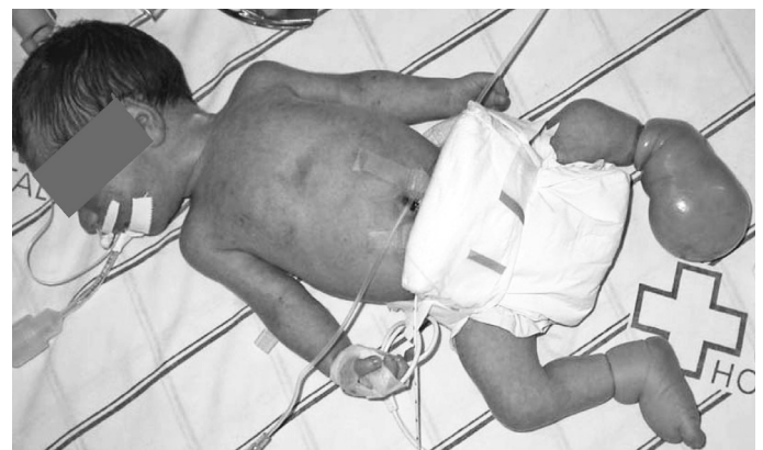
Figura 1 – Estado geral do RN examinado (idade: um dia).

A criança manteve acompanhamento em regime ambulatorial e encontra-se plenamente integrada às atividades da infância, com bom resultado estético e funcional, consolidação da pseudoartrose, apoio com pés plantígrados e melhora da preensão da mão (Figura 9). Atualmente, aos sete anos de idade, apresenta discrepância dos membros inferiores devido ao encurtamento de 1,8cm da perna esquerda (Figura 10) aferida por meio de escanometria digital em seu último retorno.