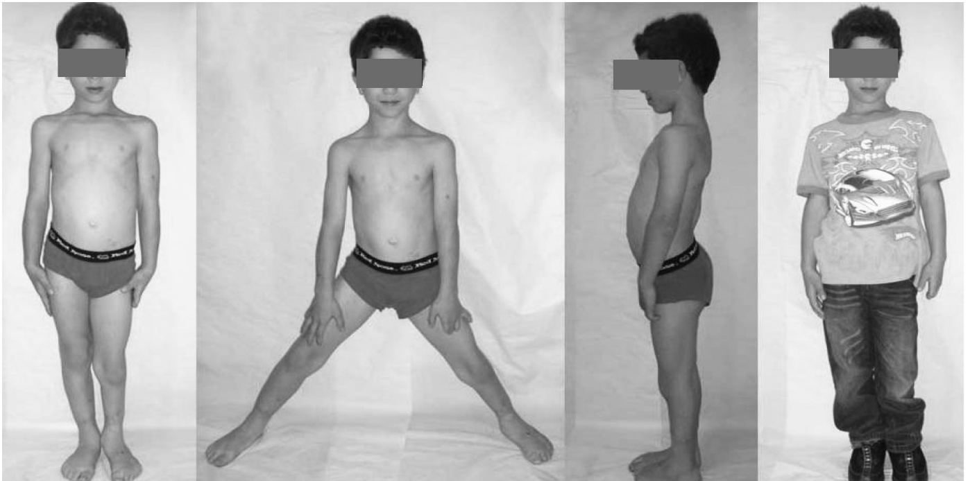
Figura 10 – Criança atualmente. Ótima evolução. Discrepância leve dos membros inferiores confirmada por escanometria (idade: sete anos).