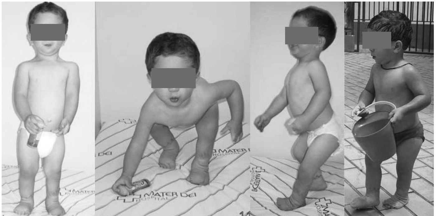
Figura 9 – Criança realizando atividades da vida diária. Observar a funcionalidade dos membros. Ao exame apresentava marcha adequada e pé esquerdo plantigrado. Mão esquerda igualmente funcional (idade: três anos).

uma discreta claudicação e uma escoliose postural leve. Prescreveu-se palmilha compensatória. Avaliações clínicas e radiológicas têm sido realizadas frequentemente. Em caso de aumento da discrepância dos MMII pode ser necessária abordagem cirúrgica para correção da mesma.