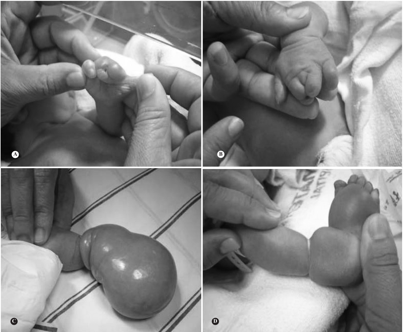
Figura 2 – Detalhes dos membros. A e B) Acrossindactilia. C) Banda de constrição em membro inferior esquerdo. D) Banda de constrição em membro inferior direito.