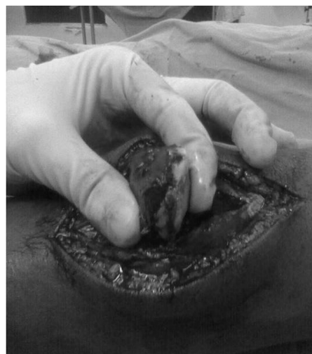
Fig. 2 - Avaliação intraoperatória do joelho esquerdo.