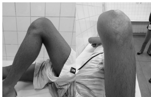
Fig. 4 - Avaliação funcional do joelho esquerdo.