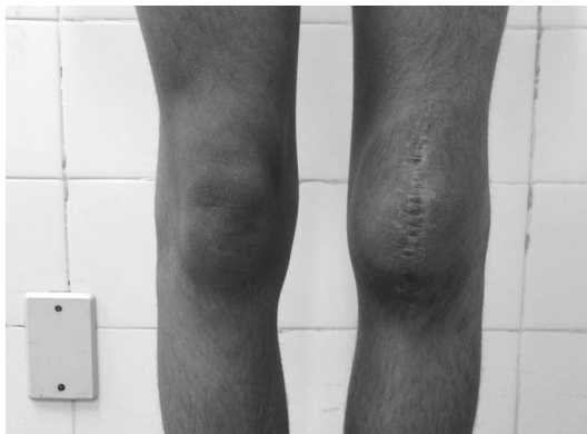
Fig. 5 - Avaliação funcional do joelho esquerdo.