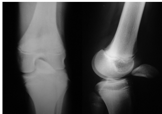
Fig. 1 - Radiografia pré-operatória do joelho esquerdo.

Nosso paciente foi avaliado com uma semana, 15 dias, um mês, 45 dias, dois meses e mensalmente até o sexto mês, quando as consultas passaram a ser trimestrais. Nosso seguimento com esse paciente é de dois anos e o mesmo voltou às suas atividades habituais, sendo acompanhado com um controle radiológico, no qual avaliamos a altura da patela e a classificação pelo escore de avaliação funcional do joelho (Lysholm modificado) 1 (Fig. 3). Obtivemos a média de 90 pontos, considerada um bom resultado segundo o mesmo sistema de avaliação (Figs. 4 e 5). O arco de movimento do joelho esquerdo foi de zero a 120 graus, sendo igual ao lado contralateral. O perímetro da coxa foi de 32 cm do lado esquerdo e 36 cm do lado não operado.