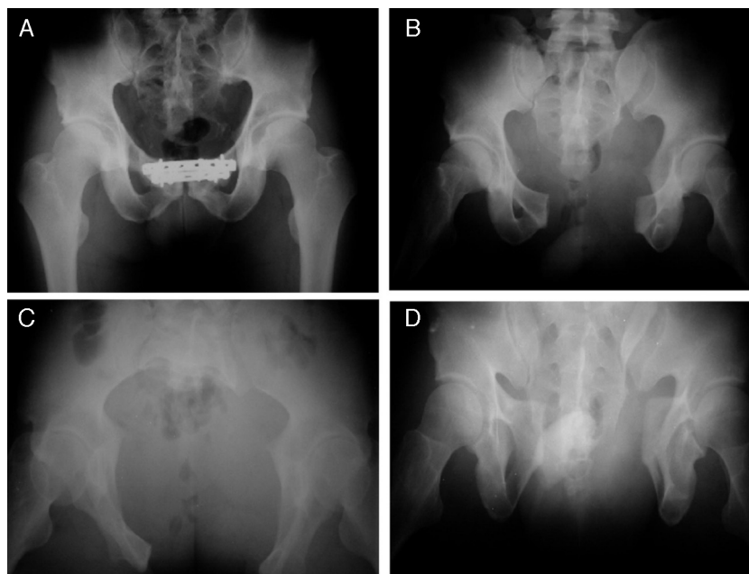
Figura 1 – Radiografias de fratura do anel pélvico. (A) Fratura de pelve tipo B de Tile, radiografia de frente. Imagem do arquivo do Grupo de Quadril do DOT-ISCMSp; (B) Fratura de pelve tipo B de Tile, radiografia inlet. Imagem do arquivo do Grupo de Quadril do DOT-ISCMSp; (C) Fratura de pelve tipo B de Tile, radiografia outlet. Imagem do arquivo do Grupo de Quadril do DOT-ISCMSp; (D) Fratura de pelve tipo B de Tile, radiografia pós-operatória. Imagem do arquivo do Grupo de Quadril do DOT-ISCMSp.

Nesse contexto, as fraturas do anel pélvico, que compõem de 2% a 8% de todas as lesões do esqueleto, incidência que aumenta para 25% nos politraumatizados, representam fator prognóstico negativo no que diz respeito à morbidade e à mortalidade do paciente politraumatizado e nos estimularam a estabelecer o perfil epidemiológico dessas fraturas a partir de revisão bibliográfica. 22