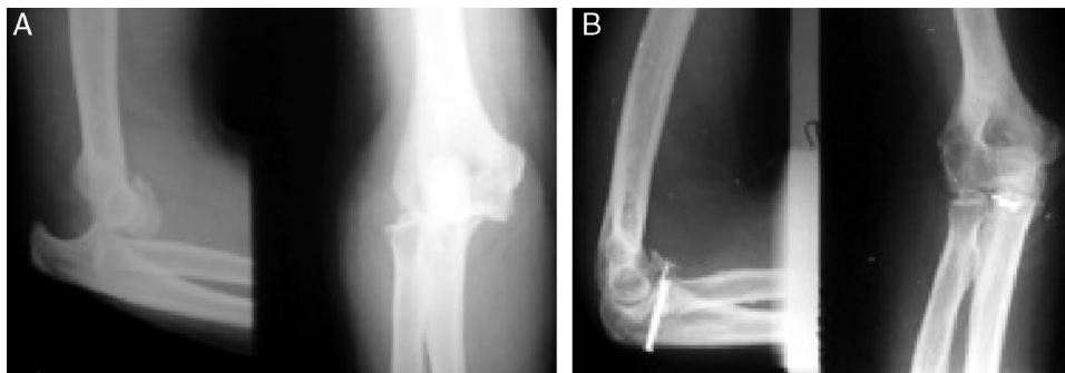
Figura 1 – Uma mulher de 56 anos que sofreu queda da própria altura. A, Radiografia em perfil e anteroposterior prévia à redução que demonstra luxação posterior do cotovelo e fratura da cabeça do rádio tipo 2 com um fragmento anterior cominuído. B, Radiografia em perfil e anteroposterior pós-tratamento cirúrgico que demonstra a redução concêntrica do cotovelo apesar da ressecção do fragmento anterior da cabeça do rádio.

1A com fragmento até 2 mm e 1B com fragmentos maiores do que 2 mm. As fraturas tipo 2 são anteromediais e as tipo 3, da base do processo coronoide. Em 19 pacientes foram identificadas fraturas do processo coronoide tipo 1A e nos demais sete, tipo 1B.