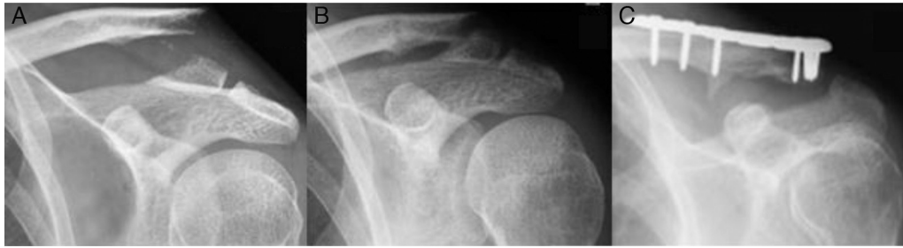
Figura 3 – Imagens radiográficas do ombro esquerdo. A, fratura da ELC; B, não consolidação após tratamento cirúrgico inicial com amarrilho duplo; C, consolidação da fratura após novo procedimento com o uso de placa bloqueada.

As idades foram superiores quando não houve consolidação e quando houve complicação.