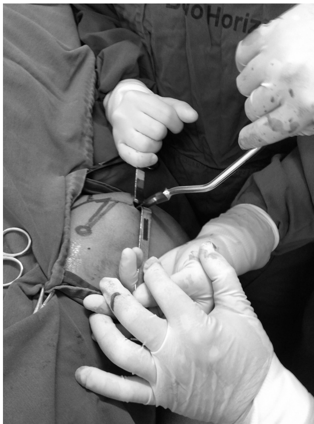
Figura 1 – Utilizando o iniciador manual para realizar o orifício ósseo de entrada.

Quando perguntados quanto ao grau de satisfação, todos os pacientes se mostraram satisfeitos.