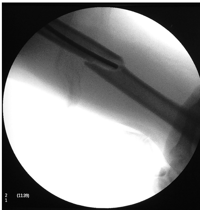
Figura 3 – Redução da fratura e passagem da haste, com uso do intensificador de imagem.

O índice de migração das hastes foi de 33,3% e todas as migrações foram superiores.