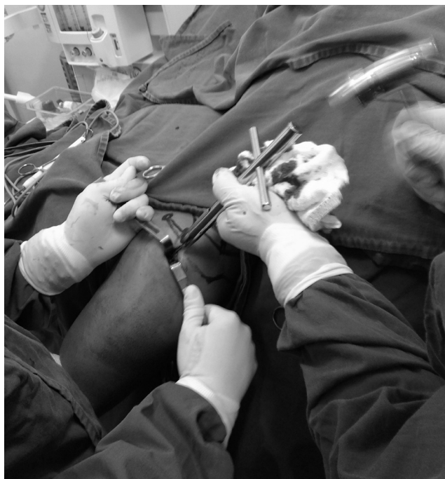
Figura 2 – Inserção da haste de Ender através do orifício ósseo.