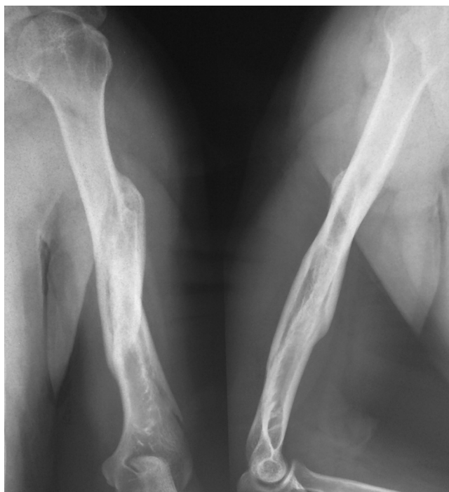
Figura 4 – Radiografia demonstrando processo de consolidação após um mês pós-operatório.

O tempo médio de consolidação da fratura foi de 2,9 meses (dois a quatro) e nenhum paciente evoluiu com retardo de consolidação ou pseudoartrose (fig. 4).