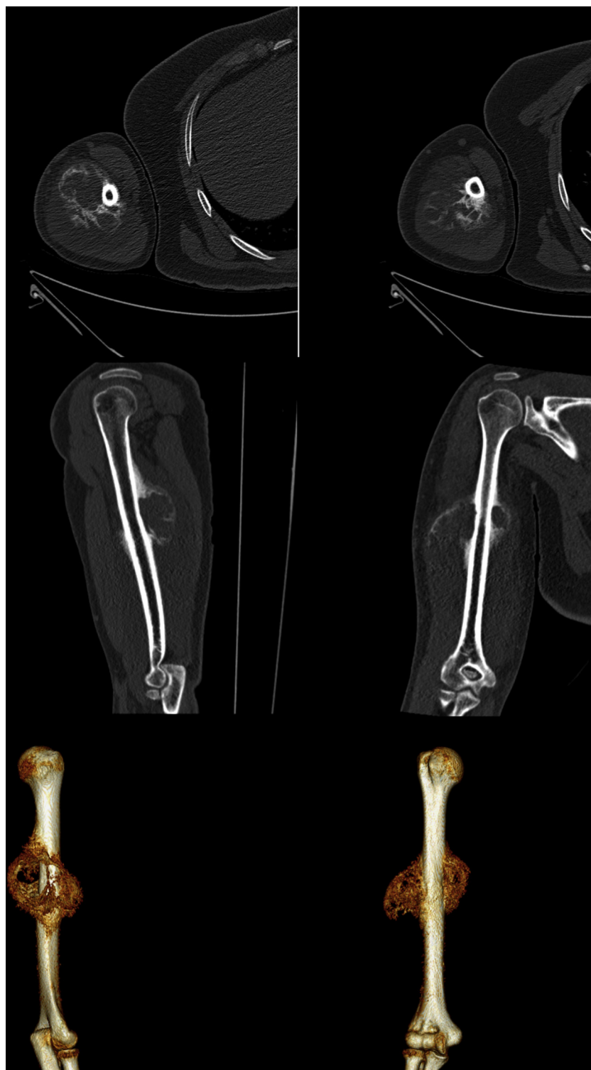
Figura 2 – Aspectos tomográficos.

parosteal do tumor de células gigantes subperiosteais, do hemangioma e do sarcoma osteogênico.