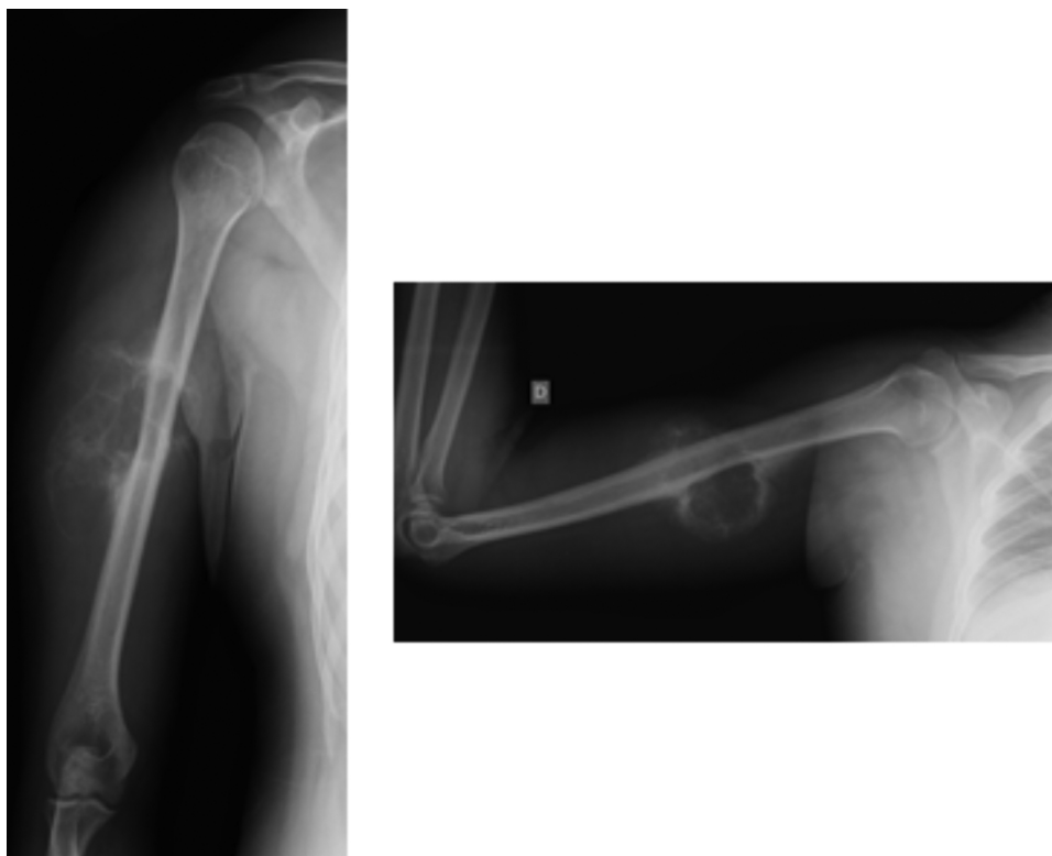
Figura 1 – Radiografia em AP e perfil de úmero direito.

A lesão desenvolve-se geralmente dentro do osso e causa afilamento cortical e eventualmente protrusão óssea. 4 Cistos localizados na cortical óssea são raros e eram previamente denominadas de tumor de células gigantes subperiosteais ou osteoclasia subperiosteal. 4 Lichtenstein, 9 em 1950, publicou artigo que elucidou e diferenciou o cisto ósseo aneurismático