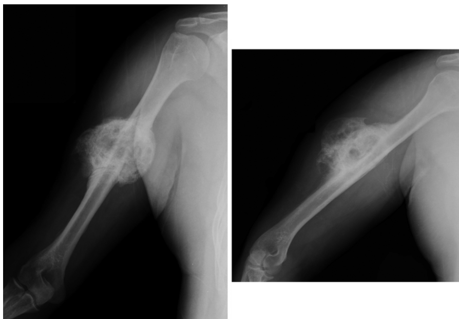
Figura 5 – Radiografias pós-operatórias.