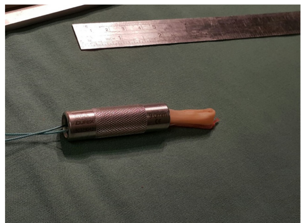
Figura 2 – Aferição do diâmetro do enxerto.

Dos 64 indivíduos analisados entre junho de 2012 e agosto de 2013, 60 (94%) eram do sexo masculino e quatro (6%) do feminino. A idade média dos pacientes foi de 31,78 \pm 8,26 anos (15-48 anos), no sexo feminino de 32 \pm 13,49 anos e no masculino de 31,76 \pm 7,97 anos. A altura média foi de 1,77 \pm 0,08 cm