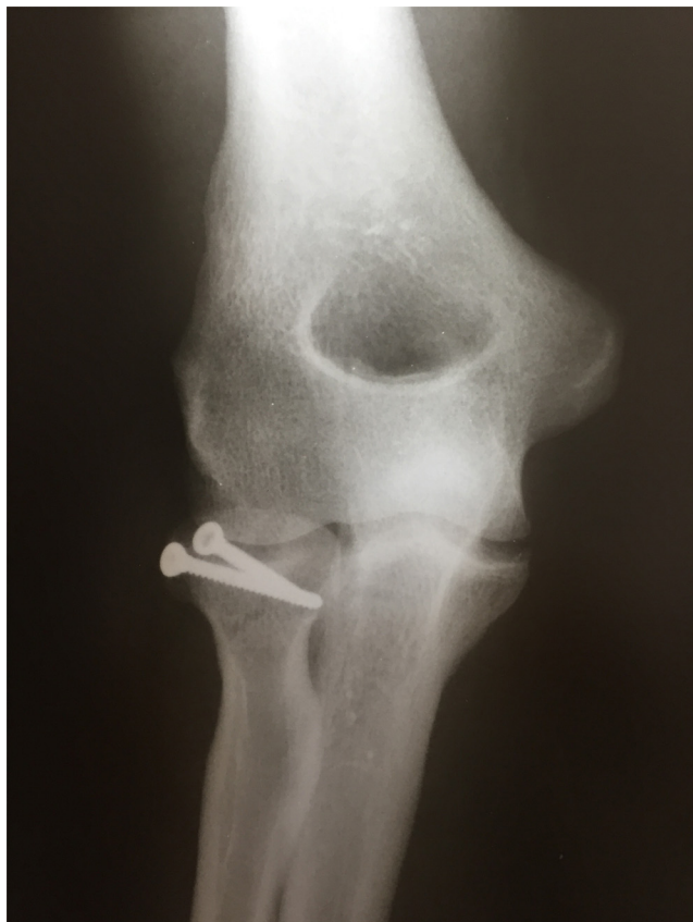
Figura 8 – Radiografia em AP do cotovelo pós-operatória que mostra a fixação do fragmento da cabeça com dois parafusos de microfragmentos.

pela fratura da cabeça do rádio sem desvio pode levar a compressão do NIP. 10 No nosso caso, acreditamos que a disfunção temporária do NIP foi devida à compressão tanto pelo hematoma intra-articular quanto pelo desvio anterior do fragmento da cabeça do rádio.