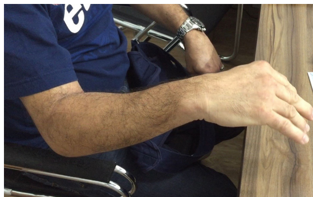
Figura 1 – Fotografia do paciente que mostra a incapacidade de extensão dos dedos no nível das metacarpofalanges.

Para exames complementares, foram solicitados inicialmente radiografias do cotovelo, nas quais foi evidenciada uma fratura da cabeça do rádio tipo III de Mason com fragmento de 40% da área da cabeça do rádio desviado anteriormente (fig. 2). Para melhor avaliação e visualização da fratura, foi solicitada uma tomografia computadorizada do cotovelo, na qual não foram observadas fraturas associadas (figs. 3 e 4). Pelo padrão de fratura e do déficit neurológico, optou-se pelo tratamento cirúrgico.