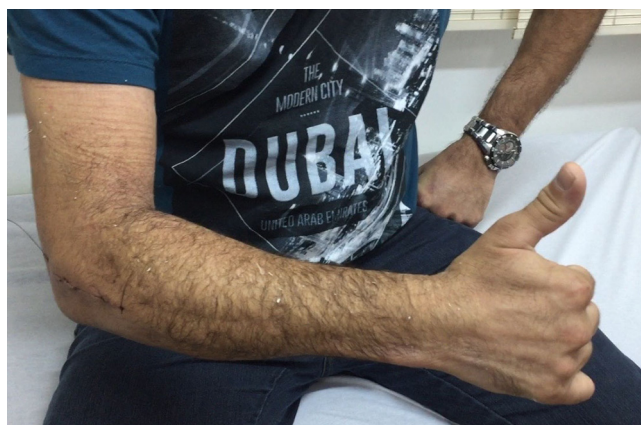
Figura 6 – Paciente no quinto dia de pós-operatório. Pode-se observar a extensão completa e a abdução do polegar.

das raízes de C6, C7 e C8 e algumas vezes de T1, é principalmente um nervo motor. O nervo radial é responsável pela inervação do tríceps, do antebraço e dos extensores radial longo e curto do carpo. 6-8