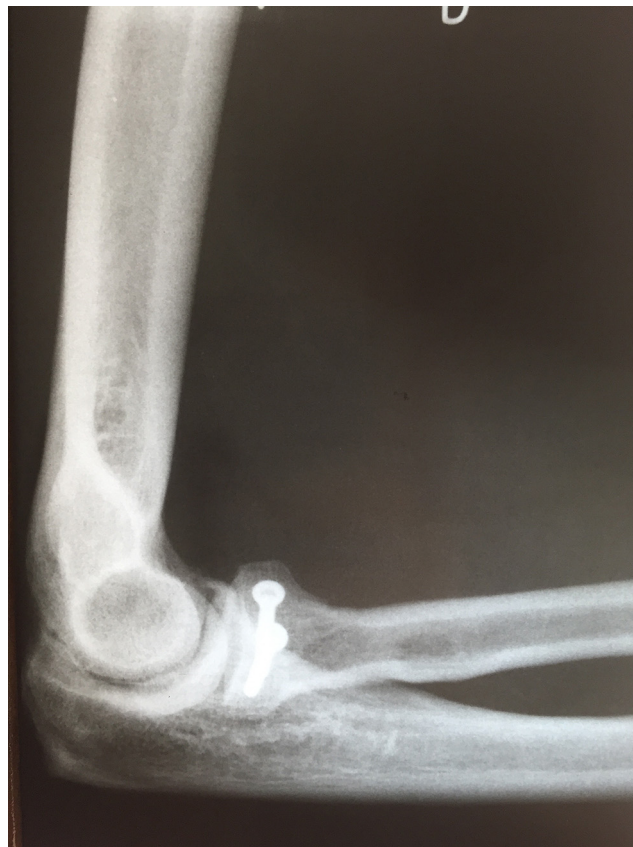
Figura 7 – Radiografia em perfil do cotovelo pós-operatória que mostra a fixação do fragmento da cabeça com dois parafusos de microfragmentos.

das raízes de C6, C7 e C8 e algumas vezes de T1, é principalmente um nervo motor. O nervo radial é responsável pela inervação do tríceps, do antebraço e dos extensores radial longo e curto do carpo. 6-8