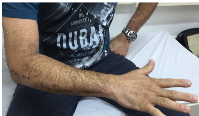
Figura 5 – Paciente no quinto dia de pós-operatório. Pode-se observar a extensão completa das metacarpofalangianas dos dedos.