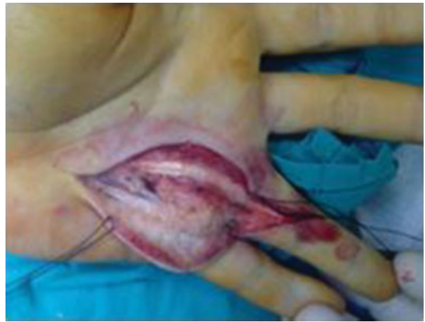
Fig. 4 Invasão tumoral dos tecidos moles rodeando os tendões flexores.

No exame macroscópico dos fragmentos biopsados, observavam-se formações nodulares constituídas por tecido esbranquiçado e firme. Microscopicamente, as áreas nodular compreendem proliferação de células de núcleo relativamente monomórfico, ovalado, com cromatina fina, mostrando citoplasma eosinófilo de limites mal definidos. Multifocalmente, observou-se agregação celular tipo “glo-