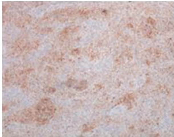
Fig. 7 Fotomicrografia do neurotequeoma com coloração imuno-histoquímica para proteína S100 (100 ×).

tumoral benigna com presumível origem na bainha nervosa. O termo neurotequeoma foi descrito por Gallager e Helwing em 1980 (do grego: theke – bainha) para conotar a aparência histológica em ninho. 2 Apesar das suas características serem sobreponíveis a outros tumores do tecido nervoso, como Schwannoma ou neurofibroma, é uma entidade clinicopatológica distinta. 4