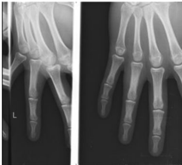
Fig. 1 Controle radiológico no seguimento do hospital de origem, em 2010.

Na ressonância magnética (RM) feita em 10 de outubro de 2012, observa-se, na vertente posterior dos tendões flexores do 4º dedo, uma lesão tumoral lobulada com epicentro na medula óssea da falange proximal do 4º dedo, hipointensa em T1, hiperintensa e ligeiramente heterogênea nas imagens ponderadas em T2 e densidade de prótons (DP) (►Fig. 3). Essa lesão condicionava insuflação da medula da porção proximal da primeira falange do 4º dedo, com aparente ruptura e erosão da cortical, envolvendo e rodeando os