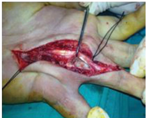
Fig. 5 Lesão tumoral intraóssea com destruição da cortical.

meruloide” centrada por pequeno capilar sanguíneo. A proliferação mostrou ser negativa para o antígeno da membrana epitelial (AME), mas foi fortemente imunorreativa para a proteína S100 (► Fig. 7). Tratava-se, portanto, de uma proliferação neoplásica de tecidos moles com diferenciação Schwânica com características histomorfológicas celulares e de estrutura que a enquadravam num neurotequeoma.