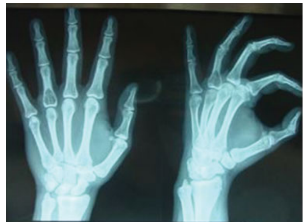
Fig. 2 Lesão intraóssea, lítica, septada, com insuflação da cortical, localizada na base da falange proximal do 4º dedo da mão esquerda.