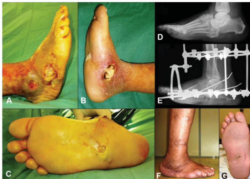
Fig. 1 Imagens lateral (A), medial (B) e plantar (C) do pé direito, mostrando a presença de múltiplas úlceras infectadas com necrose tecidual associada. Na imagem radiográfica pré-operatória, realizada na incidência lateral do pé, nota-se luxação talonavicular e saliência plantar do osso cubóide no mediopé (D). Após o debridamento cirúrgico e remoção do osso cubóide luxado, a imagem radiográfica na incidência lateral do pé mostra a estabilização da extremidade com o fixador externo circular (E). Seis meses após o tratamento foi possível evitar a amputação da extremidade e o pé encontra-se alinhado e livre da infecção e das úlceras (F e G).

Algumas infecções moderadas e todas as infecções profundas e graves necessitam de internação hospitalar imediata para início do tratamento o mais rápido possível a fim de reduzir o risco de amputação. 46,56 Nos casos graves, é mandatório realizar intervenção cirúrgica precoce voltada para drenar os abscessos profundos e remover, por meio de cuidadoso debridamento, tanto os tecidos moles desvitalizados quanto todo osso infectado e necrótico. Ênfase deve ser dada na recomendação para deixar a ferida operatória completamente aberta para permitir drenagem contínua e evitar a coleção de novo abscesso. 46,56 (→ Figura 1 ) Frequentemente, são necessárias múltiplas