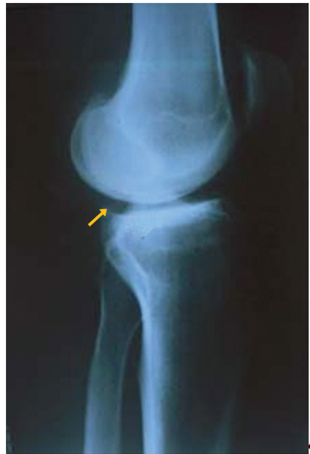
Fig. 1 Radiografia em perfil do joelho demonstrando anteriorização da tíbia em relação ao fêmur. Nota-se o osteófito posterior na tíbia, característico desta migração.

Consideraremos isoladamente as características de cada uma destas lesões; porém, elas ocorrem concomitantemente, podendo haver lesão meniscal com graus variáveis de lesões do osso subcondral e da cartilagem, ou qualquer outra associação de lesões.