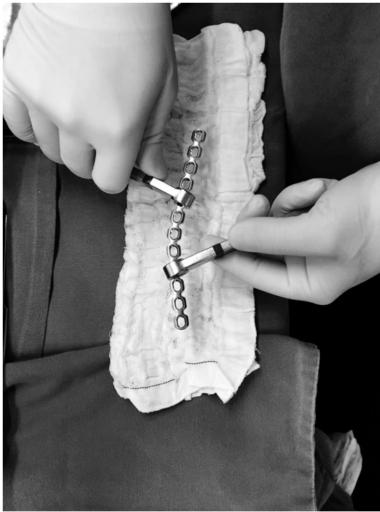
Fig. 3 Modelagem da placa.

posição superior, com instrumental para dissecação roma ( ► Figura 2 ). Modelagem da placa ( ► Figura 3 ) no intraoperatório, com convexidade anterior medial e convexidade posterior lateral, ambos ao nível do terceiro furo mais lateral e medial da placa, seguindo a forma clavicular na radioscopia. A placa é deslizada no túnel supraclavicular de medial para lateral, com a escápula mantida na posição de retração, fixação provisória com fios de Kirchner 2,5 mm (para avaliar o comprimento com auxílio da radioscopia), fixação da placa com 3 parafusos bicorticais em cada lado, de forma alternada, primeiramente pelo lado medial. É verificada a redução e o posicionamento final da placa e parafusos ( ► Figura 4 ). Feridas submetidas à irrigação com soro fisiológico 0,9%, e os planos profundos foram fechados com suturas mononylon 3.0 e sutura intradérmica 2.0.