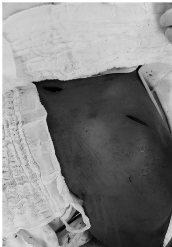
Fig. 2 Incisões medial e lateral.

Técnica cirúrgica (adaptada de Jung et al. 18 ): paciente em posição cadeira de praia, com auxílio da radioscopia nas incidências frontal da clavícula e crânio caudal modificada com inclinação aproximada de 70° (► Figura 1 ). Foi realizada manobra de redução da fratura (“Manobra de Kibler”) com o cirurgião segurando o braço do membro lesionado, direcionando o mesmo para posterior, levemente superior e rotação lateral do ombro, levando à aproximação da escápula ao gradil costal com rotação lateral, superior e inclinação posterior da