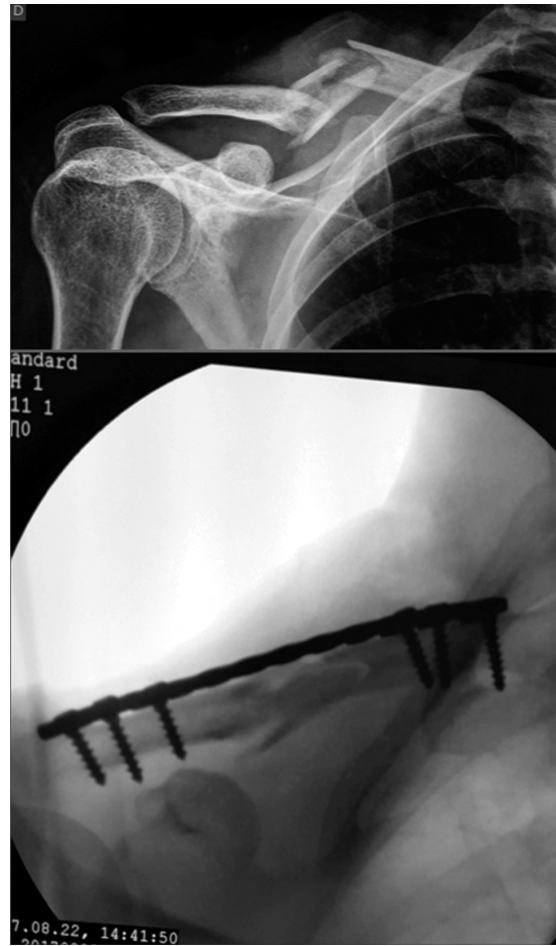
Fig. 4 Pré- e pós-fixação com técnica minimamente invasiva de osteossíntese.

Para análise estatística, a avaliação descritiva dos dados foi expressa por tabelas de distribuição de frequências, média e desvio padrão (DP). O teste Exato de Fisher foi utilizado para analisar as associações entre variáveis categóricas. O teste t