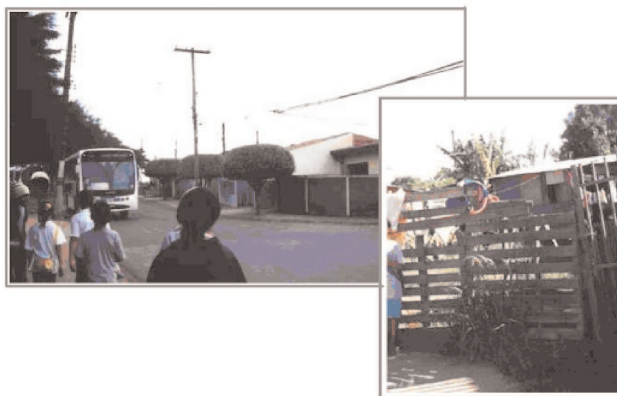
FIGURA 3 - Visita aos bairros legalizados e não legalizados