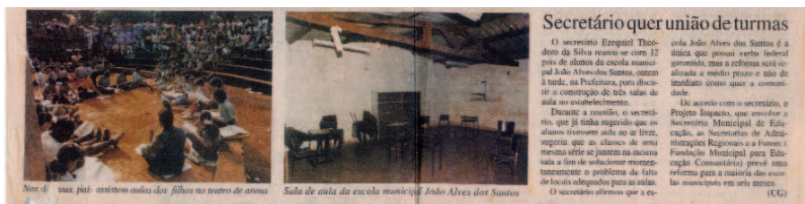
FIGURA 1 – Pais e alunos assistem aulas juntos ao ar livre