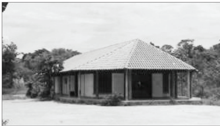
FOTO 1 - Vista parcial da escola Xukurank na Aldeia Barreiro Preto (06/2011). Imagem de um dos prédios de salas de aula.

para pesquisa, além de livros que narram a história Xakriabá. Possui também um computador com acesso à internet, que é usado não apenas para a realização de pesquisas pelos alunos, mas também como instrumento de acesso às redes sociais, por meio das quais ampliam o contato com a vida fora da aldeia. Sem dúvida alguma, a construção dos novos prédios escolares redimensionou as possibilidades do trabalho pedagógico no interior da instituição escolar.