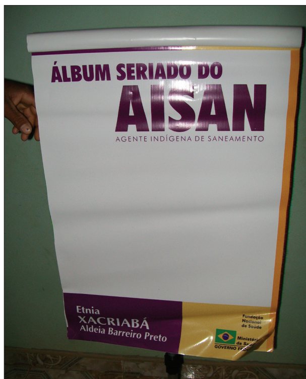
FOTO 2ª - Apresentação à comunidade realizada pelos próprios agentes indígenas.

Outro exemplo pode ser observado na área de saneamento básico, em que trabalhadores indígenas usam cada vez mais a linguagem escrita para levar à população informações acerca de como o sistema é realizado e como proceder para prevenção de doenças. A seguir, uma foto tirada de uma apresentação à comunidade realizada por um agente indígena de saneamento.