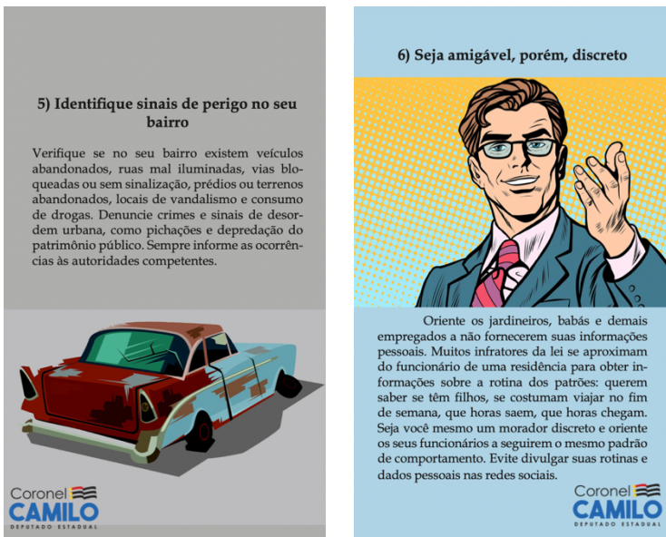
Figura 2 Descritivos de Conduta apropriada, Vizinhança Solidária

Esse projeto foi intitulado “Vizinhança Solidária” e passou a ser encabeçado como um programa amplo para todo o município e todo o estado, principalmente pelo deputado estadual “Coronel Camilo”. Percebe-se que essa ação de polícia comunitária coloca o comprometimento com a segurança como elemento determinante da cidadania, pois integra moradores, comerciantes e trabalhadores como parte do dispositivo. Como a cartilha do programa revela (Figura 2), exige-se uma contrapartida da comunidade, já que cidadãos e comerciantes têm uma maior responsabilidade na gestão da segurança local, isto é, na identificação de condutas suspeitas e instalação de sistemas de câmeras.