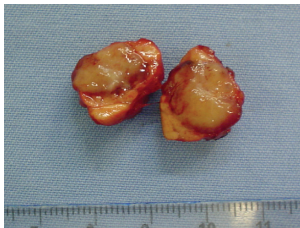
FIGURA 2 – Aspecto macroscópico do insulinoma (seccionado)

em pós-operatório de médio prazo, evoluindo com níveis de glicemia dentro da normalidade (98 mg/dL) e sem nenhum tipo de medicação.